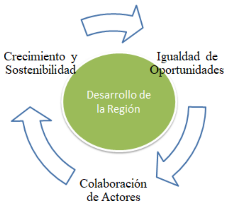
Figura 4. Factores que agrupan el desarrollo Económico Social de la Región.

colaboración de actores para llegar al desarrollo económico de la región como se observa en la figura 4.