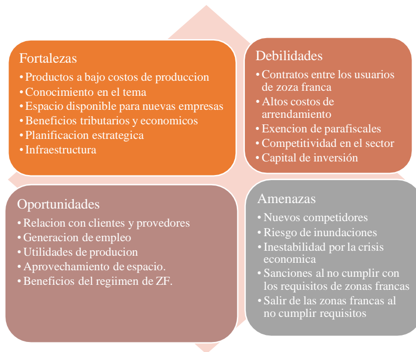
Figura 2. Análisis DOFA. Nota. Análisis de las Fortalezas, Debilidades, Oportunidades y Amenazas. 2021.