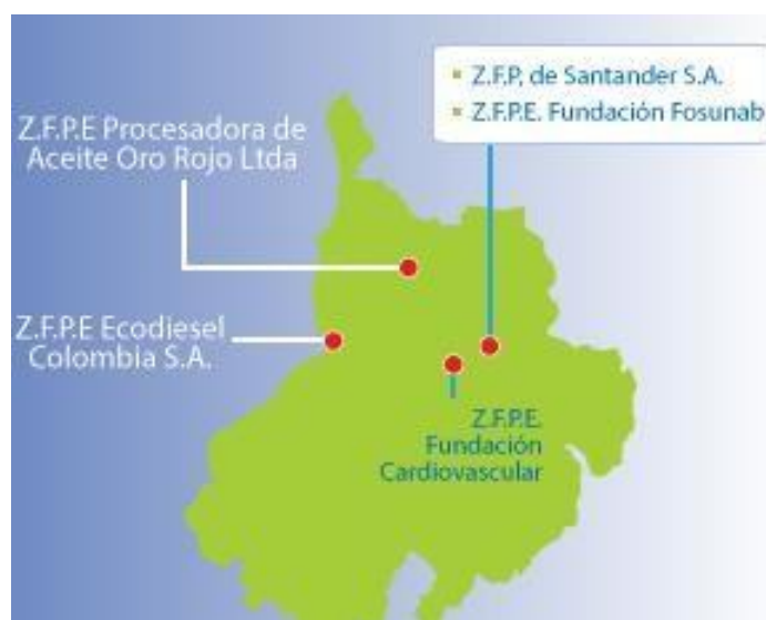
Figura 1. Ubicación Zonas Francas en Santander.

Dentro del contexto regional, Santander actualmente cuenta con seis zonas Francas permanentes Ubicadas en los municipios de Floridablanca, Piedecuesta, Barrancabermeja y Sabana de Torres como se observa en la figura 1.