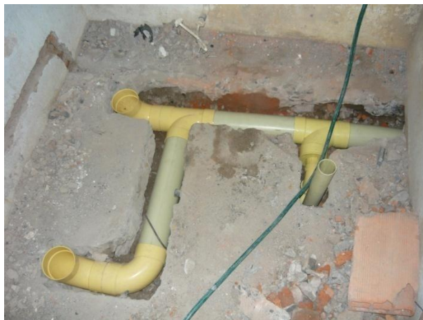
Figura 25. Instalación Redes Sanitarias

Luego de tener el machimbre totalmente instalado se procedió a ubicar todas las redes hidro-sanitarias, durante el desarrollo de esta actividad se llevó un estricto control sobre la ubicación de la tubería para garantizar que toda quedara instalada de acuerdo con lo estipulado en los planos y que los tubos no sufrieran ningún daño que pudieran causar problemas más adelante (Ver Figura 25).