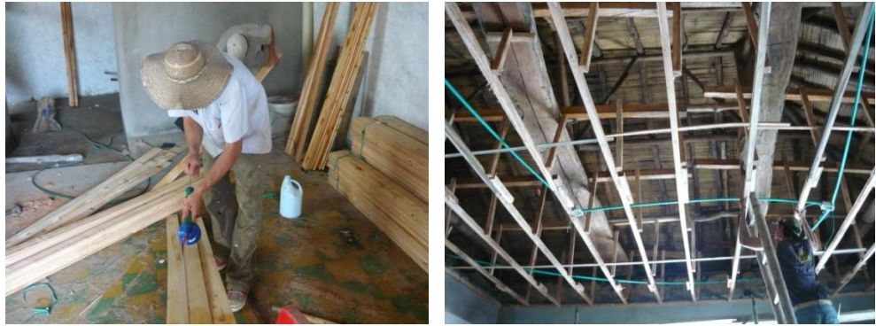
Figura 24. Inmunización e Instalación Del Machimbre

Una vez frisado todo el interior de la casa y ubicadas las redes eléctricas se procedió a inmunizar e instalar el machimbre, para ello fue necesario armar una estructura en madera que sirviera para anclar el nuevo machimbre evitando así que este se cayera (Ver Figura 24).