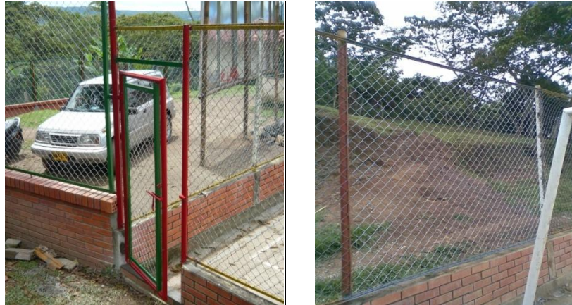
Figura 16. Actividades Adicionales

Después que las actividades adicionales estuvieron totalmente terminadas se recibió la última visita por parte de la interventoría y se levantó el acta de recibo final (Ver Figura 16 y 17). Ese mismo día se entregó a la interventoría un análisis de cantidades de mayores y menores, la bitácora (Ver Anexo 3) y el registro fotográfico de todo el proceso de construcción.