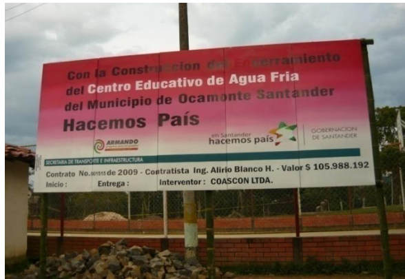
Figura 14. Valla Informativa

Mientras se terminaba de instalar el ladrillo T-1 se llevó e instaló la valla informativa para de esta manera dar al requisito establecido por la gobernación (Ver Figura 14). Después de terminada la construcción de los muros se continuo con la fundición de las columnas, las cuales le darían estabilidad a los tubos de soporte de la malla. Durante el desarrollo de esta actividad se recibió la visita de las supervisoras tanto de la gobernación como del municipio (Ver Figura 15).