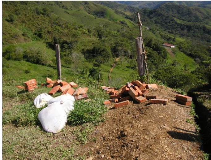
Figura 46. Materiales Para Cámaras de Quiebre.

Cuando ya se tenía instalada gran parte de la tubería se subió todo el material necesario para la construcción de las cámaras de quiebre y se ubicó en cada uno de los puntos previamente definidos (Ver Figura 46). Paralelo a esto se recibió una visita de la Interventoría en la cual se realizó un recorrido de todo el acueducto, como resultado de esta visita se cambió la ubicación del tanque de almacenamiento (Ver Figura 47), además se entregó la bitácora actualizada (Ver Anexo 3) una copia del registro fotográfico.