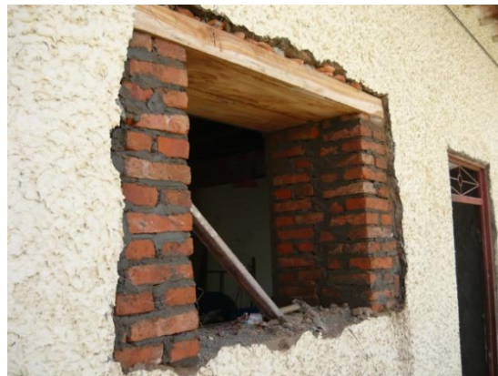
Figura 21. Ventana Nueva

El paso siguiente fue retirar la capa de pintura existente en las paredes de tapia y la ubicación de las nuevas ventanas, debido a que las paredes eran en tapia fue necesario construir unas columnas en ladrillo tolete para controlar el peso de la tierra, adicional a eso se instalaron también unos dinteles en madera (Ver Figura 21).