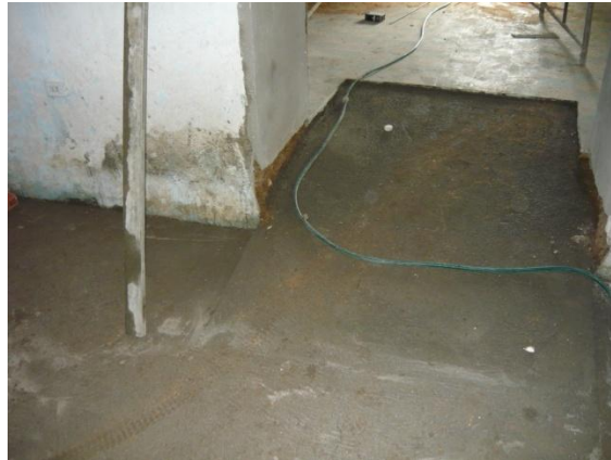
Figura 26. Rampa de Acceso

Luego de instalar toda la tubería se realizó la nivelación del piso y para cumplir con uno de los requisitos del ICBF se construyó un rampa de acceso del salón principal al área de la cocina y los baños (Ver Figura 26). Otros requisitos que se cumplieron fue el de dejar el muro del baño de los niños a una altura de 1.20 m para permitir de esta manera que el encargado de cuidar a los niños pueda vigilarlos mientras estos van al baño.