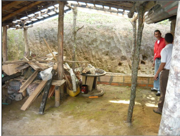
Figura 1. Condición Inicial Cocina.

Antes de ejecutar el proyecto se realizó una visita preliminar a cada uno de los beneficiarios para concertar con ellos la ubicación final del mejoramiento. Al finalizar cada visita se levantó un acta en la cual se justificó por que el propietario debía recibir el mejoramiento, además del acta se dejó registro fotográfico del lugar escogido por el beneficiario para realizar la obra (Ver Figura 1).