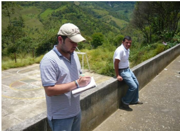
Figura 5. Visita a Cada Escuela.

Para la elaboración de este proyecto fue necesario visitar las escuelas y realizar el levantamiento del plano de cada una de ellas, además en cada visita se concertó con los docentes el lugar donde estarían ubicadas las unidades sanitarias y se tomo el respectivo registro fotográfico del mismo. (Ver Figura 5, 6 y 7).