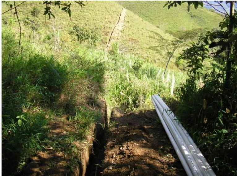
Figura 42. Ubicación de Tubería.

Mientras eran realizadas las excavaciones se pidió la tubería necesaria para los diferentes tramos y se subió hasta el lugar donde iba ser instalada (Ver Figura 42). Al mismo tiempo se elaboró y envió la relación de pagos de la nomina (Ver Anexo 2). Durante las excavaciones se encontró gran cantidad de roca lo que ocasionó que el trabajo se realizara más lentamente (Ver Figura43).