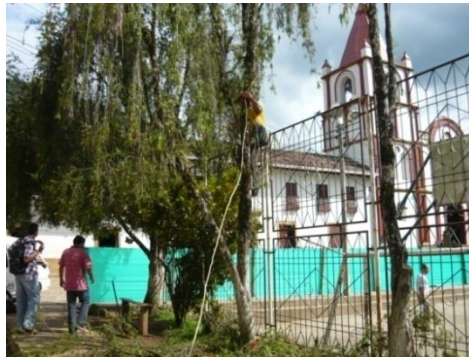
Figura 30. Tala de Arboles