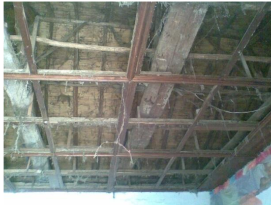
Figura 19. Demolición de Machimbre