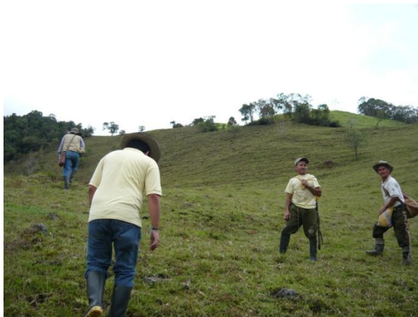
Figura 40. Levantamiento Topográfico.

Lo primero que se llevó a cabo fue el levantamiento topográfico de todo el recorrido ya que los de los levantamientos anteriores no se encontró registro alguno en la alcaldía (Ver Figura 40), luego se diseñó el acueducto para finalmente entregar la propuesta de trabajo a la empresa Aguasan A.P.C. encargada de los servicios públicos en el municipio de Encino.