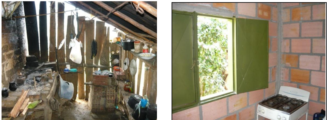
Figura 3. Antes y Después de una Cocina.

Luego de terminadas todas las obras y realizadas todas las visitas de entrega final se procedió a elaborar el informe final del contratista y todo el proceso necesario para liquidar el contrato. En este informe se expuso el proceso mediante el cual se llevó a cabo la ejecución de la obra, se dieron a conocer los soportes que tuvo el proyecto como jurídico y financiero, se describió cada una de las actividades realizadas y se sustentaron las modificaciones que hicieron a las cantidades originales del proyecto. Además se mostró por medio del registro fotográfico el antes y después de cada uno de los lugares donde se realizaron las obras. (Ver Figuras 3 y 4).