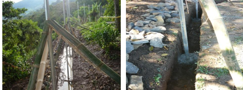
Figura 9. Ubicación Tubos Galvanizados

Figura 9). Durante el tiempo en el que se fundió el cemento ciclópeo se recibió la primera visita por parte de la interventoría, la cual se mostró satisfecha con el trabajo que se había realizado hasta ese momento (Ver Figura 10).