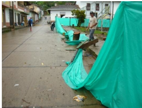
Figura 31. Destrucción por el Clima.

Luego de solucionar todos los inconvenientes relacionados con el cerramiento se procedió a levantar el piso de los senderos, y de los andenes. Esta actividad fue definitiva ya que se cambió por completo la distribución del parque que antes era en un solo nivel y ahora es hasta en tres niveles. Lo que se hizo nivelar totalmente el área del centro del parque y tomar este nivel como guía para el resto de la obra, de esta manera la distribución de los niveles hacia los senderos se realizó por medio de escalones (Ver Figura 32).