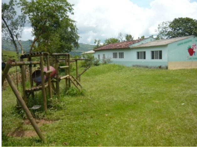
Figura 6. Escuela Beneficiada

El siguiente documento que se elaboró y que exige la gobernación en todos los proyectos fue la guía ejecutiva, este documento tiene un formato especial determinado por la gobernación que al llenarlo se obtiene un resumen completo de la información del proyecto.