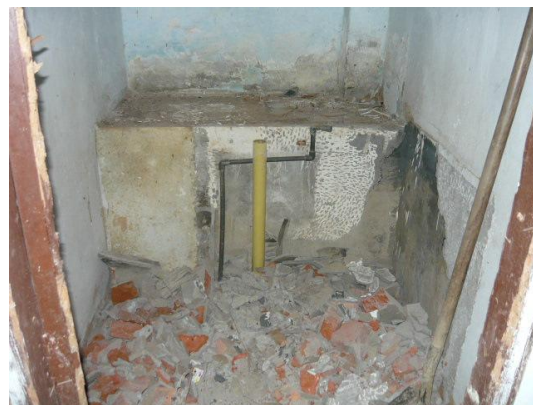
Figura 20. Demolición Unidades Sanitarias

El paso siguiente fue retirar la capa de pintura existente en las paredes de tapia y la ubicación de las nuevas ventanas, debido a que las paredes eran en tapia fue necesario construir unas columnas en ladrillo tolete para controlar el peso de la tierra, adicional a eso se instalaron también unos dinteles en madera (Ver Figura 21).