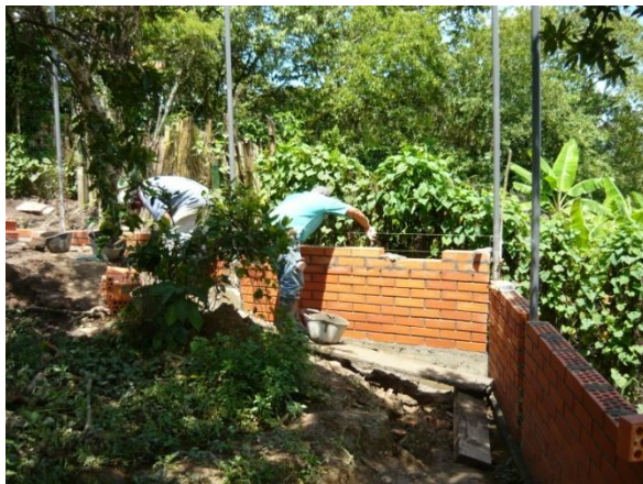
Figura 13. Muros en Ladrillo T-1

Mientras la viga era terminada de fundir se pidió el ladrillo T-1 y los demás materiales necesarios para levantar los muros de cada uno de los tramos, además se encargó la valla informativa del proyecto. Cuando la viga estuvo totalmente terminada se procedió a levantar los muros en cada uno de los tramos (Ver Figura 13).