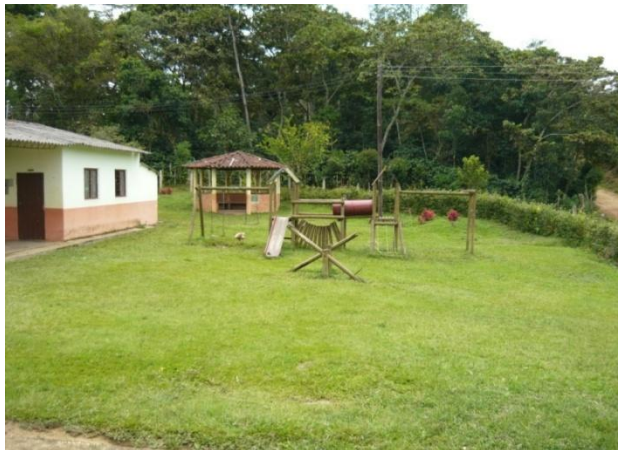
Figura 7. Escuela Beneficiada

Luego de terminadas la MGA y la guía ejecutiva se procedió a elaborar y recopilar todos los demás documentos necesarios para organizar la propuesta como son, las cartas y certificaciones de la alcaldía, los documentos del contratista, los balances del contratista, los formatos de experiencia tanto específica como general del contratista y todos los establecidos en los pliegos de condiciones finales publicados por el municipio.