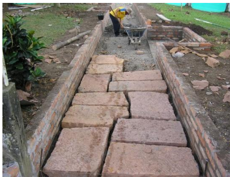
Figura 39. Instalación de Piedra Barichara

Después de compactar toda la base aplicada en los senderos se procedió a instalar la piedra Barichara en los mismos, para este proceso se aplicó una capa de mortero sobre la cual se extendieron las piedras teniendo cuidado en no dejar la brecha muy gruesa con el fin de obtener el mejor aspecto de la misma (Ver Figura 39).