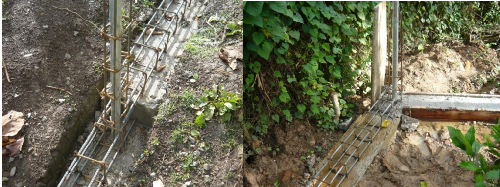
Figura 12. Fundición Viga de Cimentación

Al mismo tiempo que se armaba la estructura en hierro para la viga de cimentación y las columnas se iba ubicando la formaleta, luego de ubicadas estas e introducido el hierro en ellas se procedió a fundir la viga de cimentación (Ver Figura 12). Para que el rendimiento en esta actividad fuera mayor los obreros fueron repartidos en dos cuadrillas una se encargaba de acomodar las formaletas y el hierro y la otra iba detrás fundiendo la viga.