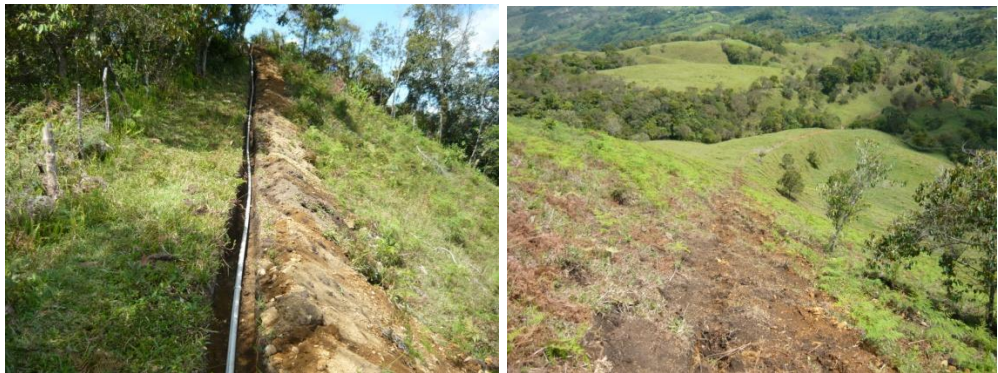
Figura 44. Instalación de Tubería.

Luego de terminar de subir toda la tubería se comenzó a instalar teniendo en cuenta la relación diámetro espesor (RDE). En este proceso los obreros fueron divididos en dos grupos mientras unos iban uniendo y extendiendo la tubería dentro de la zanjas los otros los seguían cubriéndola (Ver Figura 44). Por otro lado todas las uniones de los tubos se dejaron descubiertas y se verificó que esta se hubiera instalado de manera correcta cumpliendo con los RDE en cada tramo (Ver Figura 45).