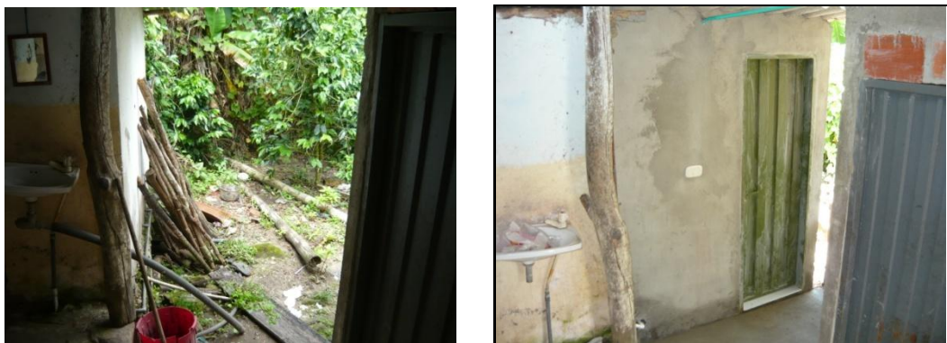
Figura 4. Antes y Después de un Baño.