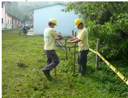
Figura 11. Armado de Flejes

Cuando ya se había avanzado considerablemente con la fundición del cemento ciclópeo se pidió el hierro necesario para la viga de cimentación, luego de que este llegara se comenzaron a doblar los flejes y a cortar la varillas para la viga (Ver Figura 11). Mientras todas estas actividades eran llevadas a cabo se mantenía un control diario de la asistencia de los empleados para entregar al contratista la relación de los días laborados por cada uno de ellos (Ver Anexo 2).