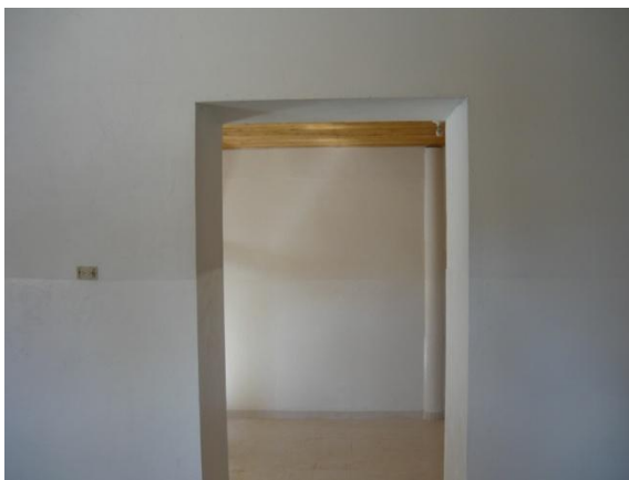
Figura 27. Acabados de Pintura

Un requisito que exige el ICBF es la forma como se pinte el hogar ya que es necesario que la pintura que se aplique pueda ser lavable, para cumplir con este aspecto se decidió aplicar dos manos de pintura doméstica hasta una altura de 1.50m y al resto de la pared se le aplico pintura para interiores (Ver Figura 27). Mientras se pintaban las paredes se escogieron y pidieron los enchapes de los baños y la cocina.