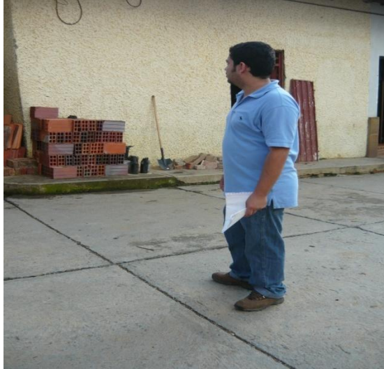
Figura 22. Verificación de Materiales.

Al mismo tiempo que se retiraba la pintura y se abrían las ventanas en las paredes se pidieron los materiales necesarios para frisar todo el interior de la casa, cada una de las ordenes que se enviaban a la ferretería se comparaba con las cantidades que llegaban a la obra y se verificaba que coincidieran (Ver Figura 22).