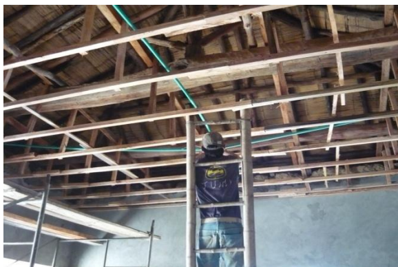
Figura 23. Instalación Redes Eléctricas

Después de tener las paredes totalmente limpias se procedió a instalar las redes eléctricas necesarias para abastecer los nuevos puntos establecidos (Ver Figura 23). Posteriormente se frisó el interior de la casa empezando por el salón principal, luego la cocina y finalmente el área de los baños. Simultáneamente con esta actividad se reemplazaron las tejas que se encontraban partidas en la cubierta.