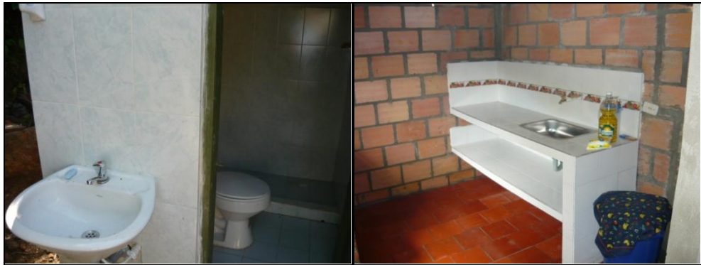
Figura 2. Baño y Cocina Terminados

Luego de terminadas todas las obras y realizadas todas las visitas de entrega final se procedió a elaborar el informe final del contratista y todo el proceso necesario para liquidar el contrato. En este informe se expuso el proceso mediante el cual se llevó a cabo la ejecución de la obra, se dieron a conocer los soportes que tuvo el proyecto como jurídico y financiero, se describió cada una de las actividades realizadas y se sustentaron las modificaciones que hicieron a las cantidades originales del proyecto. Además se mostró por medio del registro fotográfico el antes y después de cada uno de los lugares donde se realizaron las obras. (Ver Figuras 3 y 4).