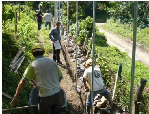
Figura 10. Primer Visita de Interventoría

Cuando ya se había avanzado considerablemente con la fundición del cemento ciclópeo se pidió el hierro necesario para la viga de cimentación, luego de que este llegara se comenzaron a doblar los flejes y a cortar la varillas para la viga (Ver Figura 11). Mientras todas estas actividades eran llevadas a cabo se mantenía un control diario de la asistencia de los empleados para entregar al contratista la relación de los días laborados por cada uno de ellos (Ver Anexo 2).