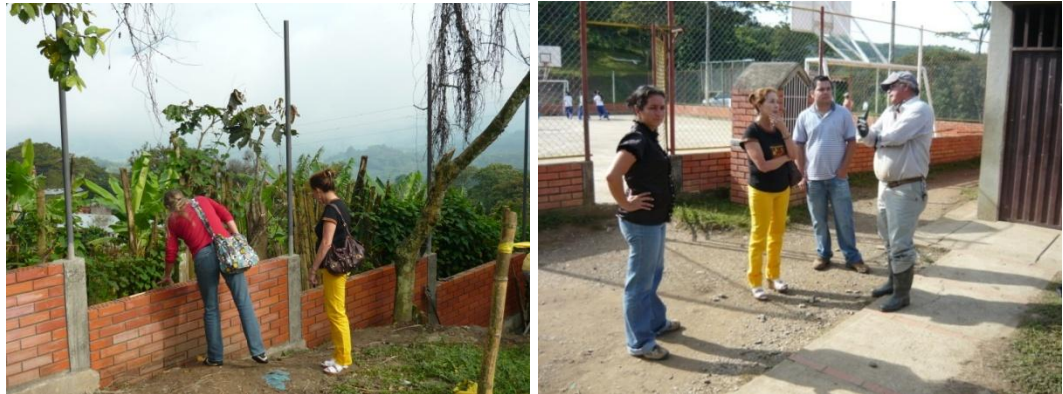
Figura 15. Visita Supervisor

Para dar por terminados los muros en ladrillo T-1 se instaló la respectiva alfajía, al mismo tiempo que se llevaba a cabo la instalación de esta se comenzaron a llevar los módulos de malla y el portón para posteriormente ser instalados. Paralelo a esto se realizó un informe parcial para entregar tanto a la interventoría como a las supervisoras del proyecto.