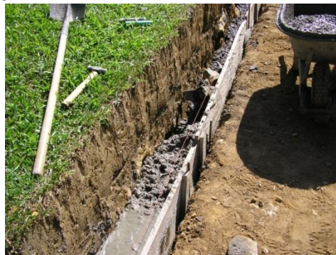
Figura 36. Cimiento Ciclópeo.

Al mismo tiempo que se realizaban las excavaciones también se ubicaban los nuevos espacios para ubicar las bancas. Después de terminada gran parte de las excavaciones se procedió a fundir el cimiento ciclópeo para los muros de los senderos (Ver Figura 36). Durante el desarrollo de cada una de estas actividades el registro fotográfico fue actualizado cada 2 días, la relación de pagos de nomina (Ver Anexo 2) se realizó cada 15 días y la bitácora cada semana.