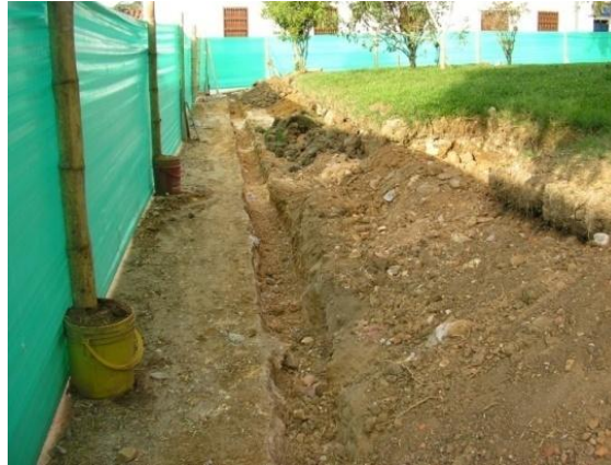
Figura 33. Excavación en Material Común Andenes

quedaran de 25cm de altos. Para lograr esto se realizó una gran cantidad de excavación en material común y se modificaron varios escalones que servían originalmente para acceder al parque (Ver Figura 33).