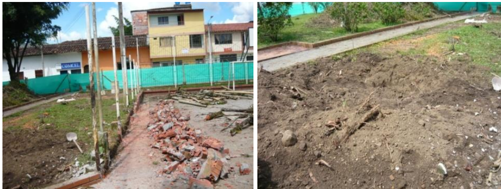
Figura 34. Replanteo Área de Tarima y Baños

Mientras se realizaba la nivelación de las senderos y andenes también se llevaba a cabo el descapote y replanteo del área donde se ubica la tarima, los baños y la gradería, para esto fue necesario retirar la malla de protección que rodeaba la cancha y demoler el muro donde esta estaba incrustada, al mismo tiempo se retiraron todas la raíces de los árboles talados (Ver Figura 34). Otra actividad que se llevó a cabo fue la compra e instalación de la valla informativa (Ver Figura 35). Otros muros que se demolieron en su totalidad fueron los que delimitaban los senderos, esto con el fin de ampliar los mismos y construir unos muros adecuados para ser enchapados.