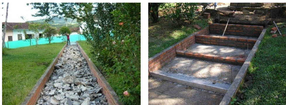
Figura 32. Demolición de Piso en Senderos

Luego de solucionar todos los inconvenientes relacionados con el cerramiento se procedió a levantar el piso de los senderos, y de los andenes. Esta actividad fue definitiva ya que se cambió por completo la distribución del parque que antes era en un solo nivel y ahora es hasta en tres niveles. Lo que se hizo nivelar totalmente el área del centro del parque y tomar este nivel como guía para el resto de la obra, de esta manera la distribución de los niveles hacia los senderos se realizó por medio de escalones (Ver Figura 32).