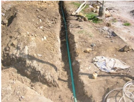
Figura 38. Instalación Redes Eléctricas

Para mejorar la superficie de los senderos se aplico una capa de sub-base a cada uno de ellos, después se compactó con el fin de entregarles a los encargados de la instalación de la piedra la superficie en las mejores condiciones. En los andenes fue necesario aplicar más de una capa de sub-base debido a que la piedra de la mesa de los santos es mucho más delgada que la de Barichara y necesita menos espacio para ser instalada.