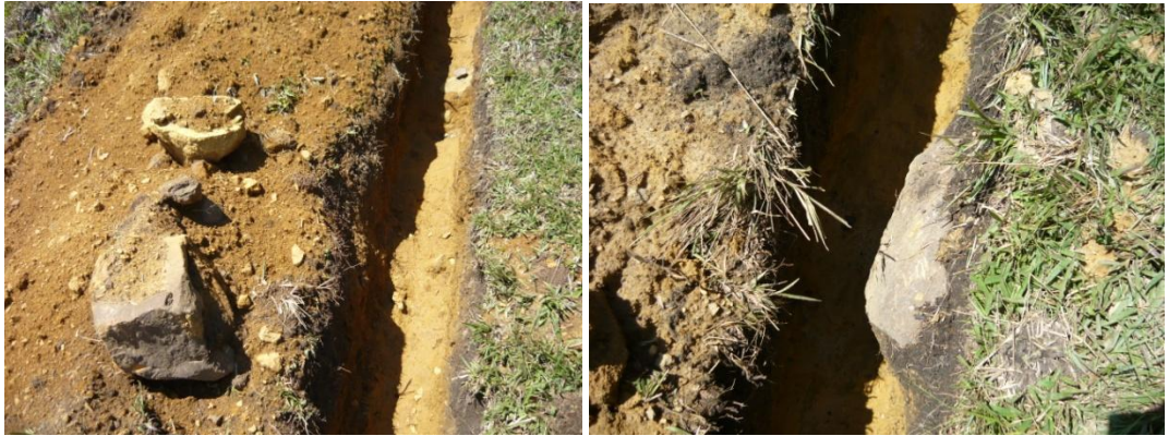
Figura 43. Excavación en Roca

Luego de terminar de subir toda la tubería se comenzó a instalar teniendo en cuenta la relación diámetro espesor (RDE). En este proceso los obreros fueron divididos en dos grupos mientras unos iban uniendo y extendiendo la tubería dentro de la zanjas los otros los seguían cubriéndola (Ver Figura 44). Por otro lado todas las uniones de los tubos se dejaron descubiertas y se verificó que esta se hubiera instalado de manera correcta cumpliendo con los RDE en cada tramo (Ver Figura 45).