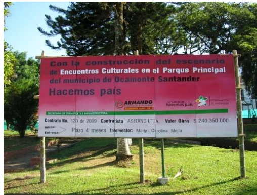
Figura 35. Valla informativa

Luego de realizar la nivelación y ampliación de los senderos se empezaron las excavaciones para el cimiento ciclópeo sobre el cual se levantarían los nuevos muros de los senderos, estos muros se construyeron en ladrillo tolete para ser enchapados en piedra de la Mesa de los Santos. Paralelo a estas actividades se fue acordando las condiciones en las que debía ser entregar tanto los pisos como los muros a los encargados de instalar la piedra.