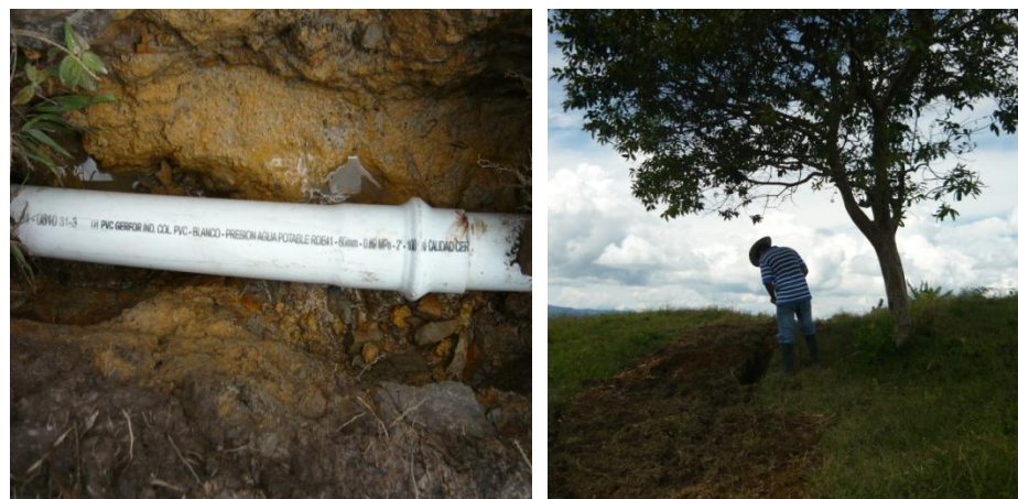
Figura 45. Revisión de RDE en las Uniones.