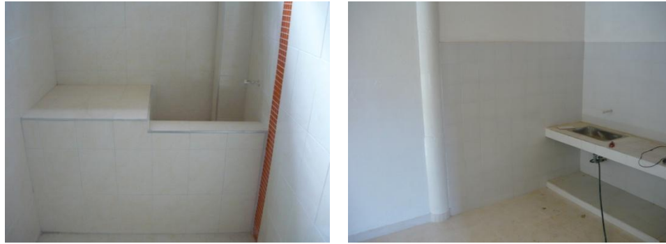
Figura 28. Acabado Enchape de Baños y Cocina

Una vez aplicada toda la pintura se procedió a enchapar el área de los baños y de la cocina, para los baños se escogió un enchape color beige adornado con una cenefa de color naranja, mientras que en la cocina se utilizó un enchape de color blanco (Ver Figura 28). En el piso de estas dos áreas se instaló una cerámica de color beige y la rampa se cubrió con granito ya que por seguridad para los niños esta superficie no debe ser lisa.