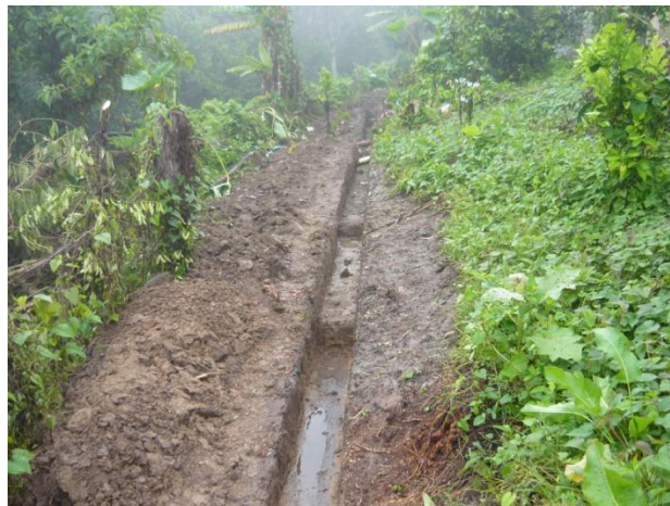
Figura 8. Excavación para Cimentación

Después de terminado el replanteo se iniciaron las excavaciones para la cimentación, estas excavaciones se hicieron de 25cm de ancho y su profundidad varió debido a que el terreno era irregular y fue necesario hacer escalones en algunos tramos. Paralelo al desarrollo de esta actividad se pidieron los materiales necesarios para fundir el concreto ciclópeo y se mantuvo actualizado tanto el registro fotográfico como la bitácora. (Ver Figura 8).