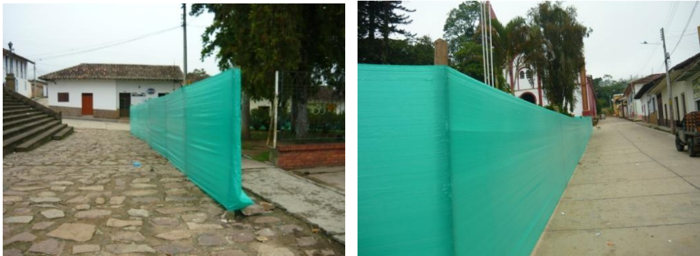
Figura 29. Cerramiento Parque Ocamonte.

La primera actividad que se llevó a cabo fue la construcción del cerramiento para el cual se utilizaron 295m de lona verde de 2 m de ancho y 20 postes de madera 2.30m de largo (Ver Figura 29), durante el desarrollo de esta actividad a los obreros se les solicitó copia de su documento de identidad para realizar la afiliación a la seguridad social y cada uno firmó el correspondiente contrato.