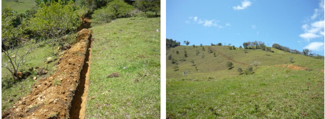
Figura 41. Excavación para Tubería.

Como primera medida se realizó una reunión con todos los obreros contratados y se concertaron todas las condiciones de trabajo, se recogieron sus identificaciones para afiliarlos a seguridad social. Después de dejar claras las condiciones de trabajo se procedió a dar comienzo a las excavaciones para instalar la tubería, la zanja se definió de 0.60m de profundidad como mínimo y de 0.40m de ancho (Ver Figura 41).