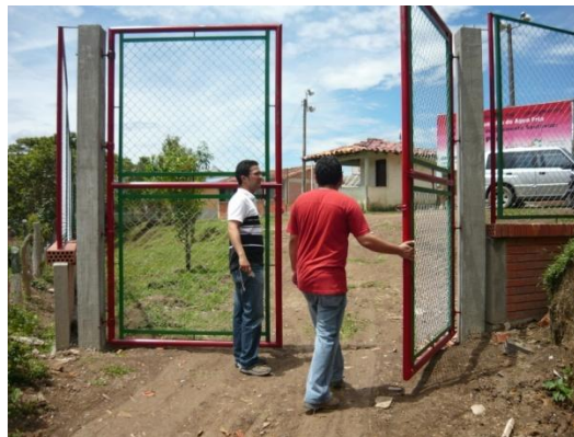
Figura 17. Ultima Visita Interventoria

Luego de esta visita se comenzó con el proceso de liquidación tanto del contrato como del convenio, para esto se organizaron dos carpetas en las que estaban contenidas todas las actas y documentos referentes al proceso de este proyecto. De estas carpetas se entregó copia a la interventoría, a la gobernación y al municipio.