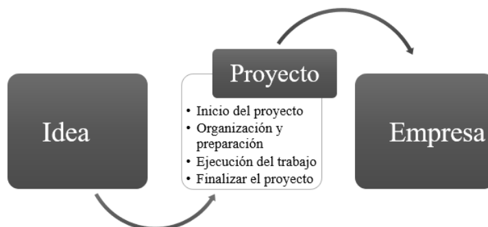
Figura 1. Ciclo de vida del proyecto.

Tales emprendedores inician su actuación a partir del surgimiento de una idea de negocio para satisfacer una necesidad o aprovechar una oportunidad en el mercado. En el marco de la formalidad, estas ideas conducen a la formulación, ejecución y evaluación de un proyecto, que se define como “un esfuerzo temporal que se lleva a cabo para crear un producto, servicio o resultado único” (PMI Inc., 2017, p. 4). Así pues, los proyectos se crean para “cumplir requisitos regulatorios, legales o sociales; satisfacer las solicitudes o necesidades de los interesados; implementar o cambiar las estrategias del negocio; así como, crear, mejorar o reparar productos, procesos o servicios” (PMI Inc., 2017, p. 7); también, pueden ser el punto de partida para la creación de empresa rentable y sostenible (ver ilustración 1).