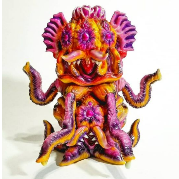
Figura 19. Dragón.

Estos referentes son piezas actuales de juguetes que en alguna manera se relacionan con la intención estética de la propuesta que hemos realizado, desde la imagen de lo corporal y lo monstruoso