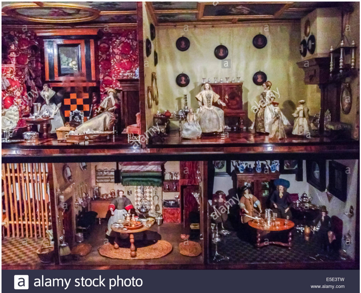
Figura 4. Casa de muñecas holandesa.

Cerca al siglo XVII aparece la primera producción de un juego de mesa pensado para el público infantil: el Juego de la Oca”, una especie de recorrido donde dos jugadores avanzan lanzando los dados. Las casillas podían ayudarte a avanzar o a retroceder y el primero en llegar al final era el ganador. Este juego de mesa ayuda a los niños a dejar volar su imaginación, se plantea como una representación de la vida y el viaje, en donde el jugador se enfrenta a múltiples obstáculos. Es el principio de los juegos de mesa que