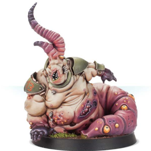
Figura 18. Desata el engendro/ Games workshop.