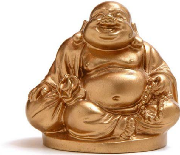
Figura 13. Budha, Fuente: https://bit.ly/3aUs4iN