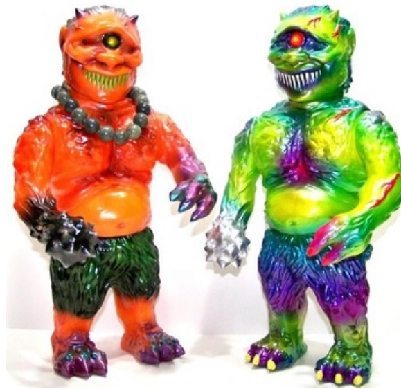
Figura 17. Mutantes por Vinyl hardcore.