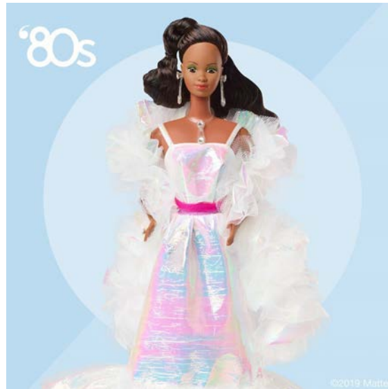
Figura 7. Barbie.

La Barbie es el caso de la muñeca más popular de Norteamérica. Ella representaba los valores femeninos de la época. La muñeca funcionaba como una especie de mediador social que buscaba continuar los valores tradicionales de la mujer en el hogar y el hombre como sustento económico. Esta tradición de roles en los juguetes no se alteró durante mucho tiempo, ni aun por el movimiento feminista durante los años 60. (Brian Volk-Weiss, 2018).