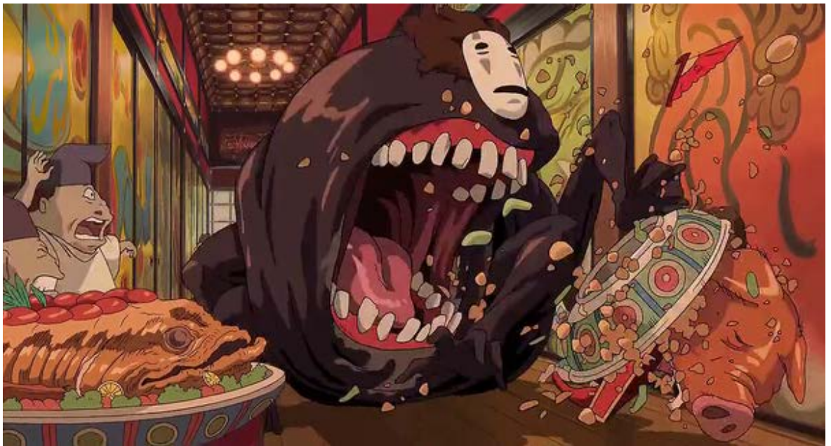
Figura 15. El Viaje de Chihiro por Hayao Miyazaki. Fuente: Studio Ghibli. El viaje de Shihiro, 2001.