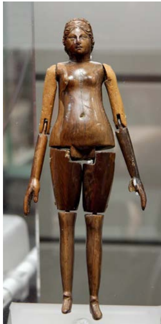
Figura 1. Muñeca romana.

En otro lugar, cerca del año 206 a de C. se desarrollaría en China la cometa. No son los primeros en intentar algo parecido: En Indonesia durante el paleolítico ya había registros de objetos similares: