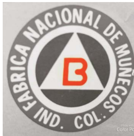
Figura 9. Logotipo Fabrica Nacional de muñecos

Importing co., que producía pelotas y figuras de animales. La Fábrica Nacional de Muñecas de Bogotá produjo muñecas primero de aserrín y yeso, luego de plástico cuando nació su competencia Plastiflex. Conformada por ex-socios de la primera, Plastiflex llegaría a ser conocida como la número 1 en muñecas (Biblioteca Luis Ángel Arango, 2012).