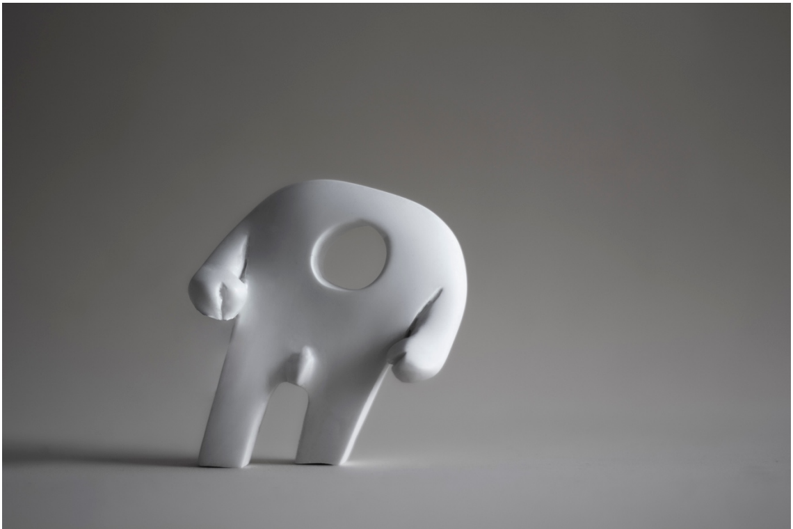
Figura 11. El hombre endeudado por Hernando Blandón (2019).

producto o serie de productos únicos, el art toy trate de hacer una tirada más larga pero no en escalas comerciales.