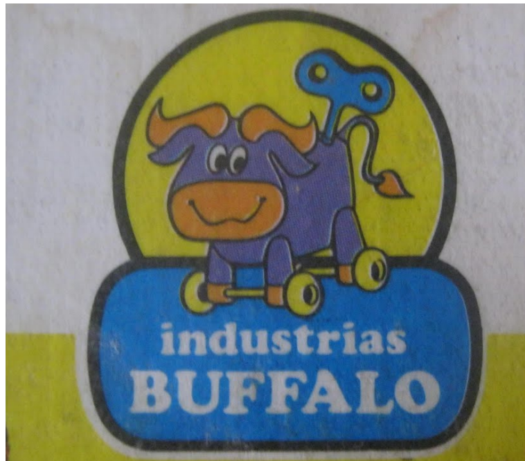
Figura 10. Antiguo logotipo Industrias Búffalo

Sin embargo, el juguete no ha dejado de evolucionar, y su carácter lúdico, las condiciones ideológicas de algunos de sus estándares, las formas masivas de producirlo, etc., han dejado lugar para nuevas formas de desarrollo y comunicación que le han permitido, a un sector del juguete al menos, alejarse de la producción comercial para acercarse a la artística. Precisamente sobre esta categoría del "art toy" hablaremos a continuación.