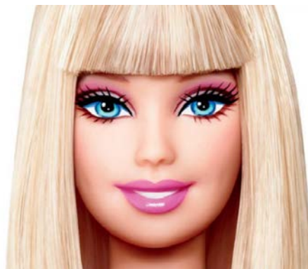
Figura 6. Barbie.

Barbie cambió el estereotipo de muñeca que se enfocaba en la educación maternal de las niñas, hacia una fantasía de la vida adulta donde la niña podía proyectar sus metas y anhelos. Acompañada de un guardarropa increíble y creciente, la muñeca permitió a las niñas hacer algo que en ese momento solo era posible con figuras de papel 2d: vestirla, darle atuendos diferentes y peinarla (Brian Volk-Weiss, 2018).