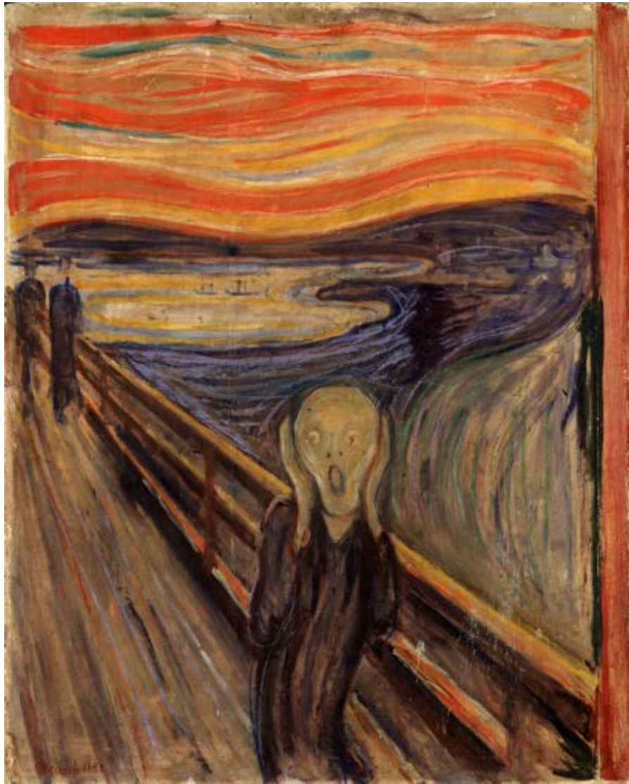
Figura 12. El grito por Edward Munch (1893).