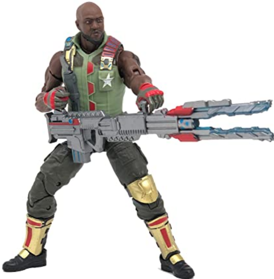
Figura 8. G I Joe.

Durante la Segunda Guerra Mundial se publicaría en la revista Stars and Stripes el cómic dirigido a los combatientes titulado G.I. Joe, un cómic encargado por el gobierno de los Estados Unidos y dibujado por David Breger. 20 años después Hasbro retomaría la idea para crear un Action Figure que fuera de igual éxito a Barbie entre el público infantil masculino (Brian Volk-Weiss, 2018).