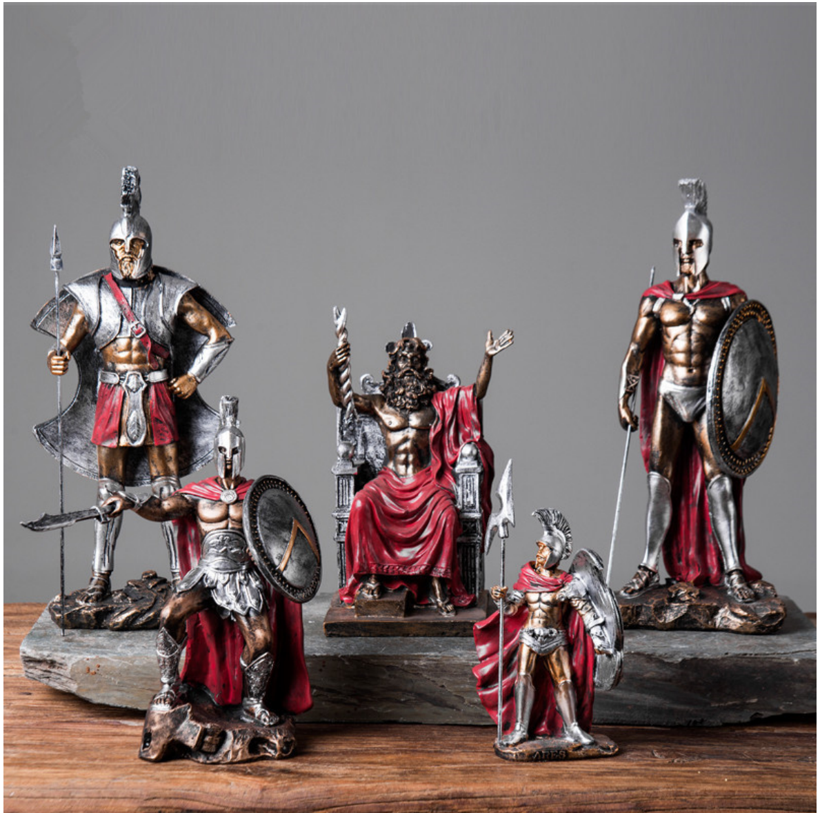
Figura 2. Soldados medievales.

Durante la época renacentista surgen talleres artesanos en países como Alemania, Francia y los Países Bajos. El espíritu renacentista va desplazando la ciega credulidad de la Edad Media, y juguetes como artilugios ópticos -precursores de otros más avanzados- empiezan