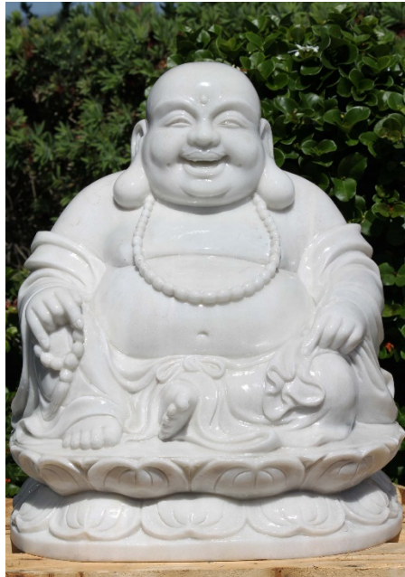
Figura 14. Budha.