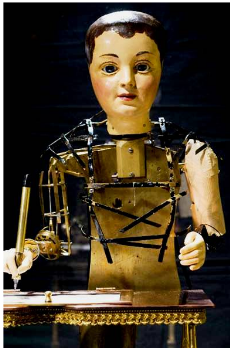
Figura 3. Automáta.