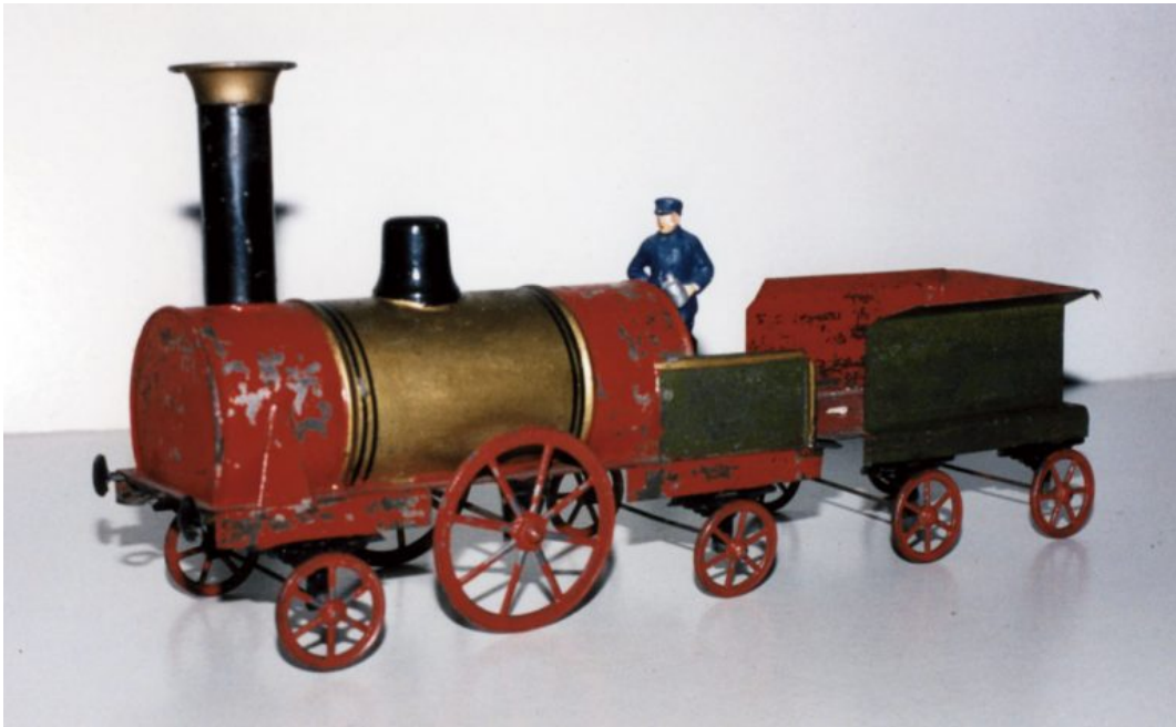
Figura 5. Tren mecánico.

Aunque la revolución industrial tardaría en afectar al mundo del juguete, no lo dejó inerte. La necesidad de crear juguetes autómatas a bajos precios, la utilización de nuevos materiales como el latón, el estaño, el celuloide, el papel maché, entre otros, y las nuevas y mecanizadas técnicas de producción impulsarían a la industria del juguete a llegar a más niños y a crear novedades no vistas antes. A partir del siglo XIX se crearon juguetes con mecanismos de relojería que poseían movimiento, muñecas que podían decir palabras sencillas tales como “mamá”.