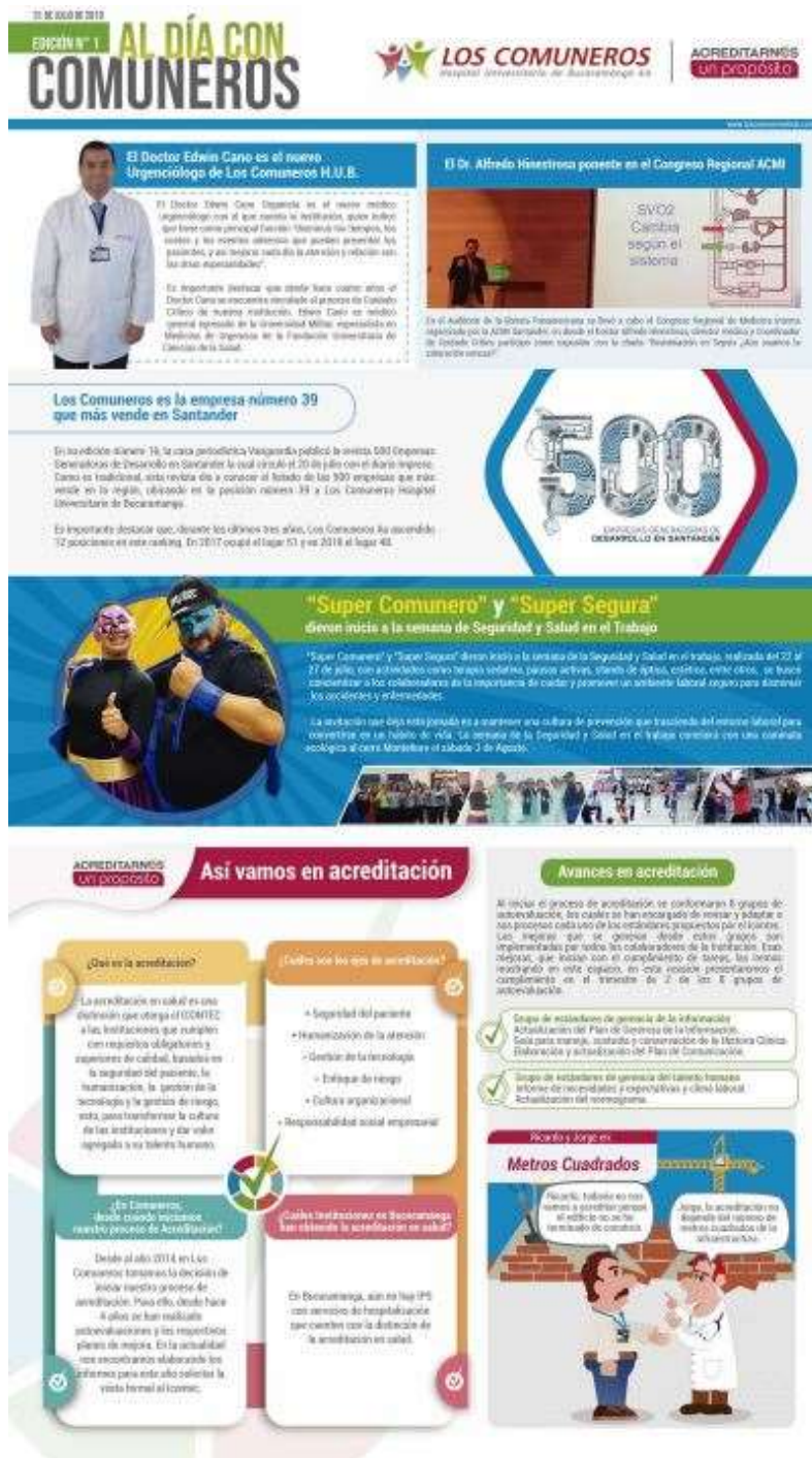
(Edición 1 -Al día con Comuneros- pág.1)