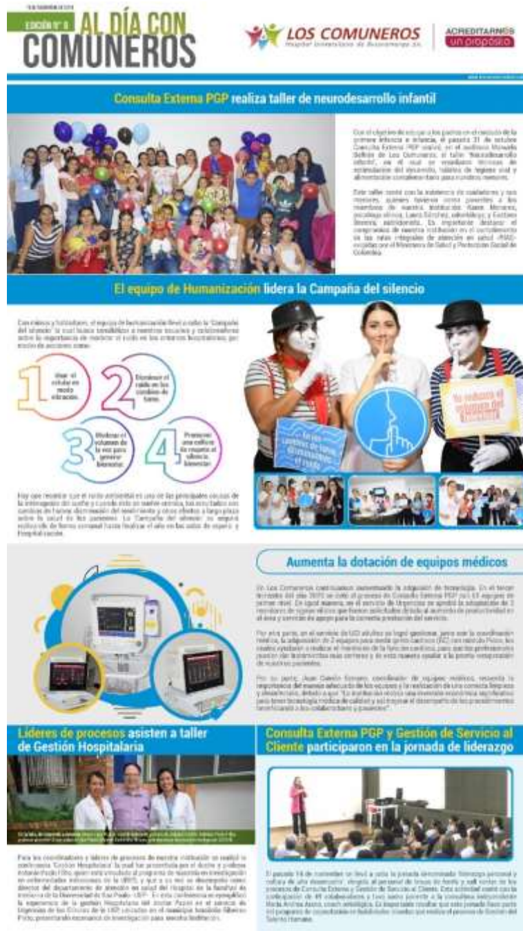
(Edición 8 -Al día con Comuneros- pag.1)