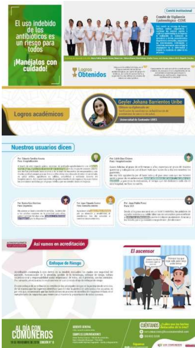
(Edición 8 -Al día con Comuneros- pág.2)