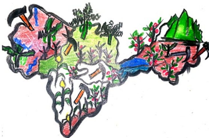
Figura 4: Municipios zona Páramo, Oriente lejano de Antioquia.

Lo anterior permite identificar la multiplicidad de intereses sobre la subregión: una parte liderada por los voceros de la expansión capitalista en coordinación con el Estado, y la otra, por la población civil que demanda el respeto por las construcciones sociales que ha realizado sobre el territorio (que lo han convertido en actor del conflicto). No obstante, esa condición ha estimulado la creación de nuevos significados que reflejan el proceso de cambio que cuestiona la perspectiva civilizatoria de la modernidad (Llanos-Hernández, 2010); y ha dado lugar a múltiples iniciativas en defensa del territorio y en pro de la construcción de paz. La siguiente figura superpone la ubicación de las concesiones mineras en relación con la vocación agrícola del territorio, ejemplificando las tensiones presentes en él.