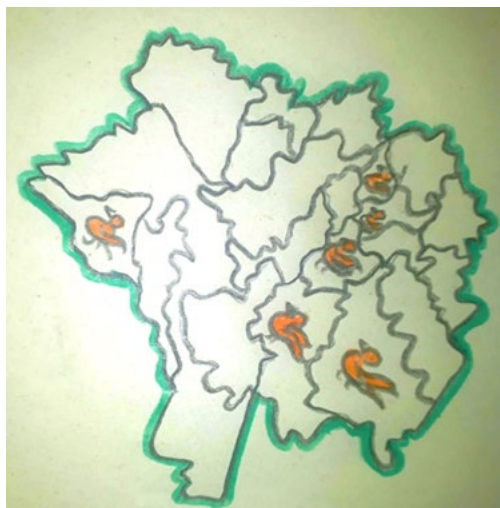
Figura 5. Iniciativas de paz.

Para dar paso al siguiente apartado, se muestra en la figura 5, las iniciativas de construcción de paz más significativas en el Oriente Antioqueño.