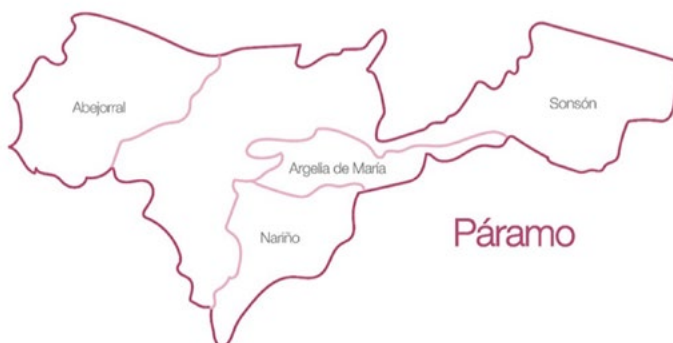
Figura 3. Municipios zona Páramo, Oriente lejano de Antioquia.