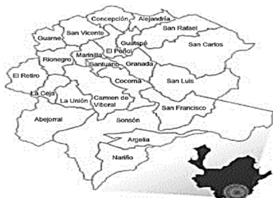
Figura 1. Oriente Antioqueño.

región estratégica por su posición geográfica, conecta el centro de Antioquia con otros departamentos como Tolima, Cundinamarca, Huila y Valle del Cauca, y ha sido un territorio central en la construcción histórica de Antioquia (García, 2004, p.105). Rionegro, Marinilla y Sonsón se consolidaron como sus símbolos urbanos. A lo largo de los años, el Oriente se convirtió en territorio de disputa por parte de diferentes actores, por sus condiciones geoeconómicas y geoestratégicas. Allí han convergido perspectivas sobre el territorio: la imposición de una visión mediada por el Estado y el capital, la que tienen los diferentes actores armados, que buscan dominar el espacio bajo concepciones externas, ajenas a territorio, y la respuesta por parte de las comunidades, en contraposición a la visión hegemónica. Así, estas respuestas de las comunidades, que habitan y viven el territorio, se han dado por y por causa de la lucha de los movimientos cívicos y sociales, desde las significaciones, costumbres y necesidades. Por ello, la región ha sido escenario de pugna entre el espacio concebido y el espacio vivido , lo que resulta en la producción del espacio (Lefebvre, 1974).