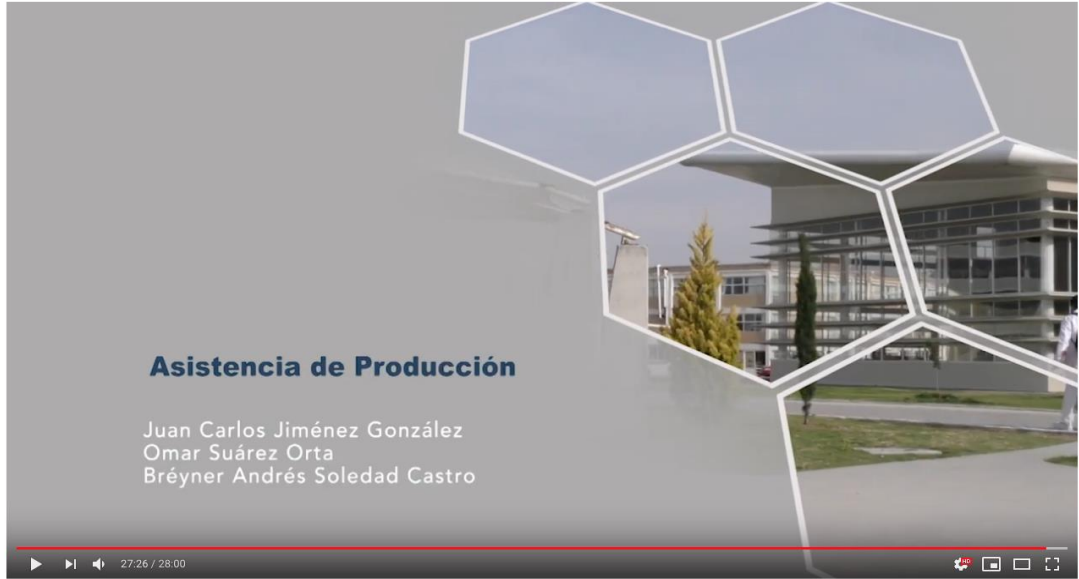
CUI ESPACIO UNIVERSITARIO 375 495 visualizaciones