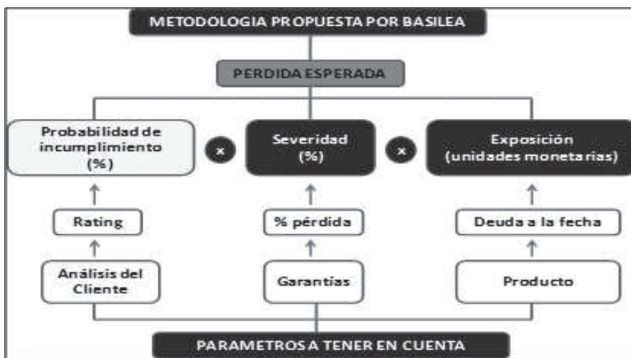
Grafico 2. Cálculo de la Pérdida Esperada