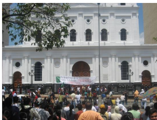
IMÁGENES DE LA TOMA A LA IGLESIA DE LA SAGRADA FAMILIA B/GA FOTO COMPROMISO

La Corporación Compromiso respalda y convoca a una reunión entre autoridades nacionales, departamentales y representantes de la comunidad estudiantil y que se acceda a las demandas de garantías fundamentales para el normal funcionamiento de la universidad.