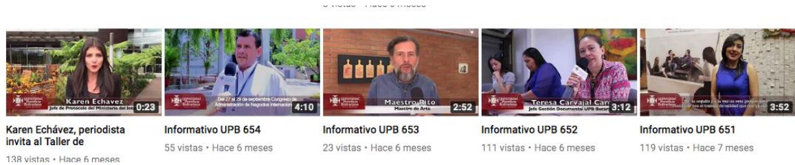
Figura 5. Informativos UPB.

Públicas de la universidad evidenciadas en la producción de 55 informativos, nutridos por las diferentes entrevistas y eventos realizados en el campus de la universidad.