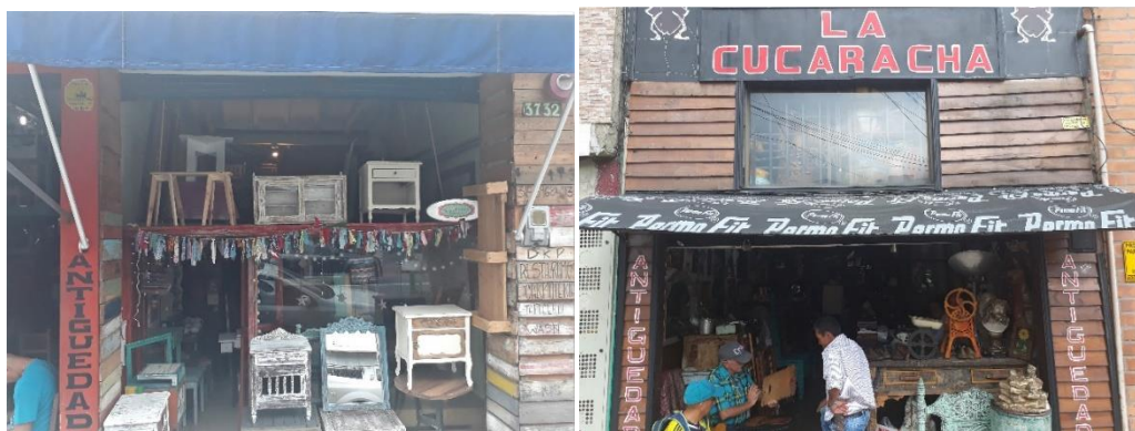
Figura 2. Izq. Fachada de la anticuaria Le Chiffonnier. Der. Fachada de la anticuaria La Cucaracha.