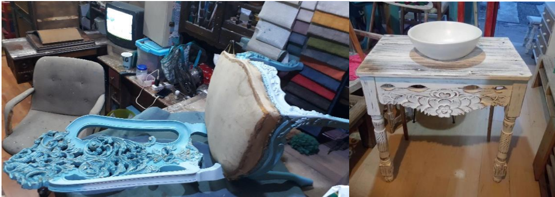
Figura 7. Ejemplos de decapados en función de los ornamentos.

decape como en el descascarado, la intensidad se marca por el grado de presencia de las capas, la cantidad de capas y el contraste entre estas, son características que generaran un mayor ruido en la composición, traduciéndose en una apariencia más rústica.