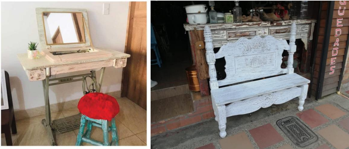
Figura 11. Ejemplos de muebles reformados. A la izquierda una máquina de coser convertida en tocador. A la derecha, Una banca creada a partir del recorte de una cama.

Este método suele aplicarse a muebles u objetos en los que algunos de sus componentes muestran gran deterioro o algún daño irreparable, por lo que el artesano busca reusar los elementos que aun tengan la capacidad de ser usados. También es común que se realice a muebles cuyas funciones originales estén descontinuadas o que no entren dentro del contexto doméstico, por lo que ciertos elementos se adaptan para cumplir otras funciones. O simplemente por decisión del cliente o el artesano para suplir una necesidad o demanda.