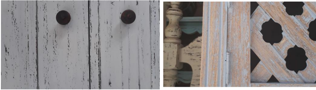
Figura 5. Ejemplos de decapado.

Aunque con estos acabados se puede llegar a una buena imitación del desgaste que se produce naturalmente en un mueble, no es necesariamente el caso, o el objetivo. Teniendo en cuenta que en la mayoría de estos acabados el desgaste se hace de manera uniforme, y con mucha intensidad, cosa que no ocurre en un mueble que se desgasta por condiciones de su uso constante o de su ambiente. En la Figura X vemos ejemplos de decapados relativamente sutiles, donde una capa predomina fuertemente sobre las otras. A la izquierda vemos un decapado donde predomina la capa de pintura blanca sobre una capa de pintura más oscura que se halla una capa más abajo, a la derecha vemos un mueble donde la madera es la capa predominante sobre una capa de pintura muy tenue que se halla sobre esta.