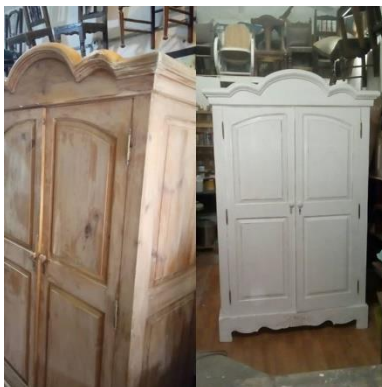
Figura 9. Antes y después de un mueble pintado en blanco plano realizado por Paulina Zapata. Uno de los pocos ejemplos que se vio de una renovación sin acabado de envejecido.

requerirán de herramientas y técnicas de carpintería básica, como cortes, perforaciones, uniones de tornillo y clavo. Destacan el uso del serrucho y la sierra de ingletes para cortes, las prensas, taladro, herramientas de medición, martillos y lijadoras.