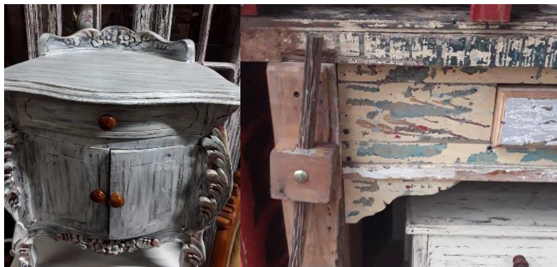
Figura 6. Ejemplos de acabados muy intensos. Decapado (Izquierda), descascarado (derecha).

Aunque con estos acabados se puede llegar a una buena imitación del desgaste que se produce naturalmente en un mueble, no es necesariamente el caso, o el objetivo. Teniendo en cuenta que en la mayoría de estos acabados el desgaste se hace de manera uniforme, y con mucha intensidad, cosa que no ocurre en un mueble que se desgasta por condiciones de su uso constante o de su ambiente. En la Figura X vemos ejemplos de decapados relativamente sutiles, donde una capa predomina fuertemente sobre las otras. A la izquierda vemos un decapado donde predomina la capa de pintura blanca sobre una capa de pintura más oscura que se halla una capa más abajo, a la derecha vemos un mueble donde la madera es la capa predominante sobre una capa de pintura muy tenue que se halla sobre esta.