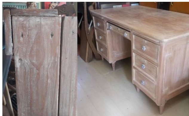
Figura X. Ejemplos de whitewash o lavado. Mueble reciclado de estibas (izquierda).

El principio general de los acabados de envejecido trabajados por los artesanos es a través de distintas técnicas de pintado y desgaste o el deterioro aparente de las capas de pintura. Dependiendo de la técnica se utilizarán, por ejemplo, más capas de pintura, se quema y se raspa posteriormente, como se hace el descascarado. En el caso del lavado o whitewash (figura x), se diluye la pintura en exceso, y luego es aplicada de forma poco uniforme, enfatizando el color en algunos puntos sea de forma arbitraria o hecho de forma cuidadosa, realzando algún elemento del mueble intencionalmente.