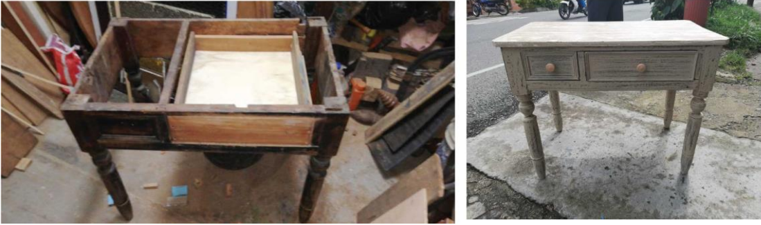
Figura 10. Antes y después de una renovación de una mesa auxiliar por Hamilton Calle.