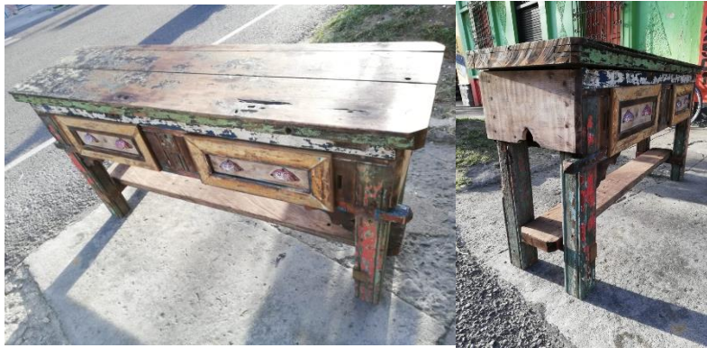
Figura 4. Ejemplo de muebles con acabado descascarado hecho por Hamilton Calle.

El principio general de los acabados de envejecido trabajados por los artesanos es a través de distintas técnicas de pintado y desgaste o el deterioro aparente de las capas de pintura. Dependiendo de la técnica se utilizarán, por ejemplo, más capas de pintura, se quema y se raspa posteriormente, como se hace el descascarado. En el caso del lavado o whitewash (figura x), se diluye la pintura en exceso, y luego es aplicada de forma poco uniforme, enfatizando el color en algunos puntos sea de forma arbitraria o hecho de forma cuidadosa, realzando algún elemento del mueble intencionalmente.