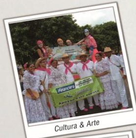
Cultura & Arte

A la fecha, la Fundación, ha beneficiado a más de 330 mil personas, con su trabajo desde las seis líneas de acción: