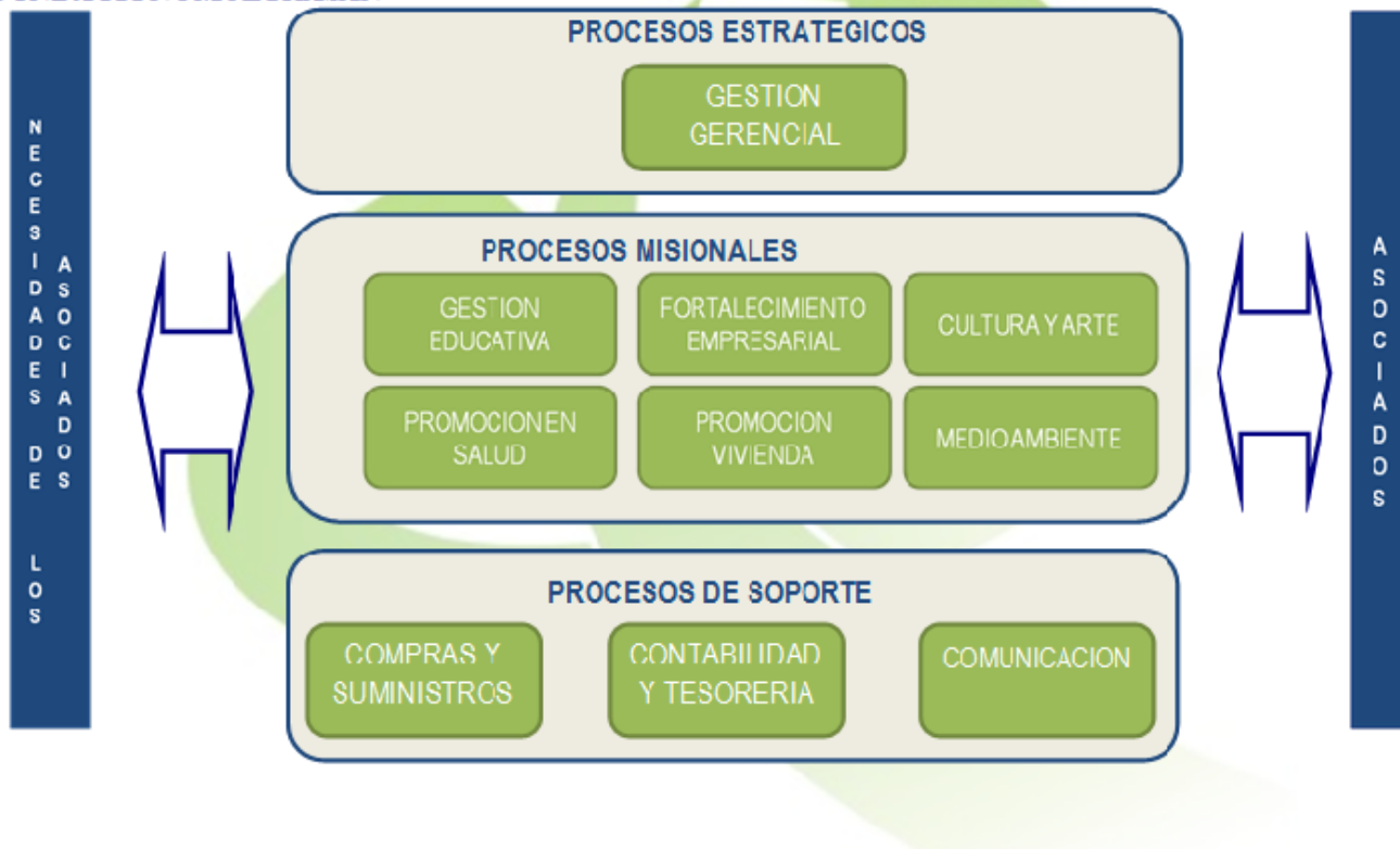
Figura 1. Mapa de procesos de la Organización.