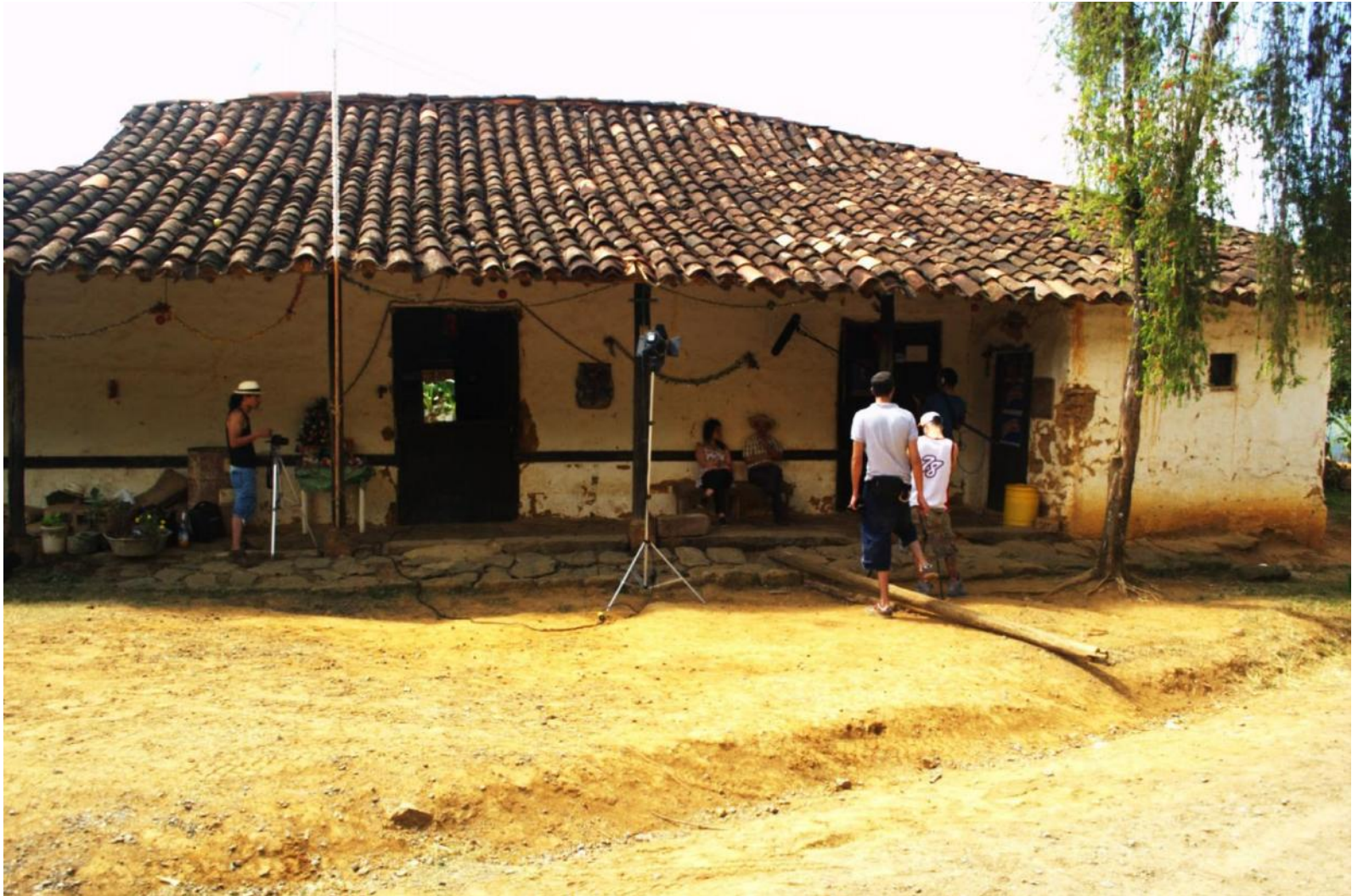
Anexo O: Finca Isidor o