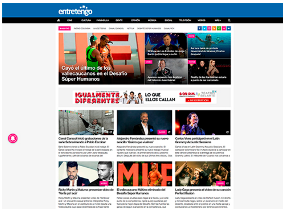
Figura 4. Segmento del home de Entretengo.com

son suficientes o no son claras para saber lo que allí se encuentra. En cambio, Entretengo ofrece al lector un menú más amplio y explícito de posibilidades: con secciones llamadas “cine”, “cultura” o “farándula”, el usuario puede navegar con mayor facilidad. Este caso reafirma una tendencia que menciona Ángela Correa: “Los blogs han tomado la arquitectura de los sitios web para poder utilizar de mejor manera la multimedia, que es una de las características de los blogs”.