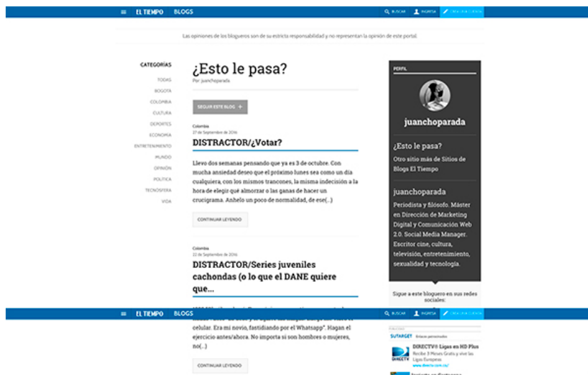
Figura 8. Segmento del home de ¿Esto le pasa?

pauta publicitaria y prensa, y “colabora con nosotros”. En general, es un espacio desaprovechado por todos los blogs y, en consecuencia, se está privando a los lectores de información importante sobre el blog y su autor, que además aporta credibilidad y confianza.