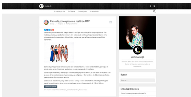
Figura 6. Segmento del home de Diablog.

Blog Vallenato y Entretengo son los blogs que tienen un cabezote más completo, con logotipo propio y menú de navegación, mientras que Viendo TV presenta dos errores muy