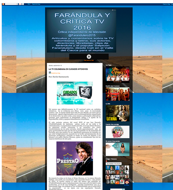
Figura 7. Segmento del home de Viendo TV.

evidentes: el nombre con el que se identifica (Farándula y crítica TV) no es igual al de la URL (Viendo TV), lo que genera confusión, y el tamaño del cabezote es tan grande que ocupa prácticamente toda la pantalla del computador. Visualmente no es agradable como se puede apreciar en la figura 7. No obstante, es el único blog que muestra la descripción del mismo en la cabecera.