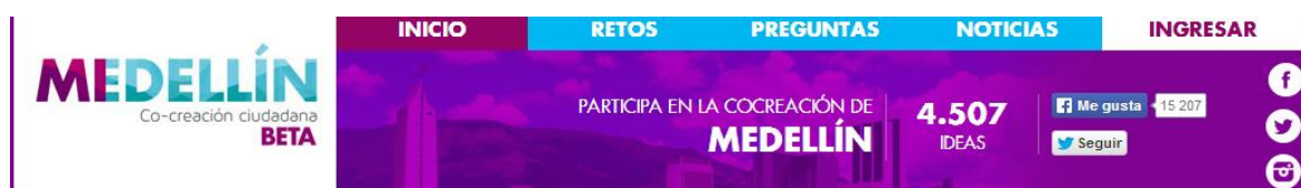
Figura 11. Home de mimedellin.

Además de esto, crea otros espacios de participación y construcción de ciudad como lo es Mimedellin ( mimedellin.org ) que es una página web para participar en la solución de problemas y propuestas de cambios que debería tener Medellín para ser una ciudad mejor para todos los habitantes. Este mecanismo de participación se hace a partir de propuestas que se hacen directamente en dicha página web donde se invita a los ciudadanos a participación de la creación de la ciudad, la cual cuenta con 4.507 propuestas a la fecha por parte de los ciudadanos.