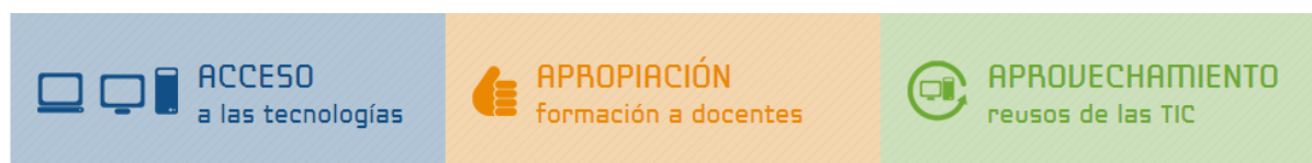
Figura 2 Estructura de ejecución del programa Computadores para Educar (CPE)

Uno de estos programas es Computadores Para Educar (CPE) que se encarga de hacer en la mayoría de instituciones educativas del país un acercamiento a las TIC. A través de él se busca dotar de infraestructura a las escuelas y colegios y alfabetizar mínimamente a los educadores de estas instituciones. Este programa de dotación consta de tres fases que consisten en: