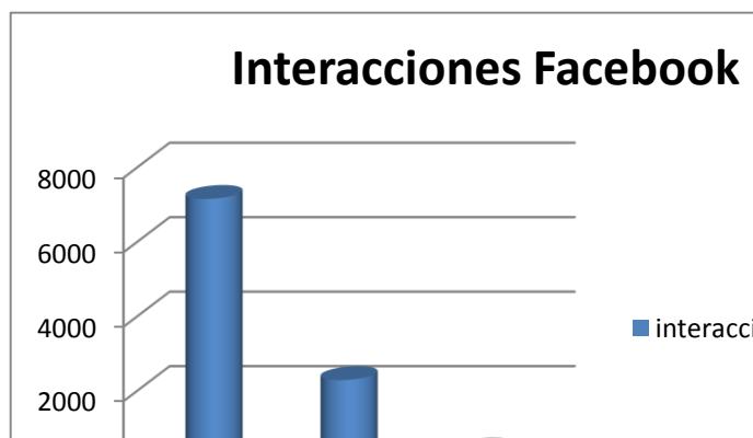
Figura 12. Interacciones en Facebook (creación propia)

Dentro de la metodología de este trabajo de grado se tuvieron en cuenta las publicaciones de 120 post de Facebook y 737 tweets correspondientes a una semana de seguimiento de estas cuentas en redes sociales, a lo que se puede decir que en el caso de Facebook la opción favorita para participar es por este medio es a partir de la opción de dar like a las publicaciones que en la revisión dan un total 7.149, seguido de la opción de compartir con 2.285 y finalmente los ciudadanos hicieron 359 comentarios en esas 120 publicaciones.