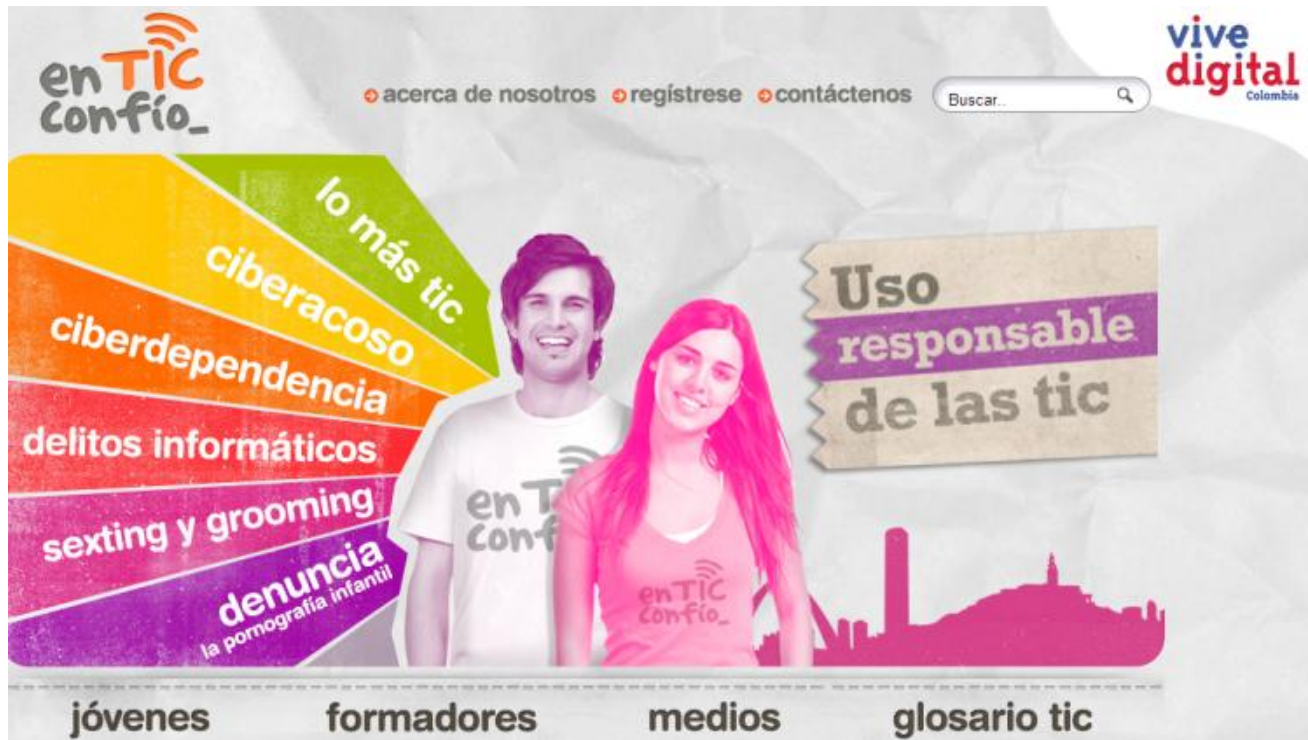
Figura 4. Parrilla de contenidos del programa en TIC confío

aprovechamiento de las prácticas sociales y comunicativas se establecen en la virtualidad y repercuten en la vida cotidiana de todos los colombianos.