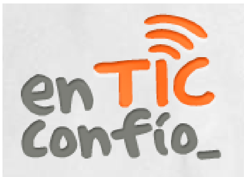
Figura 3 Logo del programa en TIC confío

Disponible en http://www.enticconfio.gov.co/enticconfio.html