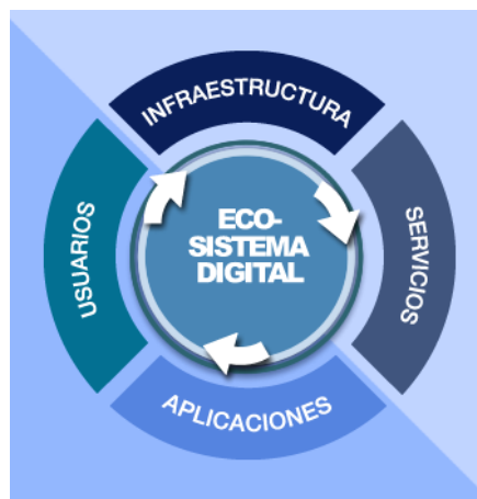
Figura 1. Ecosistema Digital del Plan Vive Digital

Una vez contemplado de esta manera; Vive Digital y MinTIC dan paso a otros proyectos que se encarguen de esa masificación tecnológica y acceso a Internet tanto en las zonas metropolitanas y urbanas como en las zonas rurales.