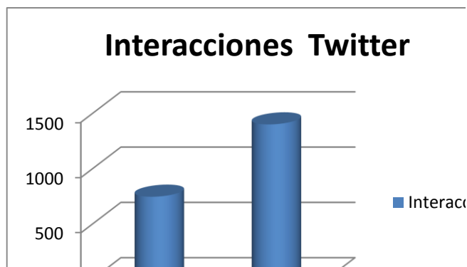
Figura 13. Interacciones en Twitter (creación propia)

se pueden ver por los usuarios, la opción preferida para participar e interactuar en línea es por medio de las marcas como favorito.