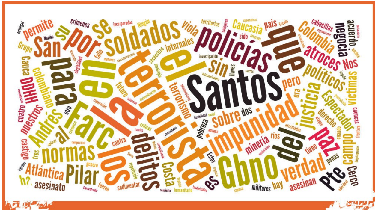
Ilustración 8 Nube de tags correspondiente al acuerdo agrario.

En la nube de tags correspondiente a los tuits personales referentes al acuerdo político la atención se centra en las palabras FARC con 336 repeticiones, terroristas con 277 y terrorismo 119; Gobierno tiene 212, Santos tiene 149, Secuestro, 136. Aunque se trata del acuerdo en participación política político, tiene 150 repeticiones, que hace que sea la decimoquinta palabra más repetida, y política solo tiene 82 repeticiones.