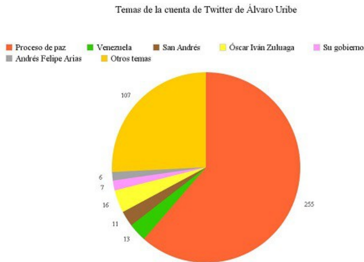
Ilustración 5 Temas a los que se refiere Álvaro Uribe en su cuenta de Twitter en los tres periodos analizados

Se capturaron los tuits correspondientes a siete días por cada periodo, es decir 21 días. En total fueron 415 tuits de los cuales 255 hacen referencia al proceso de paz entre el Gobierno de Juan Manuel Santos y la guerrilla de las FARC. Esto quiere decir que el 61,44 por ciento de los tuits del expresidente Uribe son alusiones a las negociaciones en La Habana (ver Imagen 5).