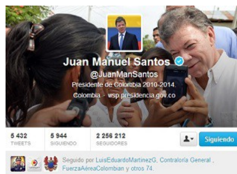
Ilustración 2 Pantallazos de las cuentas de Twitter del expresidente Álvaro Uribe y del presidente Juan Manuel Santos al 3 de noviembre de 2013.

La importancia que Uribe le da a esta red de microblogging quedó en evidencia en mayo de 2012 cuando se conoció un video en el que suspendió una entrevista con el canal SOI TV de