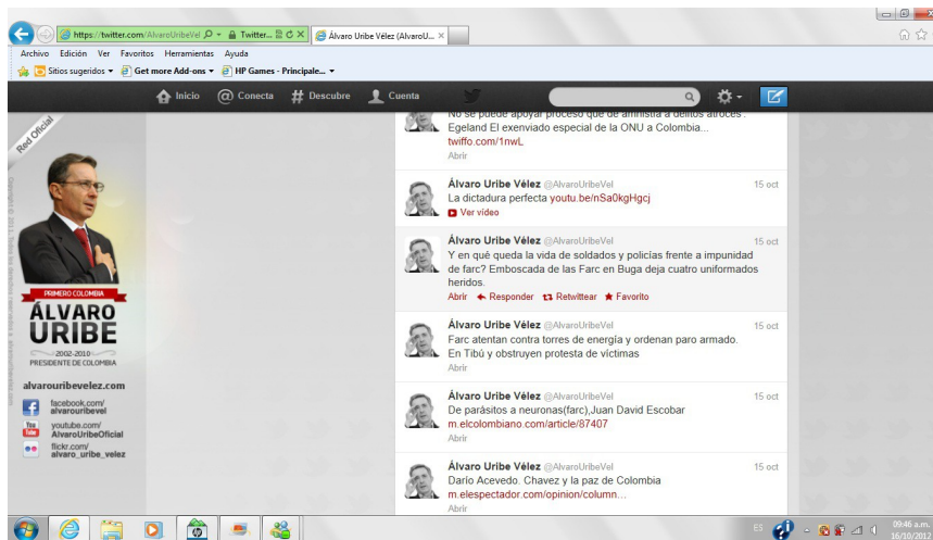
Ilustración 4 Captura de pantalla de tuits el 16 de octubre de 2012

cuenta de Twitter del expresidente Uribe para realizar las capturas de los tuits.