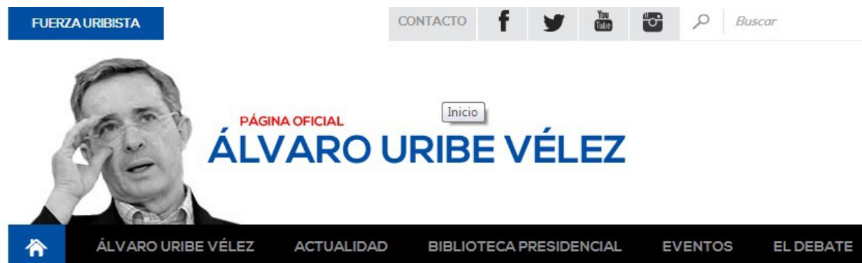
Ilustración 11 Cabeza de la página Primero Colombia.

Uribe también remite a Primero Colombia, que es su página oficial desde que se presentó a la campaña presidencial en 2002. En ella se encuentran artículos, entrevistas, noticias e información relacionada con el exmandatario. De esta página proceden cuatro tuits de Uribe en los tres periodos analizados.