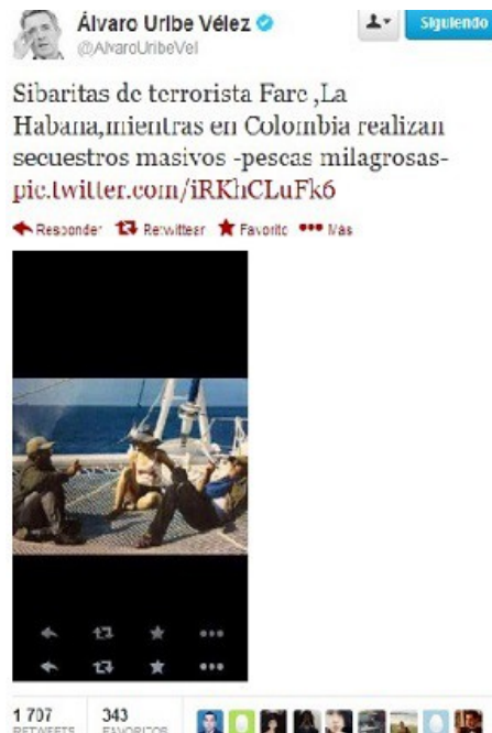
Ilustración 12 Pantallazo de la cuenta de Twitter de Álvaro Uribe tomado el 11 de noviembre de 2014.

noviembre de 2013 había recibido 1.707 retuits. Este tuit, aunque es el más viral de Uribe, no se incluyó en el análisis por no hacer parte de las fechas seleccionadas para el mismo.