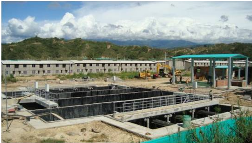
Construcciones del Proyecto Ciudadela Nuevo Girón 17

Periódicamente, una comisión de la Dirección de Regalías (DR) realiza visitas a este proyecto aprobado en la vigencia 2006 y adicionalmente a otros tres proyectos complementarios aprobados en la vigencia 2008 18 por el FNR