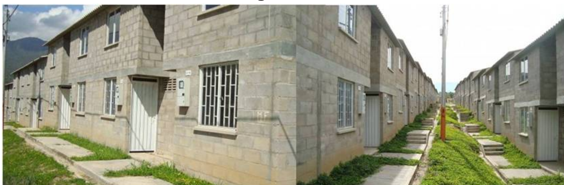
Casas Terminadas del Proyecto Ciudadela Nuevo Girón 19