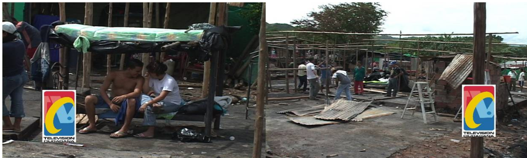
Damnificados en Girón por ola invernal del año 2005 15

Para este proyecto se acudió al Fondo Nacional de Regalías (FNR) el cual aportó en un principio 15.578 millones de pesos a manera de cofinanciamiento para la construcción de 1931 viviendas de interés social logrando beneficiar a 1500 familias víctimas del desastre 16 . El proyecto fue elegible ante FINDETER REGIONAL, FINDETER NACIONAL y viabilizado por el Ministerio de Vivienda y la Dirección de Agua Potable, del Ministerio de Vivienda. Los recursos, fueron aprobados por el FONDO DE REGALIAS, que ha aportado más de veintidós mil millones de pesos, igual que el FONDO