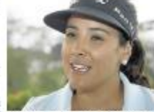
La golfista colombiana María José Uribe Duetin, la mejor de la temporada 2013 en el circuito profesional de golf femenino.

Al finalizar la temporada 2013, la santandereana María José Uribe Duetin terminó siendo la mejor golfista colombiana de la LPGA en el circuito profesional de golf femenino.