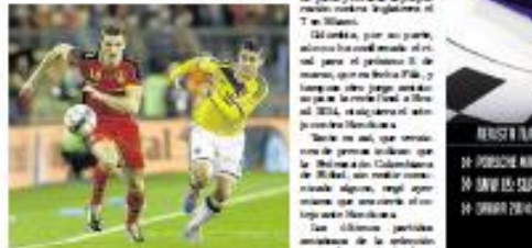
La selección de Colombia, que jugará el día 10 de junio contra Honduras en el partido de ida del primer juego de la Copa del Mundo 2014, y que jugará el día 14 de junio contra Honduras en el partido de vuelta del primer juego de la Copa del Mundo 2014.

El partido de ida será el 10 de junio y el partido de vuelta será el 14 de junio. Colombia jugará contra Honduras antes de llegar a la Copa del Mundo. El partido de ida será el 10 de junio y el partido de vuelta será el 14 de junio. Colombia jugará contra Honduras antes de llegar a la Copa del Mundo.