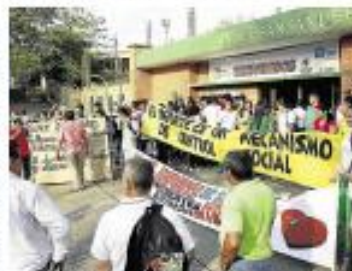
Deportistas, entrenadores y periodistas se reunieron para protestar por las malas condiciones laborales y la baja inversión en las instalaciones deportivas.

En las instalaciones del Intermunicipal, atletas y entrenadores santandereanos decidieron protestar en contra de las malas condiciones laborales y la baja inversión en las instalaciones deportivas. Los atletas y entrenadores expresaron su descontento por la falta de recursos y el abandono del deporte en Santander. Ellos creen que el deporte en Santander está en una situación crítica y que se necesita una intervención urgente para salvarlo.