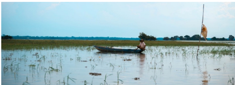
Figura 4. Pescador en ciénaga de San Benito Abad