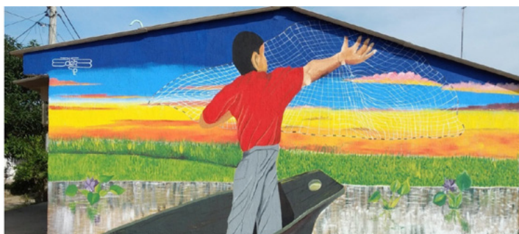
Figura 1. Foto mural en una casa de la urbanización Villas de Mompox

Nota: fotografía propia, mural en Villas de Mompox, 2020.