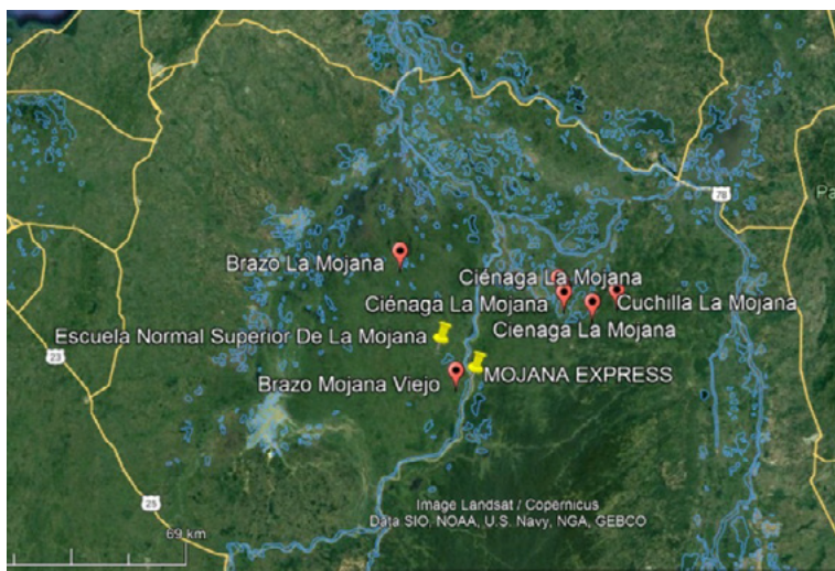
Figura 2. Imagen del delta de La Mojana

Ahora bien, la configuración hídrica de la Depresión Momposina es surcada por vías carreteables que posibilitan el tránsito desde y hacia ella complementando la movilidad acuática en la zona. Sobre el margen derecho de sur a norte, la troncal de la costa pasa por el Bajo Cauca antioqueño y el sur de Córdoba siguiendo hasta el norte de la subregión de La Mojana, en el curso se encuentran tramos transversales; en la zona de La Mojana desde el sector del Viajano hasta el municipio de Guaranda, el Invías construyó la carretera pavimentada que corta en dos La Mojana, sobre la misma hay debates frente a la interrupción de la conectividad ecosistémica.