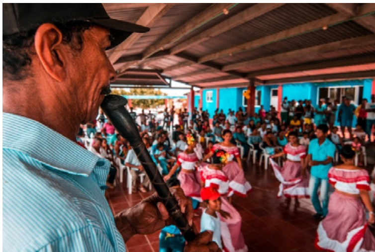
Figura 5. Presentación y baile con tambora, expresión cultural de la región.

Nota: foto propia, 2019. Presentación comunitaria con cumbia y tambora en San José de Doña Ana, San Benito Abad, Sucre.