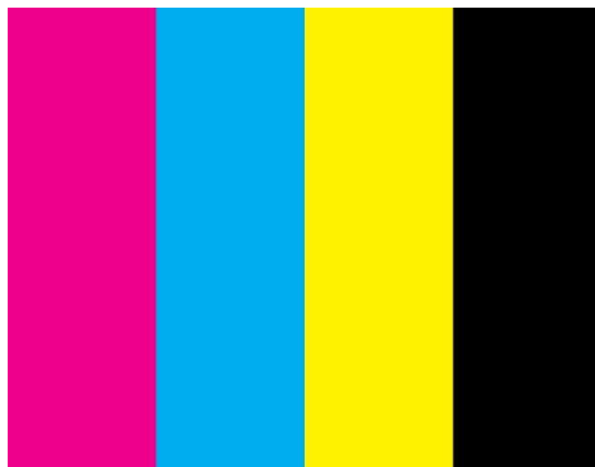
Figura 1 Colores de Sofía al filo

Para su creación se tuvieron en cuenta todos los asuntos visuales, como la colorimetría, creando una paleta que pudiera ser atractiva para los estudiantes, sacando la filosofía del prejuicio del aburrimiento. Se abastece el contenido de colores neones diferentes a lo que habitualmente se ve. Se presenta entonces una filosofía joven, a la moda y divertida. Las imágenes destinadas a los post cortos y para los memes mantendrían el mismo estilo, adornando a los autores con un enfoque “pop art”, que incluyen: gafas, burbujas de chicle, viñetas y morisquetas que propician una mirada distinta a la estructura común.