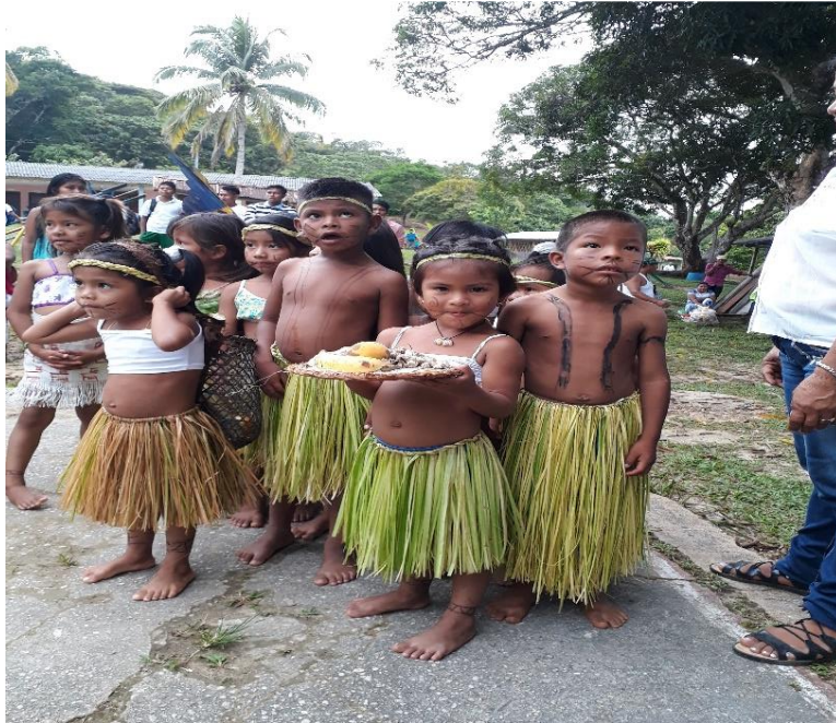
Gráfico 2 Presentación de bailes y comidas típicas

culinarias afecta directamente al mantenimiento y fortalecimiento de los saberes culturales, ya que con la práctica de estos se mantiene viva la cultura en las familias.