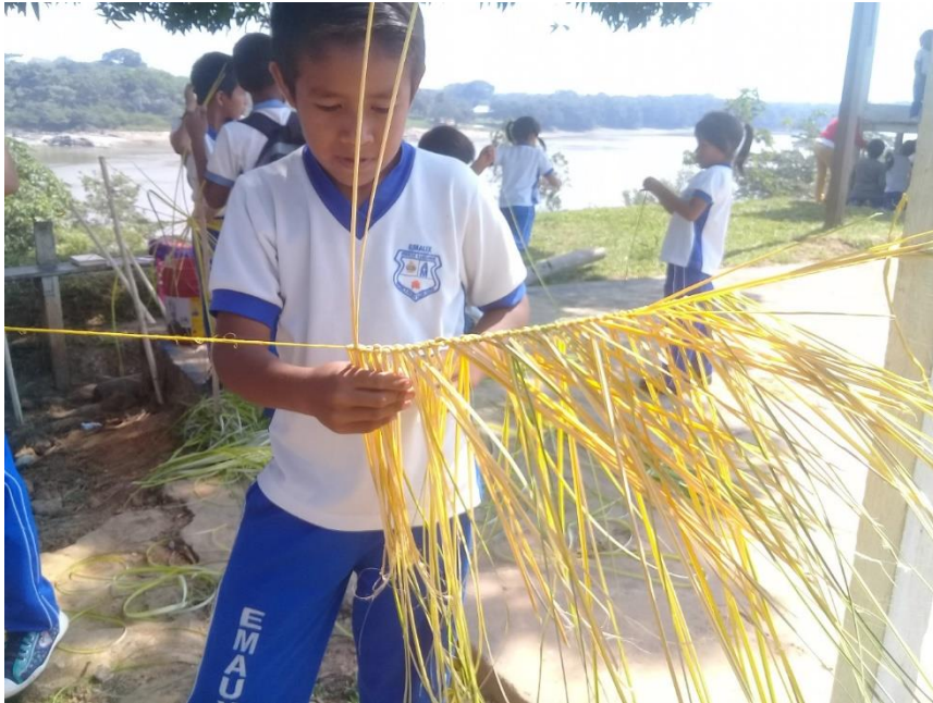
Gráfico 4 Proceso de tejido de escobas

Pasamos por todos los grupos realizando el ejercicio una y otra vez hasta que cogieron el ritmo de tejido, luego cada grupo avanzo hasta el final.