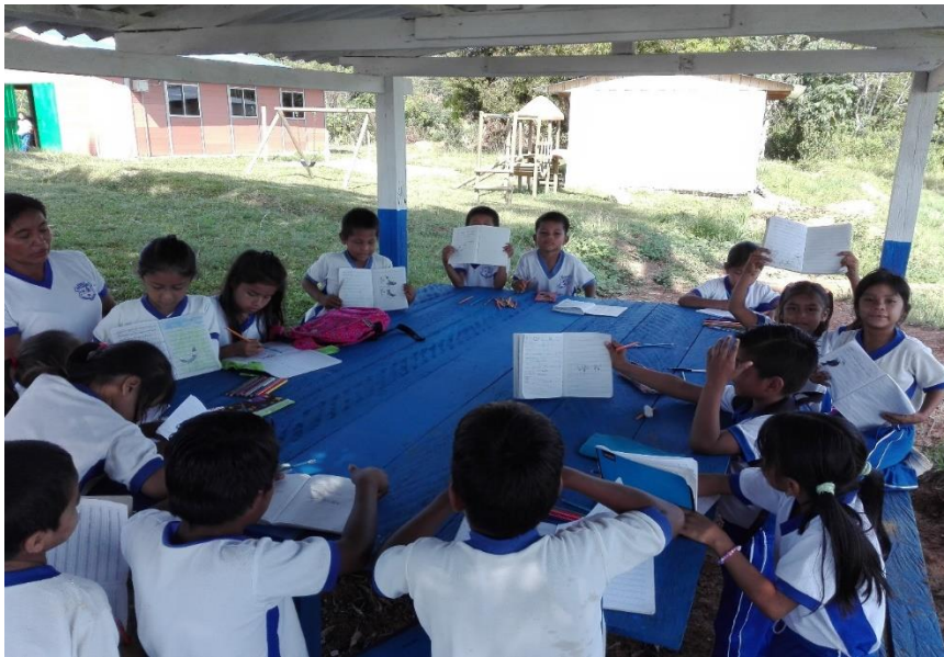
Gráfico 10 Transcripción de cantos

Posteriormente, realizamos la lectura del canto, y finalmente le incluimos la música. Fue así como empezamos a cantar. Repasamos las canciones una y otra vez hasta que los niños se las aprendieron. Después de haber aprendido sin ayuda de los profesores, las cantaban en el salón.