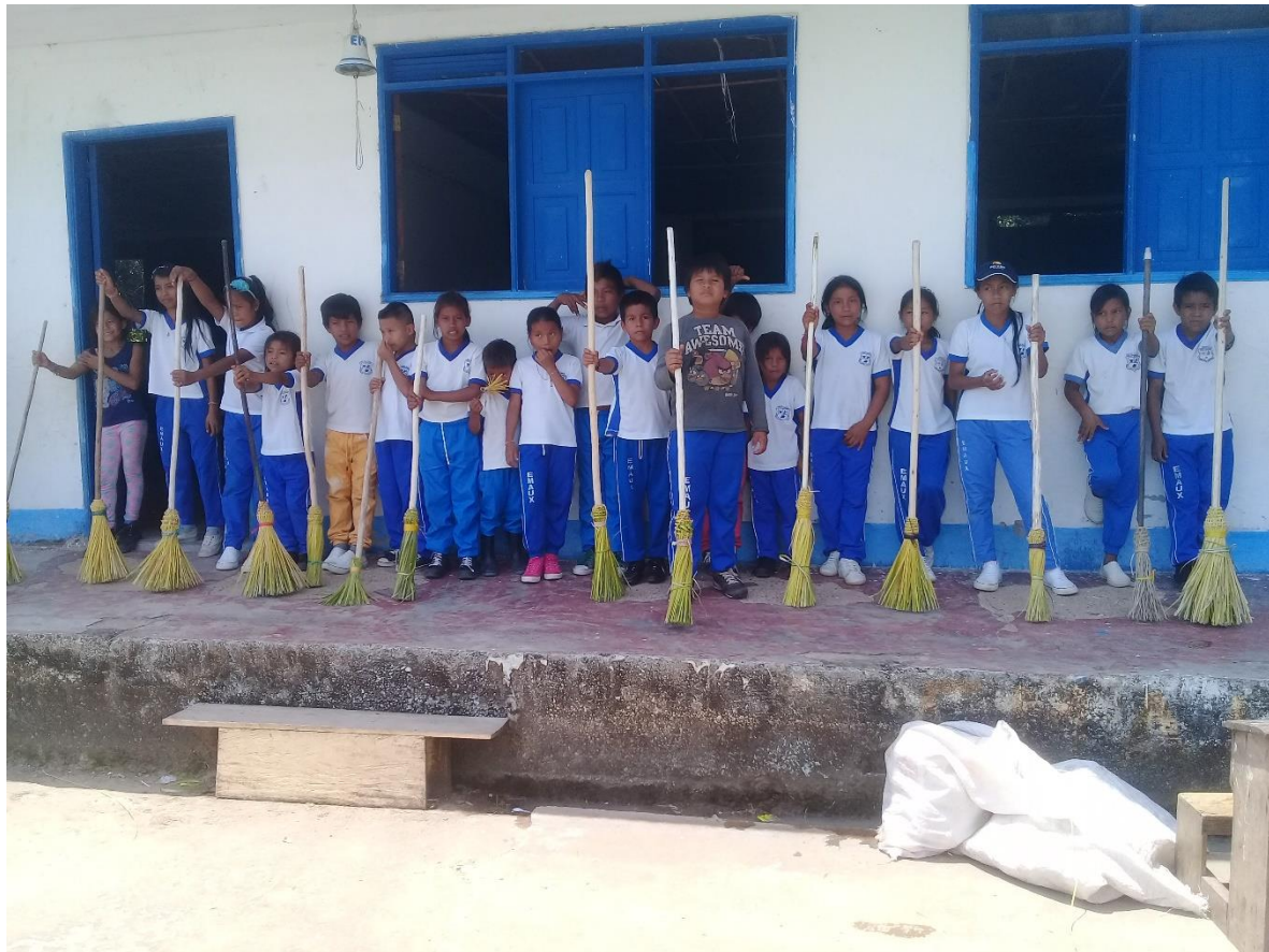
Gráfico 5 Fabricación de escobas en la Escuela María Auxiliadora

En el momento la escuela no cuenta con el servicio de restaurante, pero los profesores les organizamos un refrigerio con el fin de complacer a los estudiantes en general.