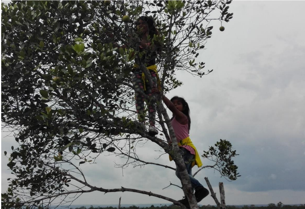
Gráfico 8 Recolección de frutos silvestres

despacio por unos arbolitos, bajaron los huansoquillos con la ayuda de la profesora, arrancaban las frutas y se las tiraban a ella.