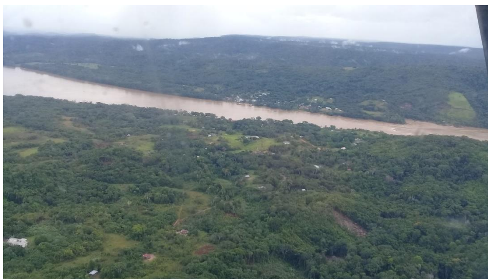
Gráfico 1 Vista del corregimiento Puerto Santander

Puerto Santander es uno de los corregimientos más retirados de nuestra capital Leticia. La comunicación con otros corregimientos se da por trochas o caminos; con el corregimiento de la Chorrera, por vía fluvial, río abajo; con el corregimiento de la Pedrera y Mirita, río arriba; con las comunidades aledañas y con el municipio de la Tagua Putumayo, también por el río (Alcalde municipal de Leticia, Amazonas, 2016).