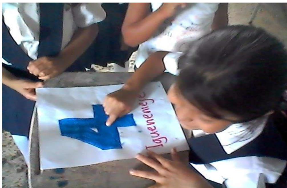
Gráfico 9 Alfabetización del grado segundo

Nos sentimos comprometidos en llevar adelante la alfabetización social de los saberes culturales de las etnias Uitoto, Andoke y Muinane, ya que este nos permite fortalecer nuestra identidad y diferenciarnos ante las demás culturas. Como también nos llevará a vivenciar nuestro entorno de manera equilibrada, como lo hacían nuestros abuelos. Pretendemos seguir sus huellas.