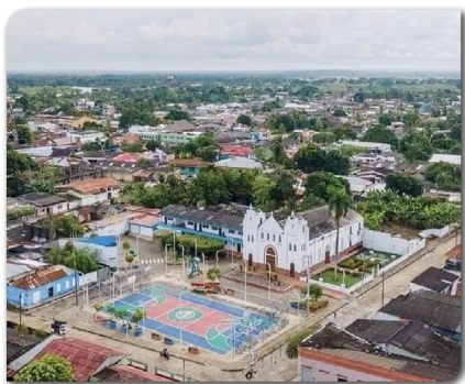
Municipio de San Bernardo del Viento, Córdoba

Este municipio está ubicado en la costa norte de Colombia, en la desembocadura del Río Sinú, en el mar Caribe. El Viento, como popularmente se le llama en el departamento de Córdoba, es un lugar turístico por sus atractivas playas donde se disfruta de una arena suave de color amarillo. A pesar de las altas temperaturas y el fuerte sol que caracteriza este lugar, sus