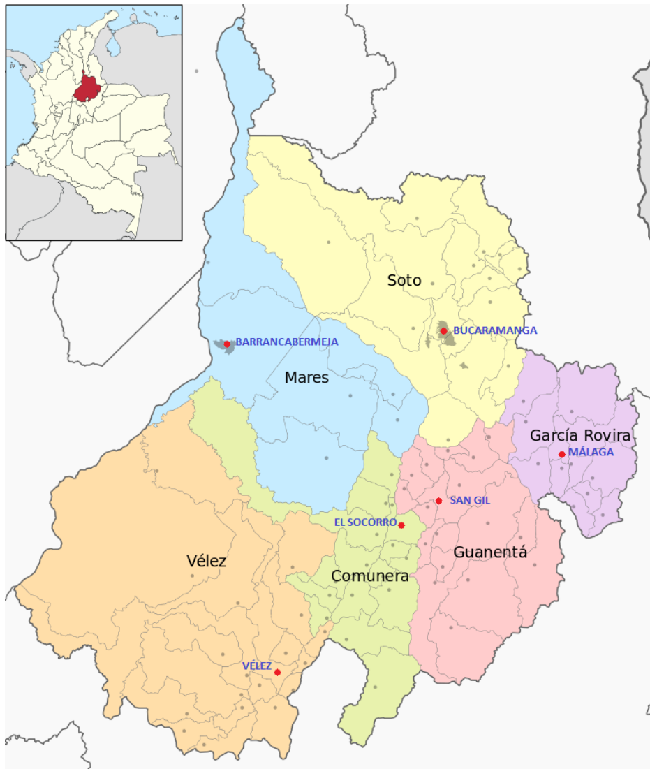
Figura 1: Provincias de Santander y su capital. Wikipedia.com, Organización territorial de Santander.