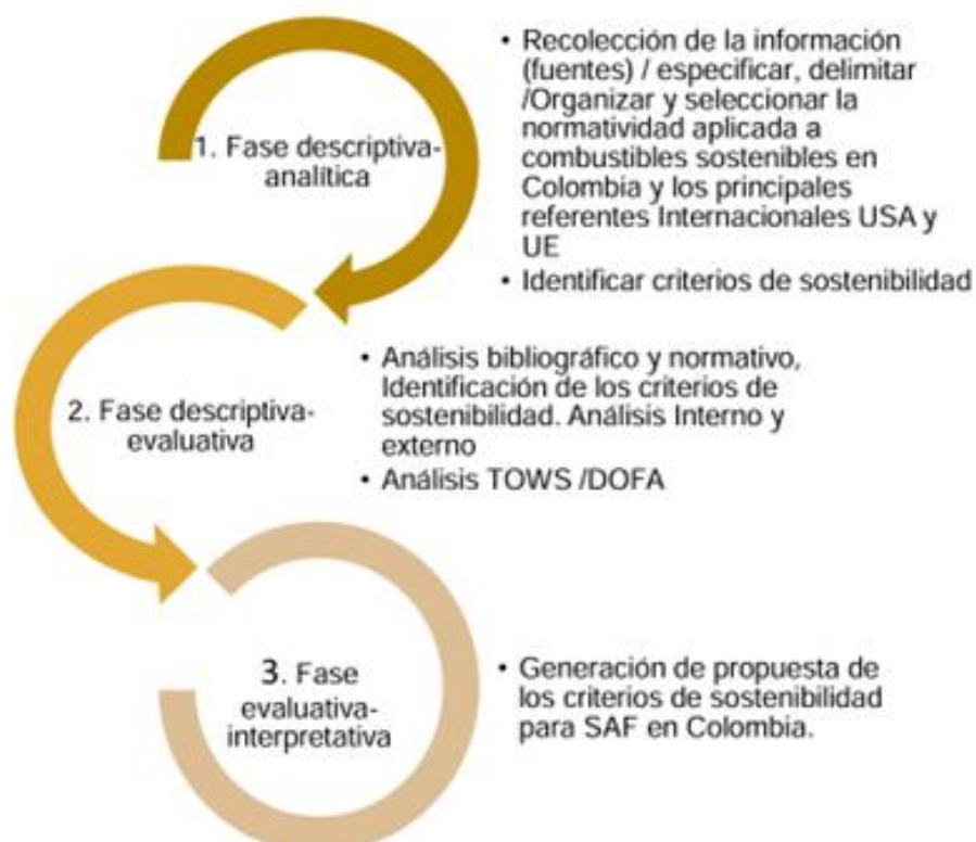
Figura 3 Metodología

Nota. Por la cual se presenta la metodología en una figura para mejor visualización.