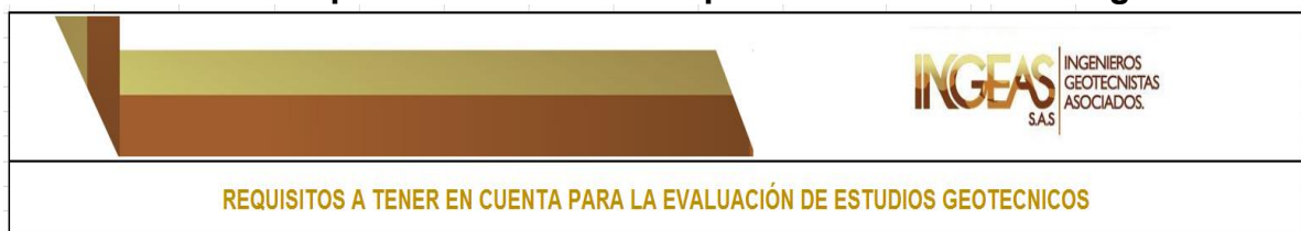
Tabla 1. Guía de requerimientos mínimos para evaluar un estudio geotécnico.

La casilla “cumple o no” se diligencia con una X y la casilla observaciones sirve para especificarle a los ingenieros que parte del criterio a evaluar no se está cumpliendo.