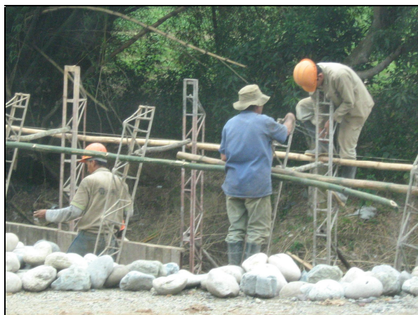
Fotografía N° 4. Seguridad Industrial

Seguridad Industrial: Personal de la obra, laborado sin utilizar los elementos de seguridad industrial necesarios para ejecutar los procedimientos de construcción.