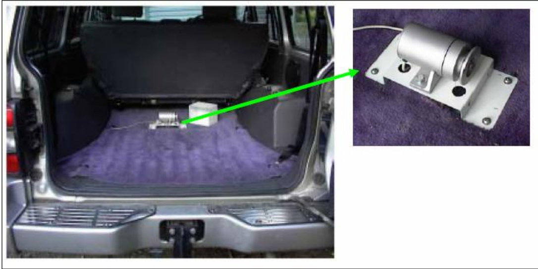
Fotografía N° 5. Equipo Tipo Respuesta (Bump Integrator, BI)