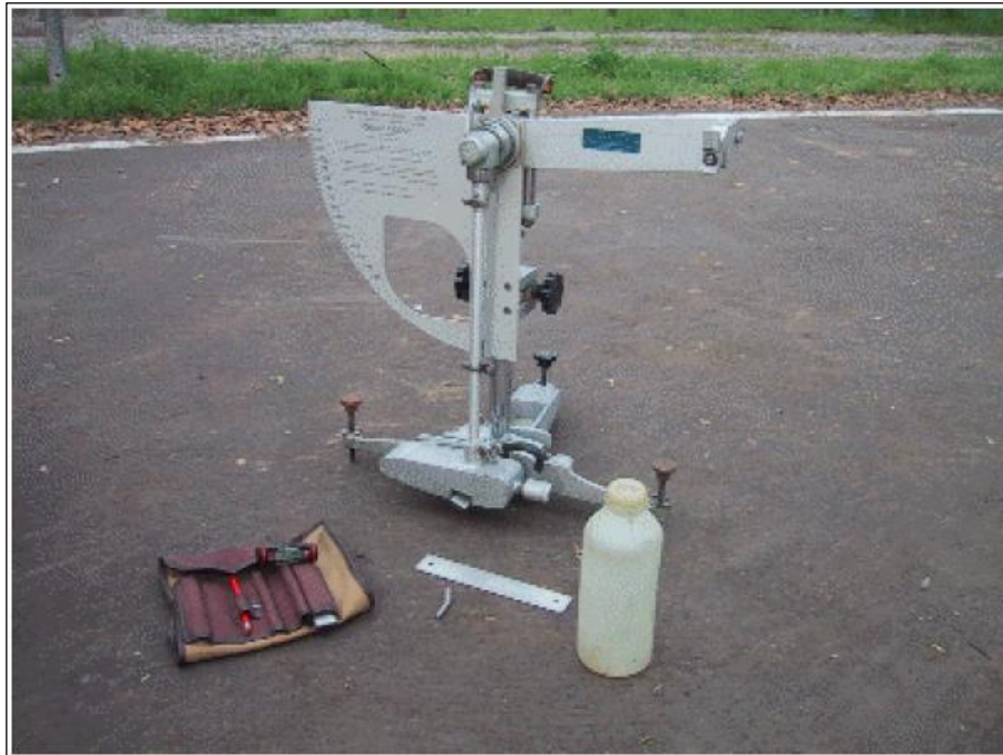
Fotografía N° 6. Péndulo TRRL