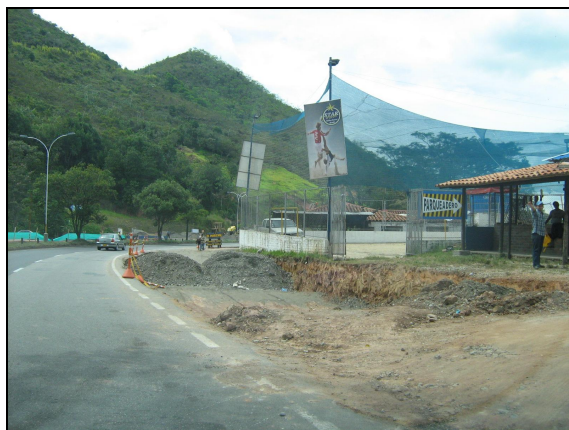
Fotografía N° 3. Señalización insuficiente

Señalización: Se ha avanzado en la ampliación de la vía pero se presenta una escasa señalización que no se ajusta a los requerimientos del Manual de Señalización del INVIAS, para este tipo de obras.