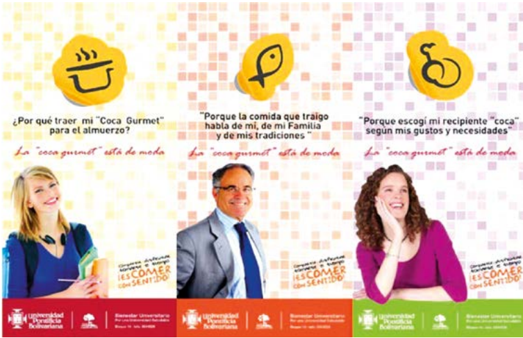
Figura 8.2. Imágenes de la campaña Coca gourmet . Jóvenes estudiantes