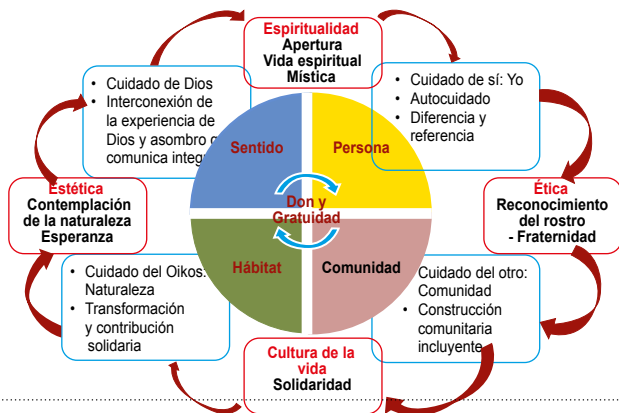
Figura 6.1. Ética del cuidado

Formación Integral para la transformación social y humana