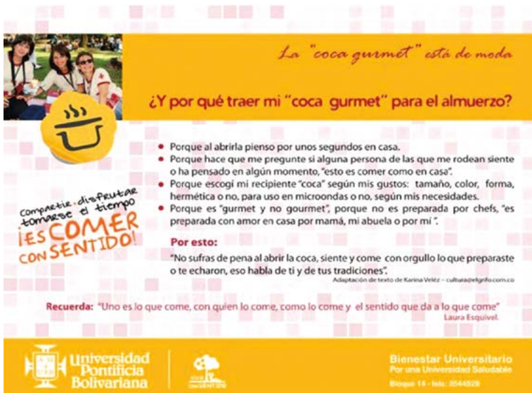
Figura 8.3. Imágenes del anuncio conclusivo de la campaña Coca gourmet . Jóvenes estudiantes