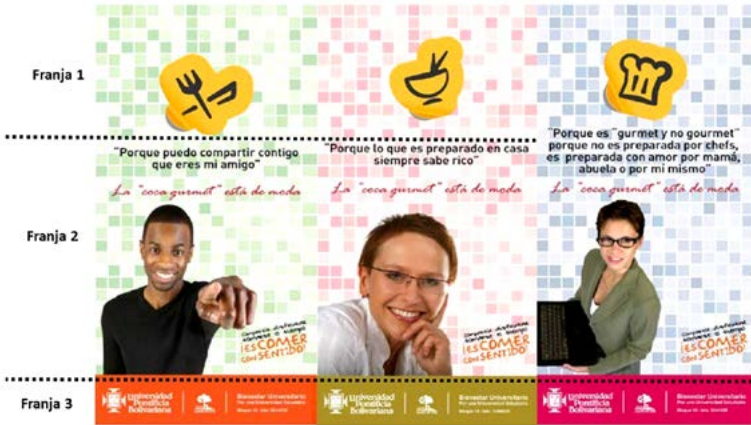
Figura 8.1. Imágenes de la campaña Coca gourmet . Jóvenes estudiantes