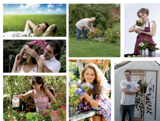
Painel semântico do perfil do consumidor Fonte: Elaborado pela autora.

O público consumidor é formado por homens e mulheres habitantes da Colômbia, que moram na cidade de Medellín e gostam de flores, especialmente de orquídeas. Pessoas que tem 20 anos até idades avançadas ou idosos, de gênero feminino e masculino, com um alto poder aquisitivo.