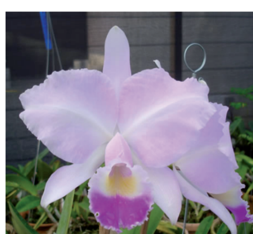
Orquídea Cattleya Trianae

O produto a ser exposto e vendido no ponto de venda móvel são as flores da família Orchidaceae, comumente conhecidas como orquídeas.