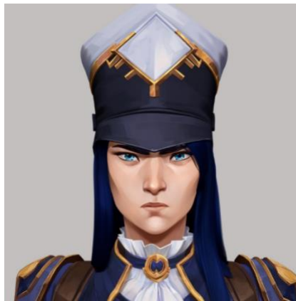
Figura 15 Caitlyn Sombrero Kepis

Nota. Fuente https://www.tumblr.com/art-of-arcane/692788730627522560/arcane-caitlyn-costume-concept-art-twitter