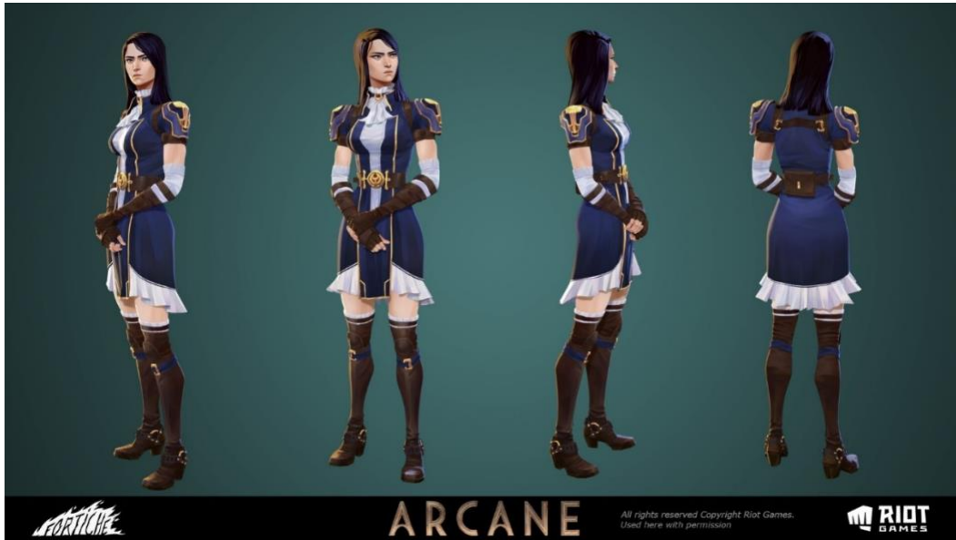
Figura 14 Caitlyn Vestuario Default

Nota. Fuente https://www.artstation.com/artwork/aGy4zz