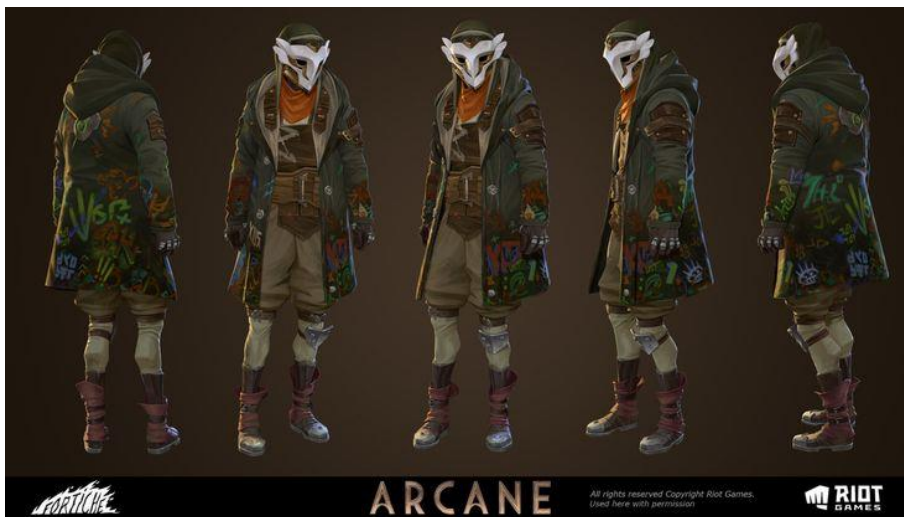
Ekko Vestuario Default

Nota. Fuente https://co.pinterest.com/pin/853924779395233825/