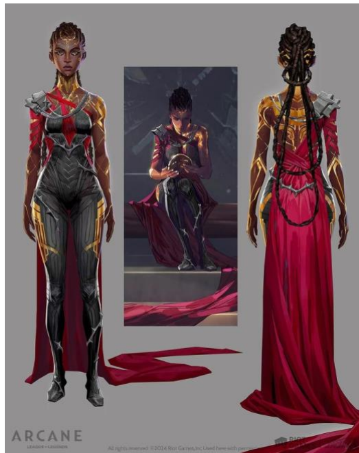
Figura 29 Mel Vestuario Despertar Arcano Capa

Nota. Fuente https://www.artstation.com/artwork/XJxKIR