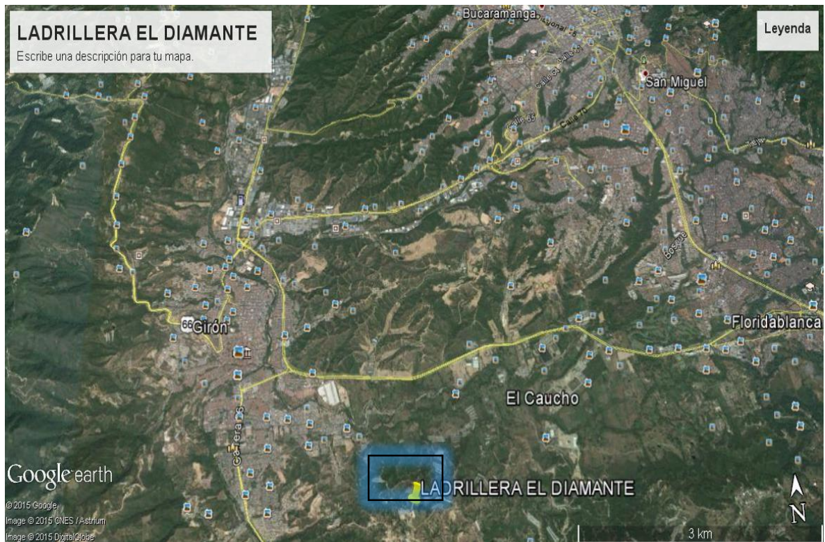
Figura 3. Localización del proyecto

Para tener una idea del avance y el grado de ejecución del Proyecto, respecto a lo programado, Diariamente se hacen recorridos a los lugares donde se realizan los trabajos.