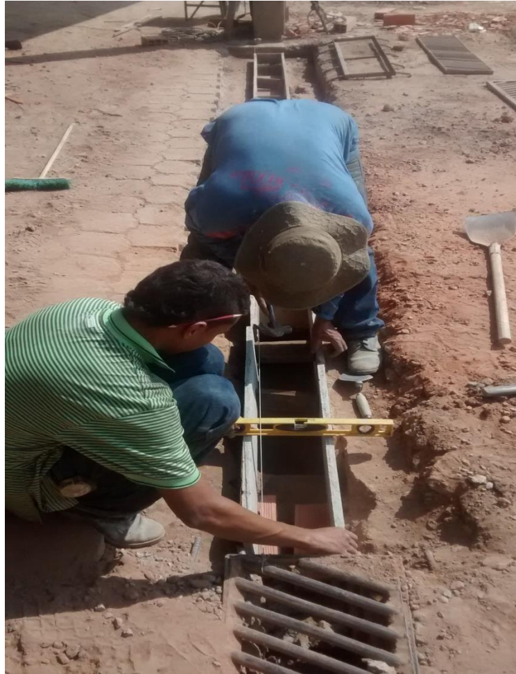
Fotografía 6. Sumidero Horno