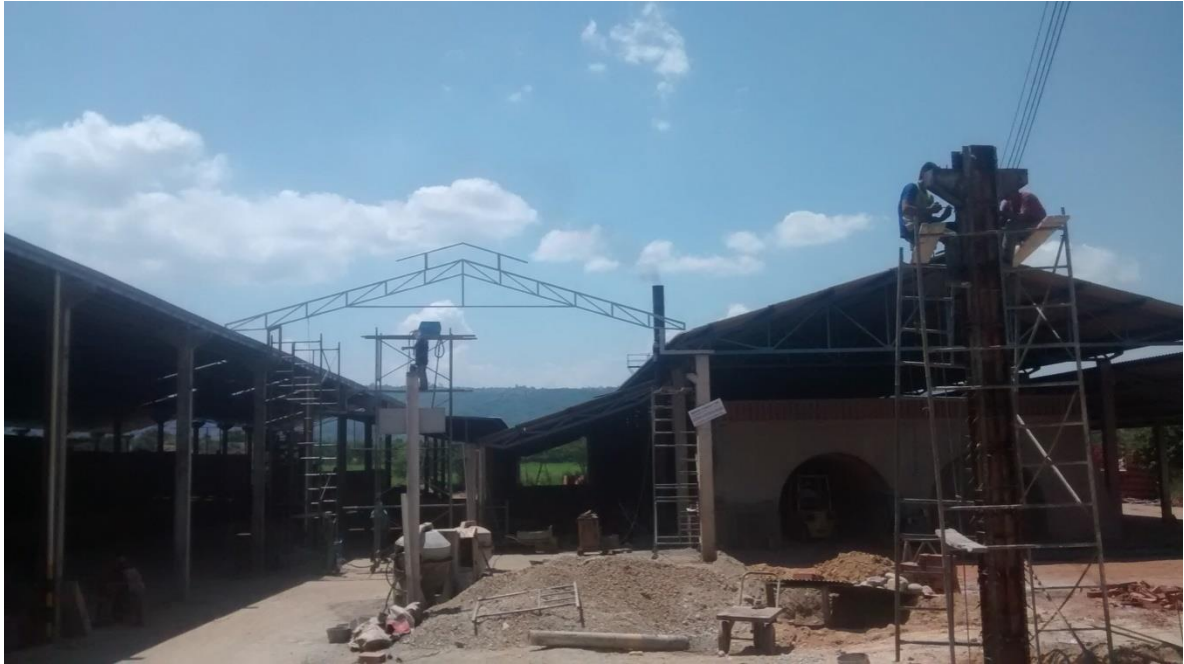
Fotografía 18. Cerchas para el techo.