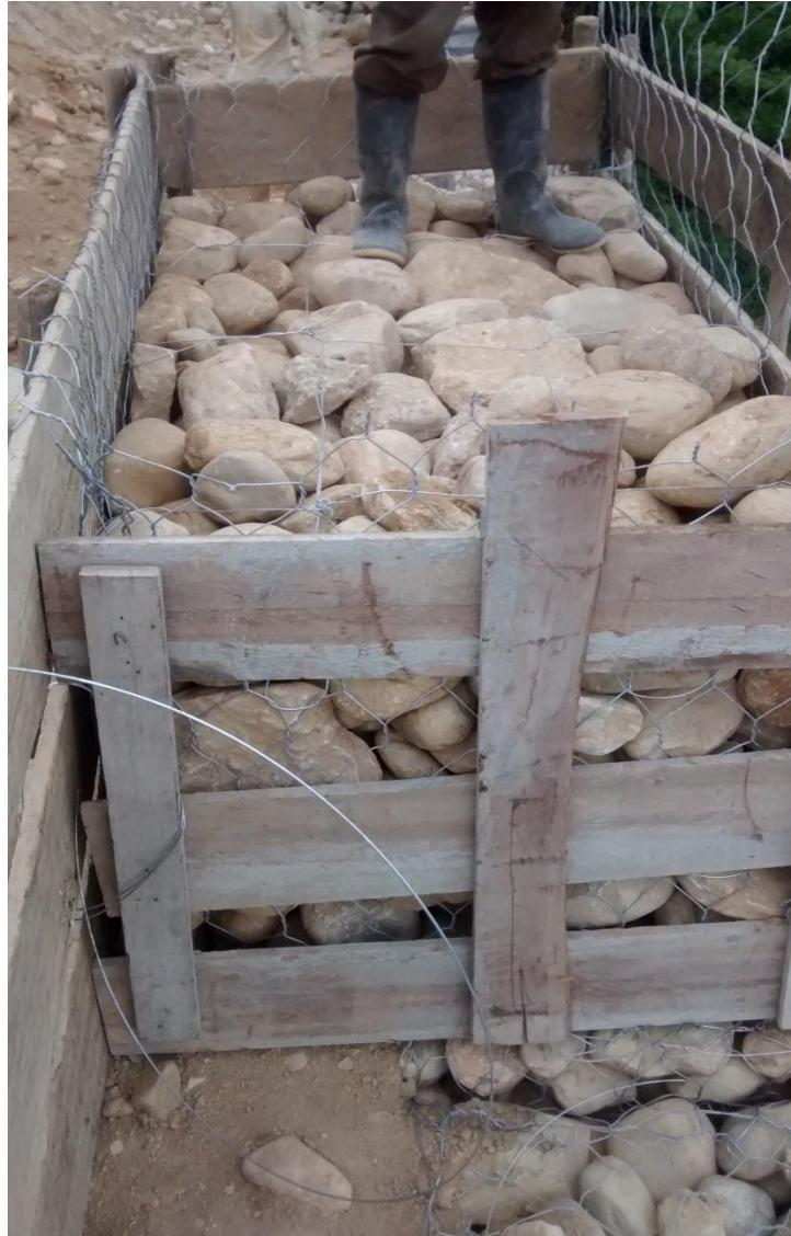
Fotografía 13. Detalle de cada gavión.