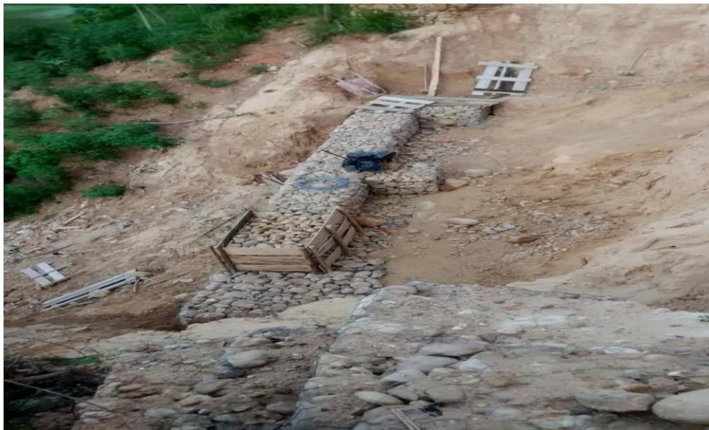
Fotografía 12. Avance gaviones.