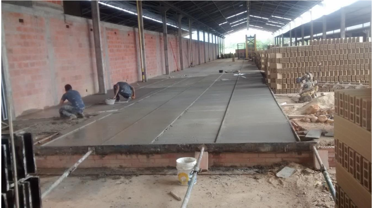
Fotografía 17. Rieles