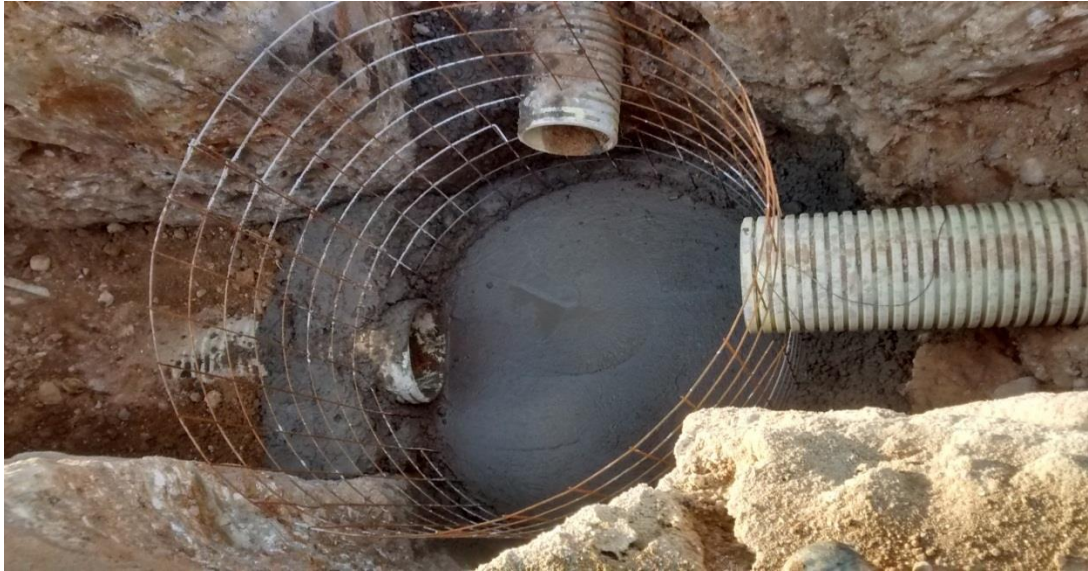
Fotografía 7. Pozo de inspección.