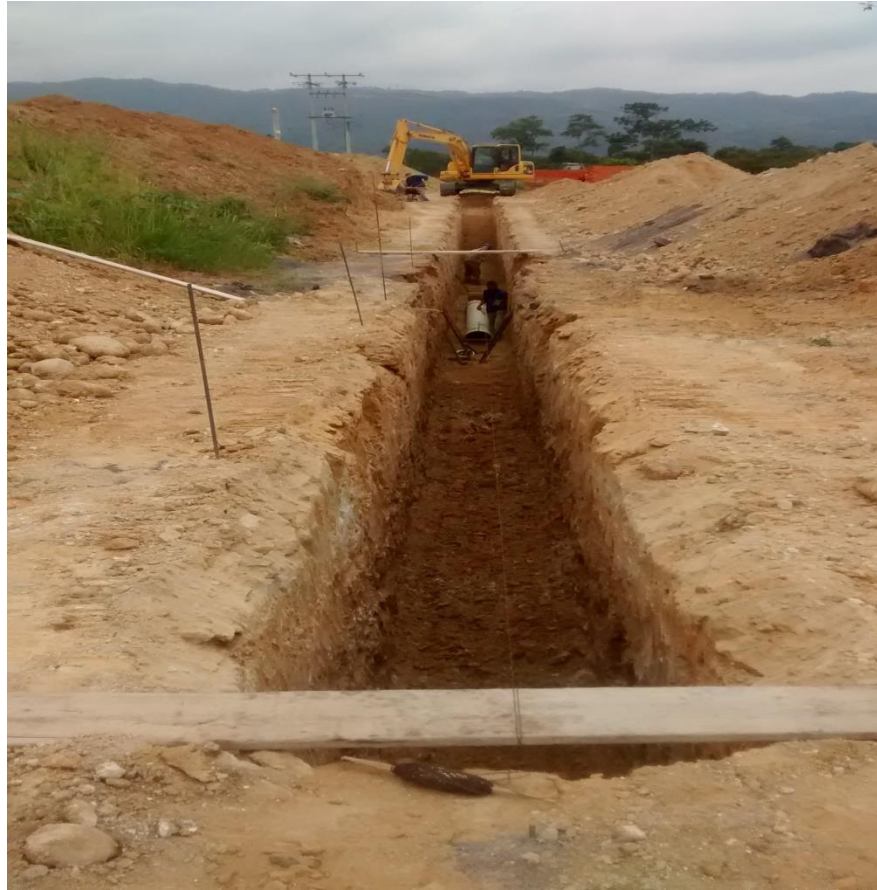
Fotografía 1. Tramo 1