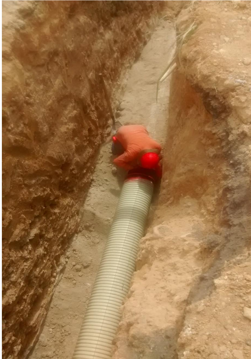
Fotografía 4. Detalle de acople entre tuberías.