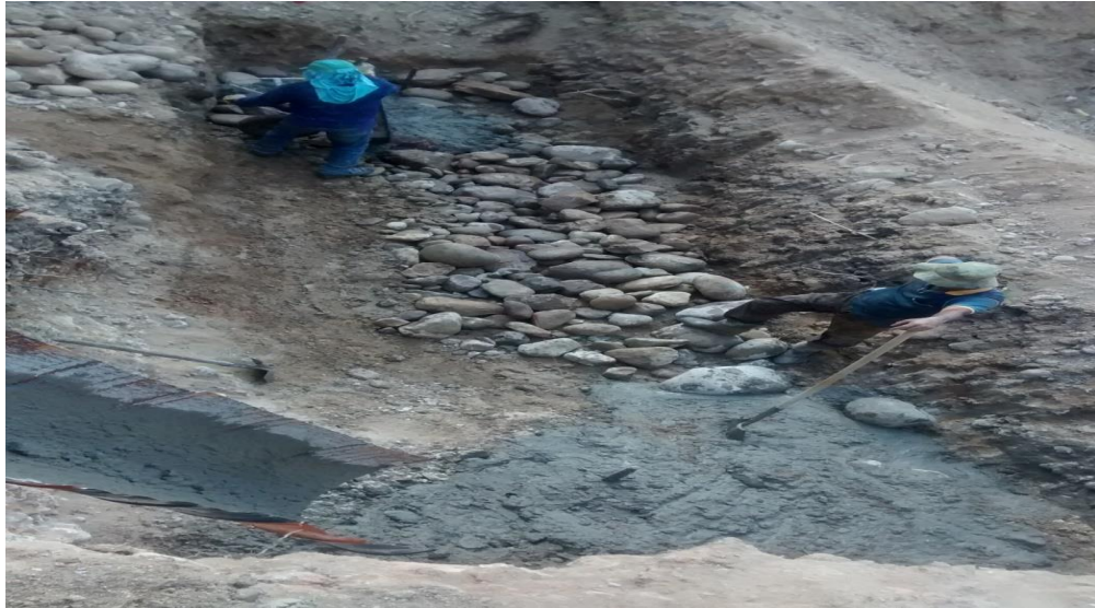
Fotografía 11 Placa de apoyo para gaviones