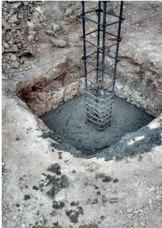
Fotografía16. Detalle de Zapatas de lasColumnas