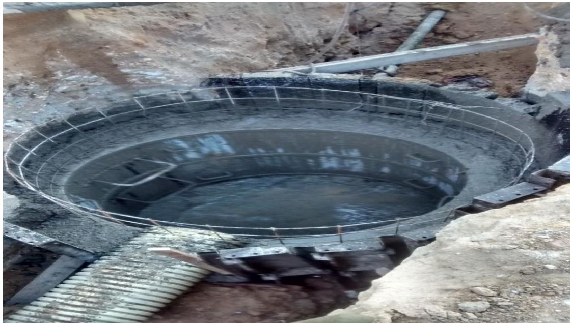
Fotografía 8. Pozo de inspección.