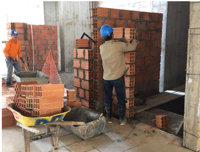
Imagen N° 7

Detalle colocacion de acero de refuerzo para columnetas