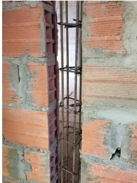
Imagen N° 6

Detalle colocacion de acero de refuerzo para columnetas