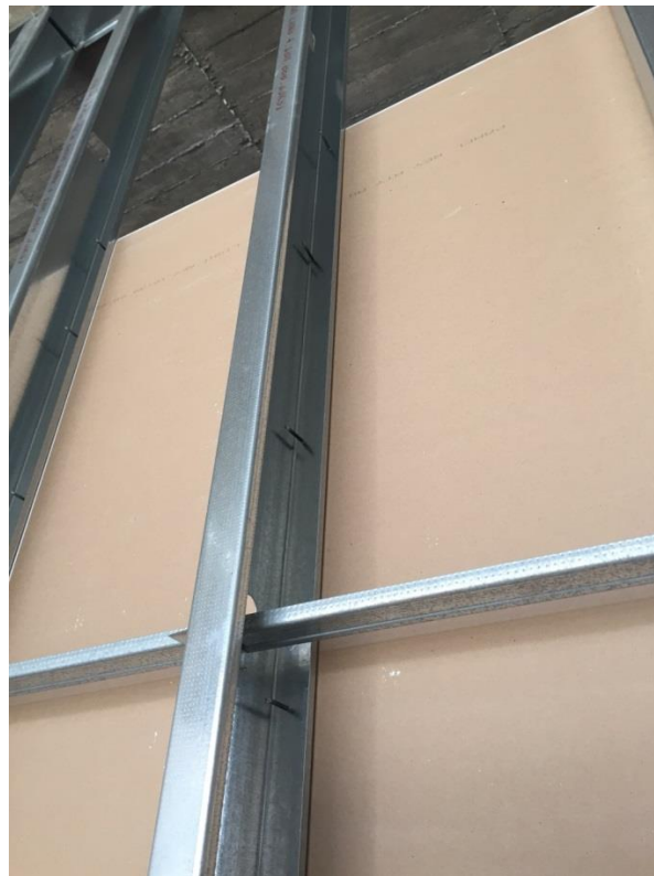
Imagen N° 10 Detalle colocacion de la placa a la estructura metalica