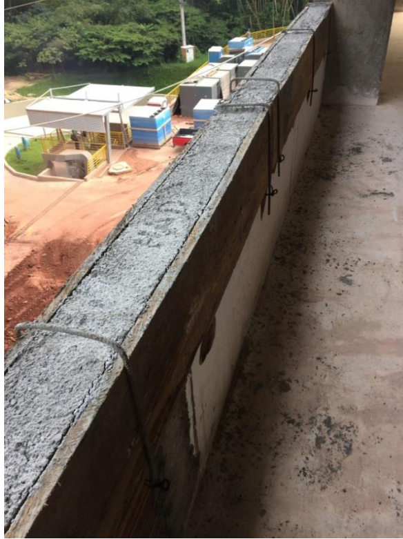
Imagen N° 8 Detalle fundida vigueta

Para el caso de la actividad de muros livianos algunos de los factores de evaluación con los que se puede indicar que dicha actividad se ejecutó con eficiencia son: