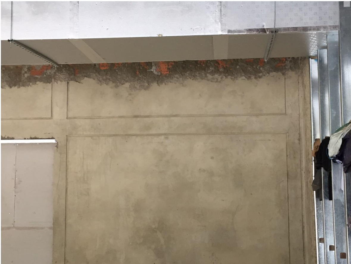
Imagen N° 14 Friso en mampostería con dilataciones

Por ultimo, para la supervision de los frisos lo que principalmente se tiene en cuenta para dar el visto bueno es que la superficie se encuentre totalmente pareja y con el espesor, dilataciones sobre el friso y a la altura indicadas en planos.