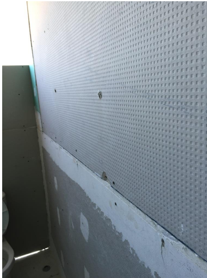
Imagen N° 11

Vaciacion de placas (Placa inferior en fibrocemento, placa superior en yeso)