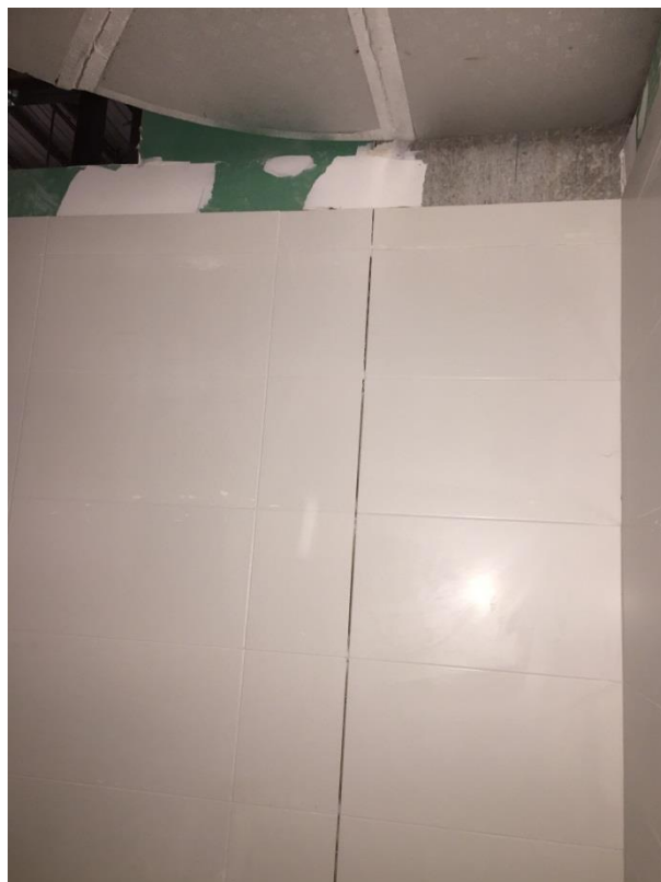
Imagen N° 13 Enchape muro liviano-columna