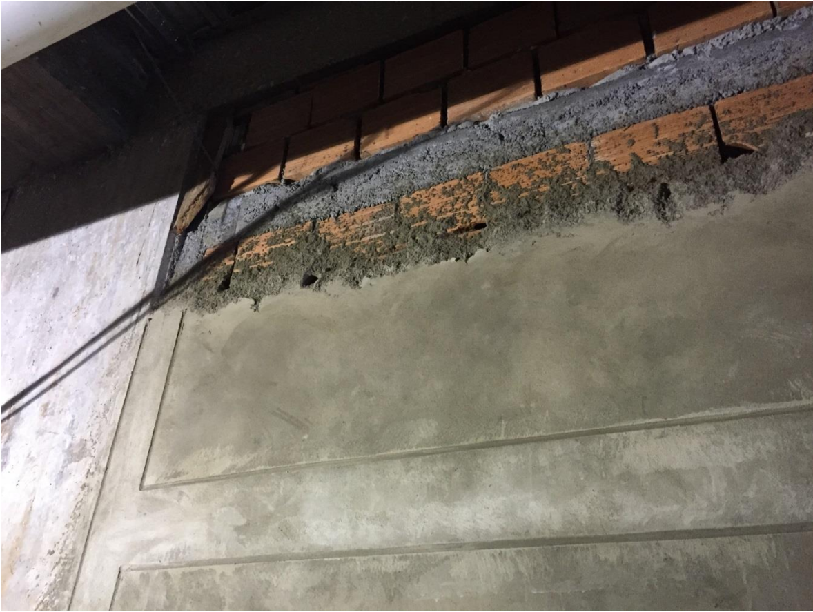
Imagen N° 15 Mamposteria frisada a borde de columna

De la mano con los trabajos de la supervision en las actividades de obra, se siguieron realizando presupuestos de obras un poco mas pequeños en complejidad como lo fueron la Rampa Helipuerto HIC, Bunker HIC y el Puente entre el HIC y CMO, en los cuales se realizó la misma metodoligía llevada a cabo en el presupuesto del Parquedero con el fin de entredgar la estructura y calculo el presupuesto de estas obra.