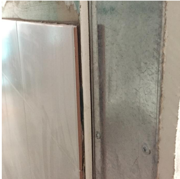
Imagen N° 12 Enchape de muros livianos