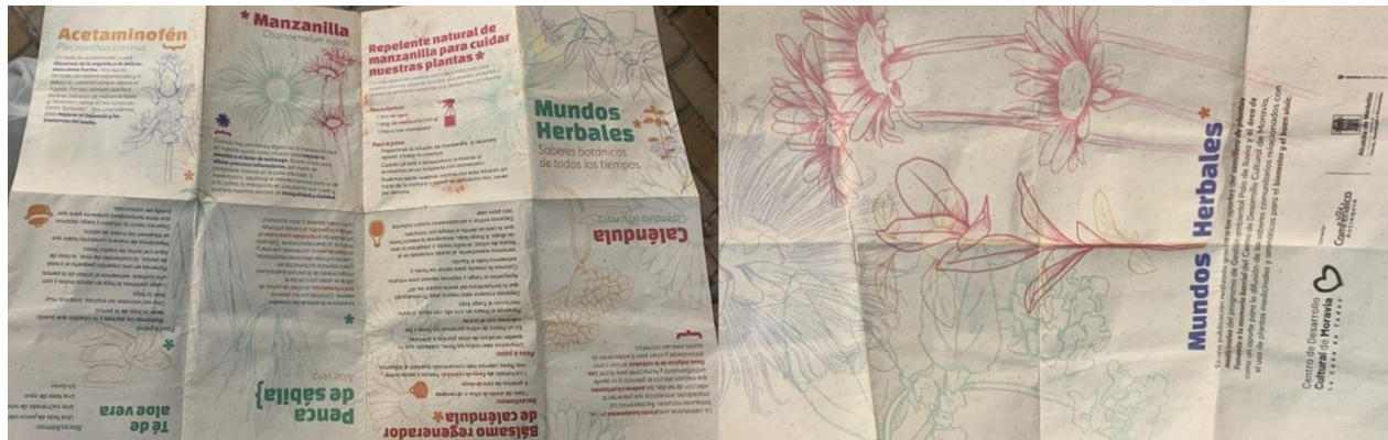
Figura 4 Fanzine “Mundos herbales”

manzanilla como repelente natural. Cada planta tiene ilustraciones delicadas, con una composición visual minimalista que facilita la legibilidad ( Figura 4 ).