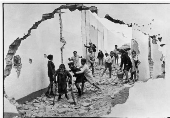
Figura 8. Henri Cartier-Bresson Sevilla (España), 1933.

En la búsqueda de los propósitos investigativos y formativos, se capturó la ciudad desde las estéticas urbanas que circulan entre el arte y aquello que lo desborda. La ciudad, los andenes, los jardines y las calles poseen una percepción propia, construida desde lo subjetivo e incluso lo incierto, pero que los definen (Silva, 2004). Este concepto se relaciona con el “instante decisivo” del fotógrafo francés Henri Cartier-Bresson (Boni y Honorato, 2014), quien concebía al fotógrafo como un ladrón, un artista y un bailarín. Cartier-Bresson, desde sus enfoques humanista y artístico, equilibra la relación fotógrafo-cámara-espacio desde la tríada ojo (ladrón), mente (artista) y corazón (bailarín). Esta composición permite la configuración de procesos de abducción de la realidad que se congelan en fotografías.