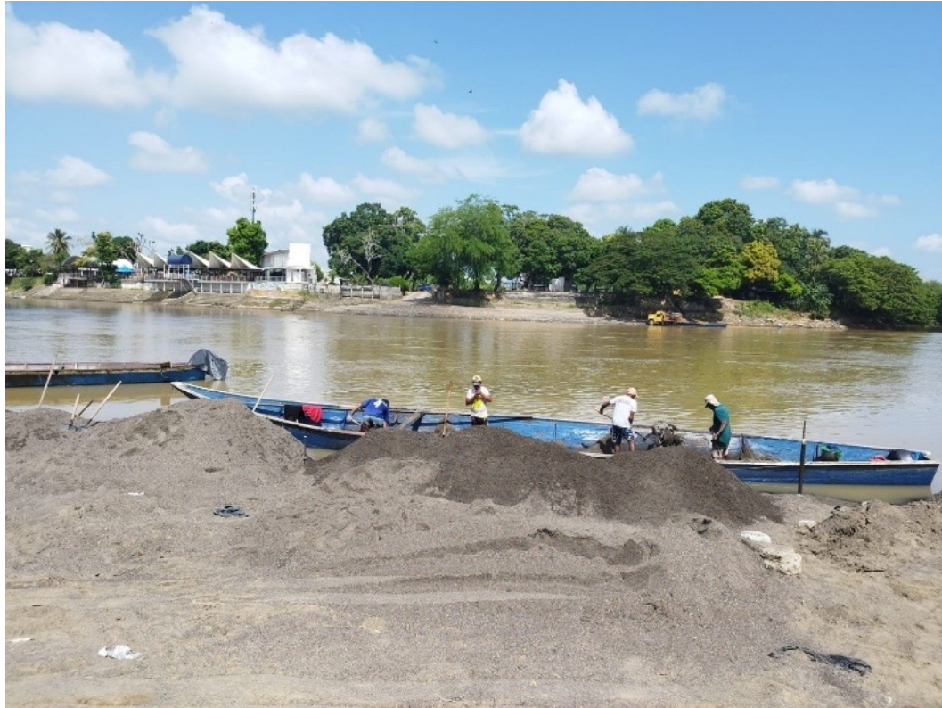
Figura 12. Construyendo sueños con la arena. Río Sinú (Montería, Córdoba).