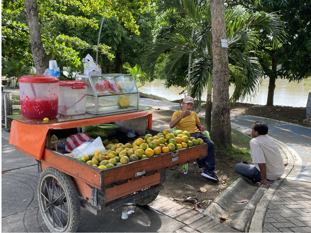
Figura 21. Sabores urbanos.