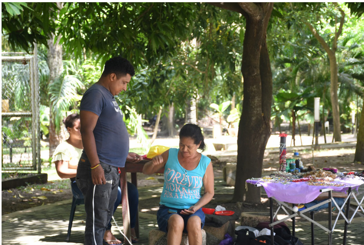
Figura 28. Primera venta del día.