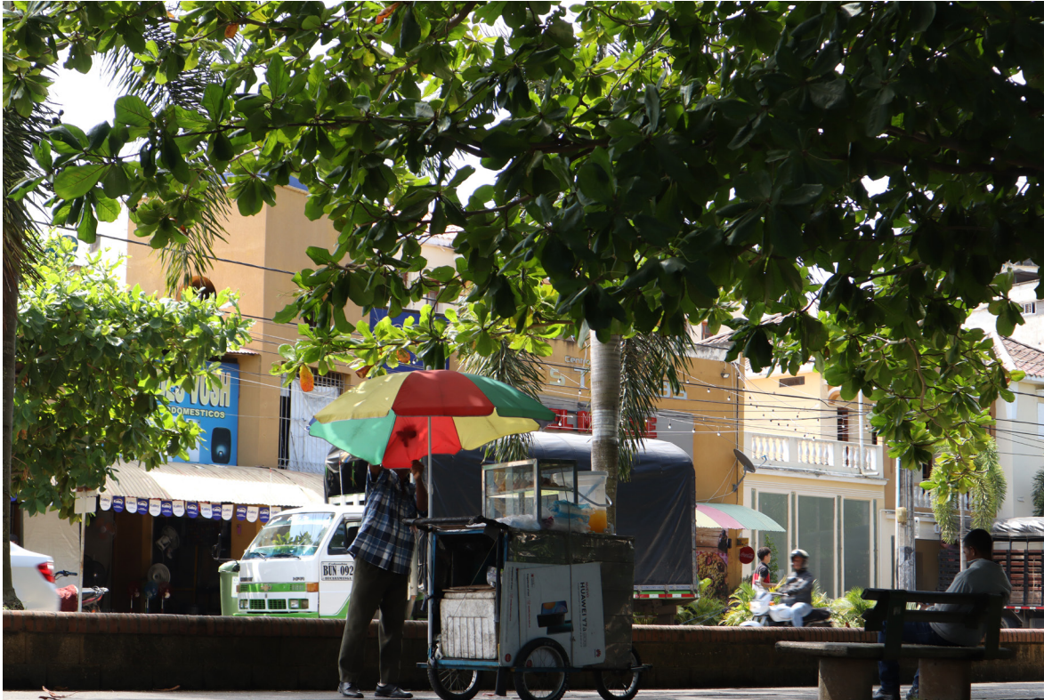
Figura 59. La sombrilla y el paisaje urbano.