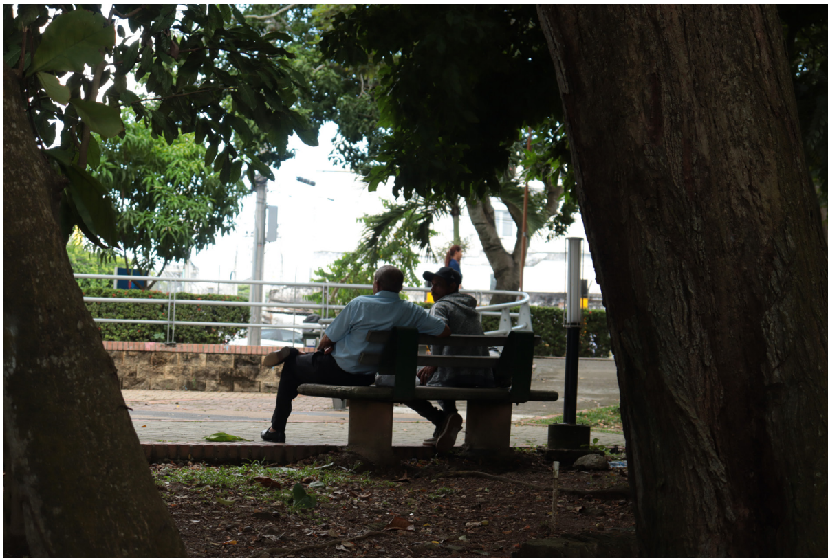
Figura 34. De espaldas al río.