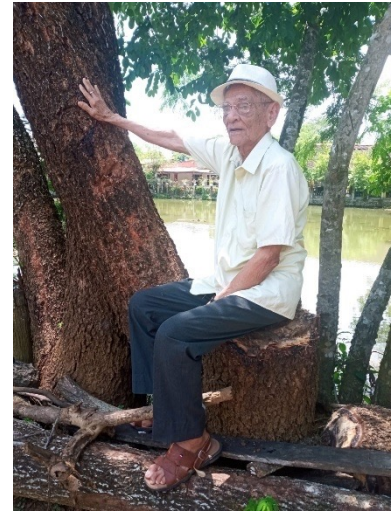
Figura 13. El juglar del río Sinú.

Dar un paseo por la ribera del legendario y hermoso río Sinú es ir en compañía de un amoroso y fiel amigo que a nuestro paso por sus riberas nos brinda un lindo panorama surcado de árboles frondosos, donde moran animales como el perezoso, las ardillas y otros animales curiosos, y un sinnúmero de aves multicolores que con sus cantos y trinos nos deleitan y nos hacen sentir más amena esa caminata. El río Sinú me vio nacer y crecer, es el amigo que guarda en su recorrido las historias de muchos pueblos y ciudades que, orgullosas, se sientan en sus playas arenosas y en sus riberas. En épocas de verano baja el caudal de sus cristalinas aguas y nos deleita una suave brisa y confortable, que nos rodea el entorno, en invierno aumenta su caudal, sus aguas son turbias, cargadas de lindos copos de espuma y pequeños grupos de flotantes miosotis.