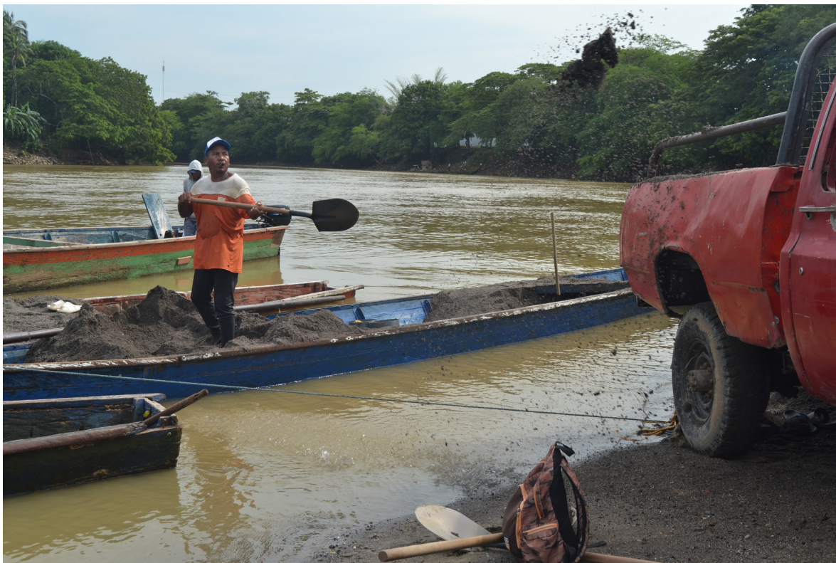
Figura 54. Oficios del río: la arena y la ciudad.