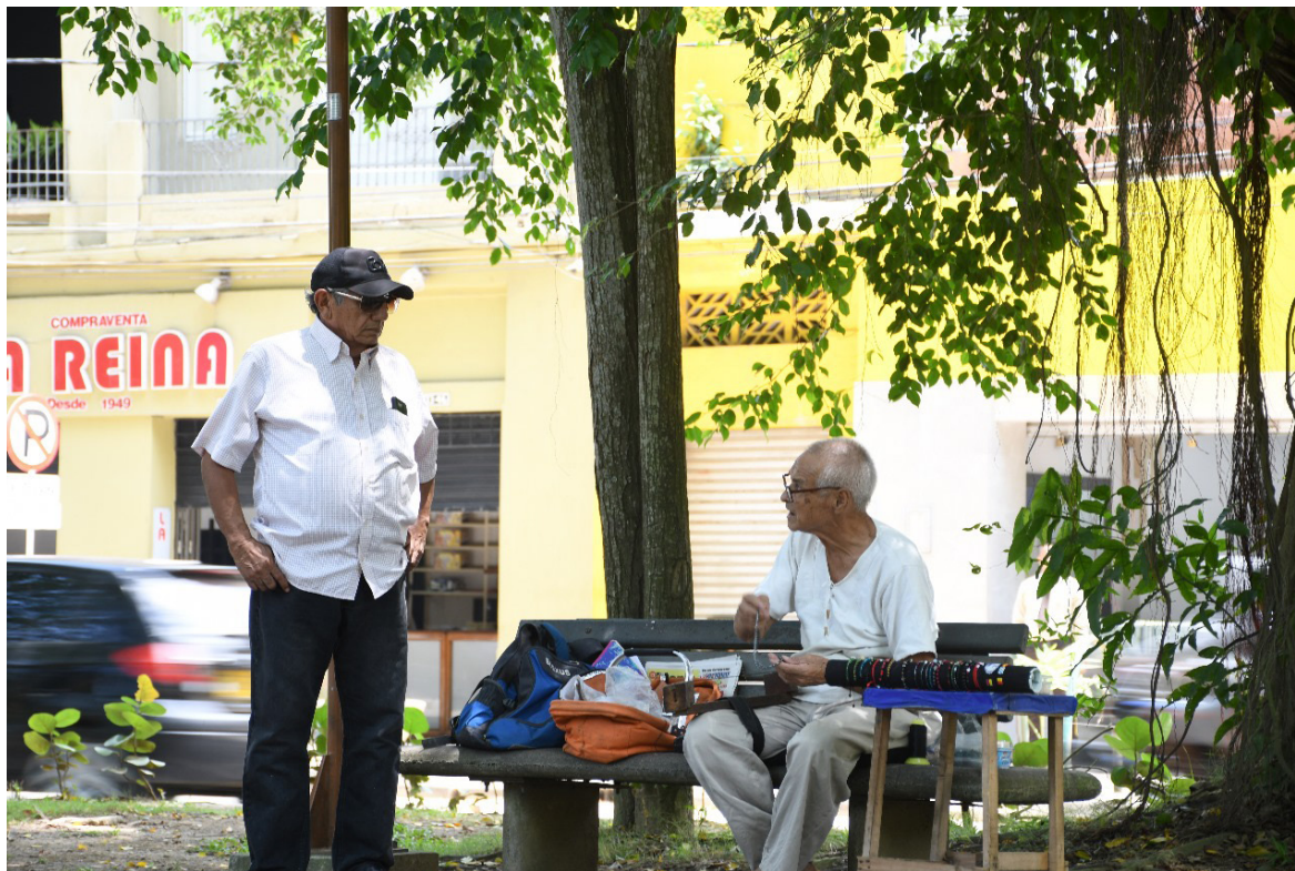
Figura 27. Transacciones ciudadanas.