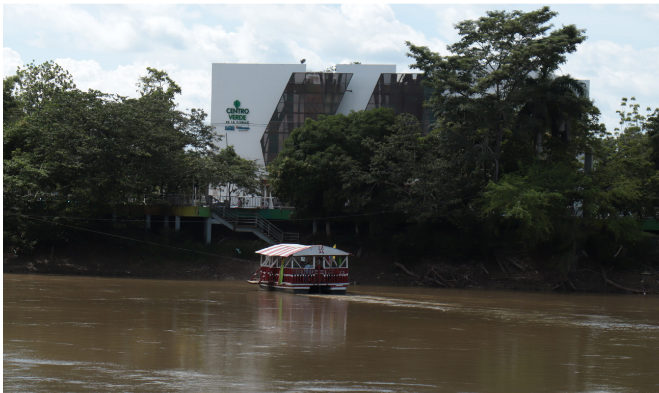
Figura 39. “Planchón”, medio de transporte.