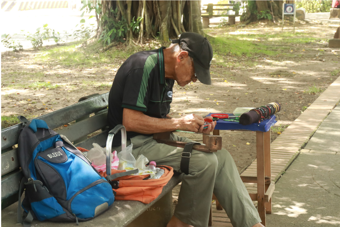
Figura 44. Una filigrana del modo de ser urbano.