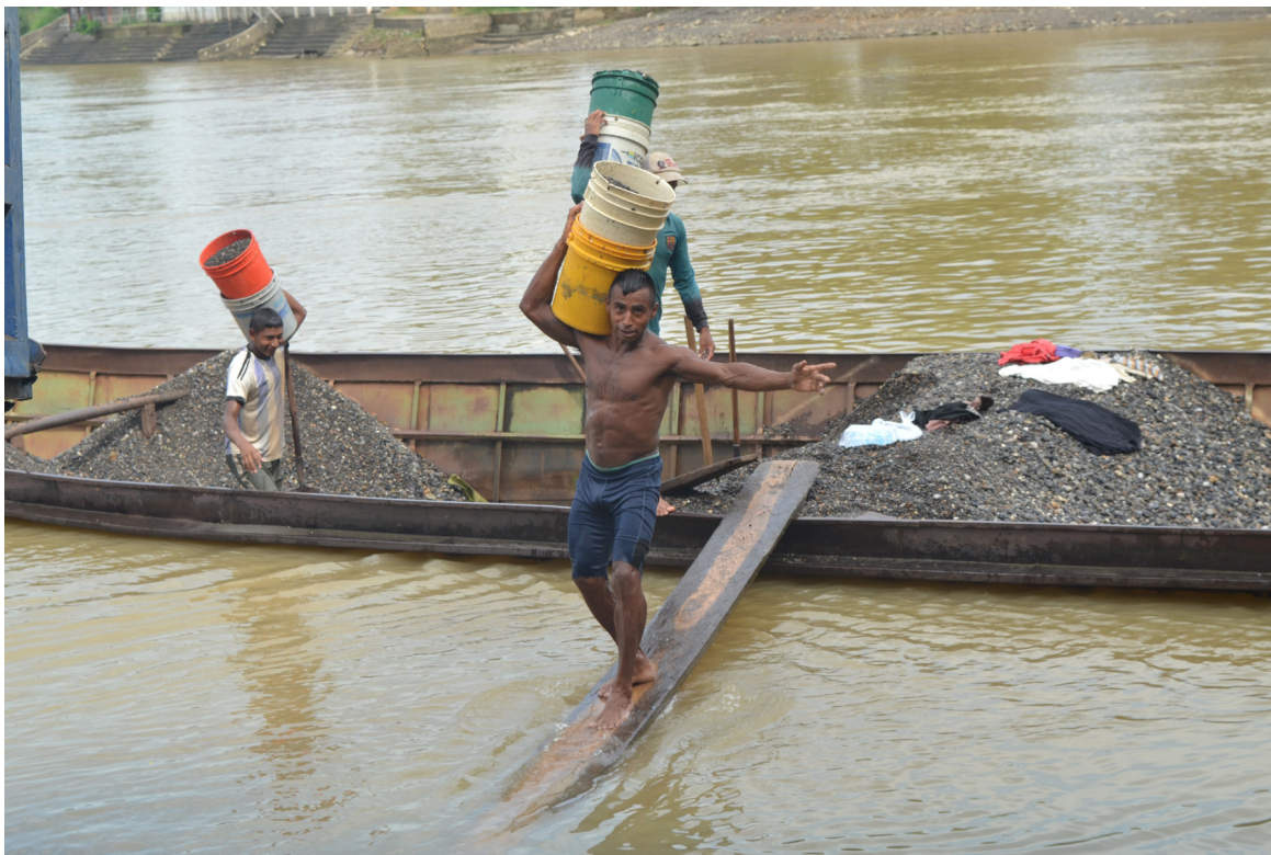
Figura 80. Las máquinas del Sinú.