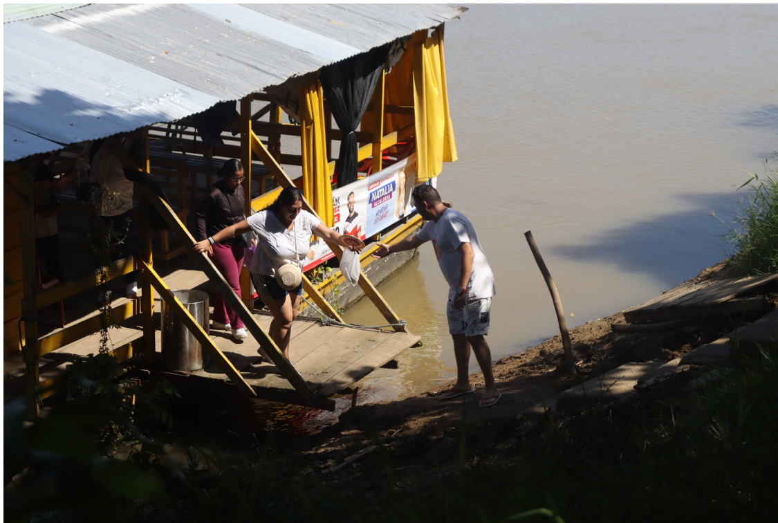
Figura 19. Arribo, un ritual de amabilidad urbana.