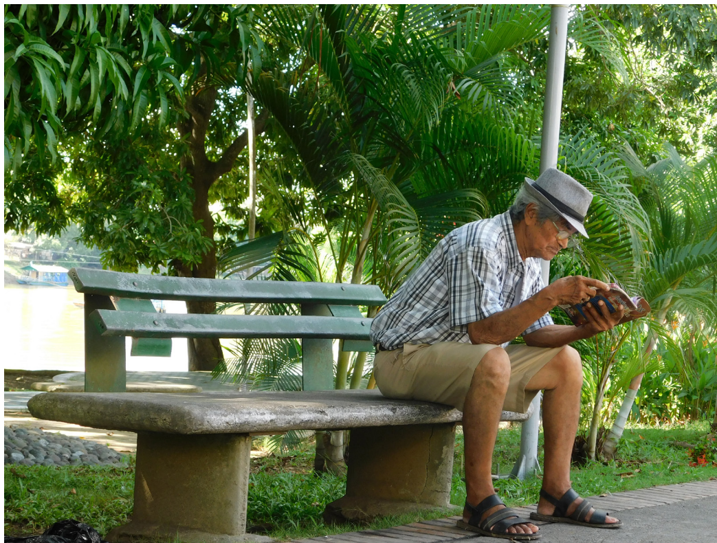
Figura 63. Disposición para la lectura.