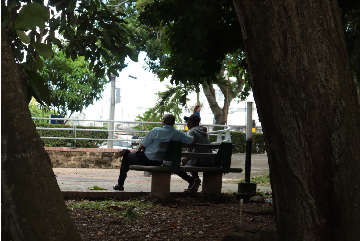
Figura 92. De espaldas al río.