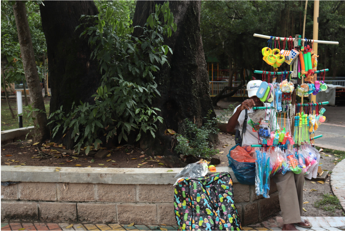
Figura 50. La iridiscencia del espacio urbano.