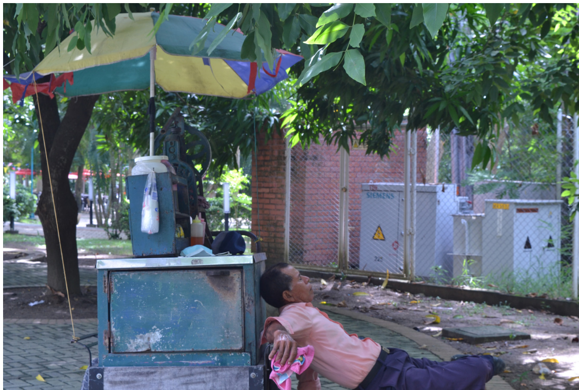
Figura 66. Arrellanado en la ciudad.