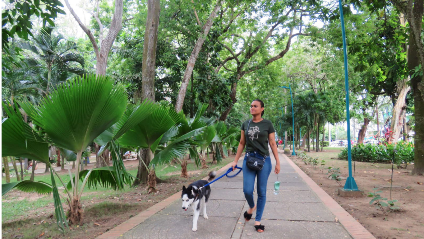
Figura 87. Urbanización de la naturaleza.