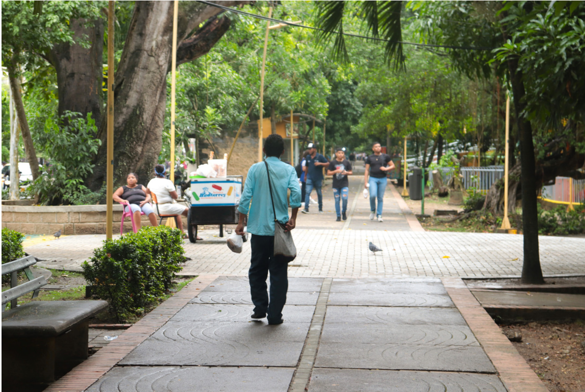
Figura 94. Dos modos de ser en el río.