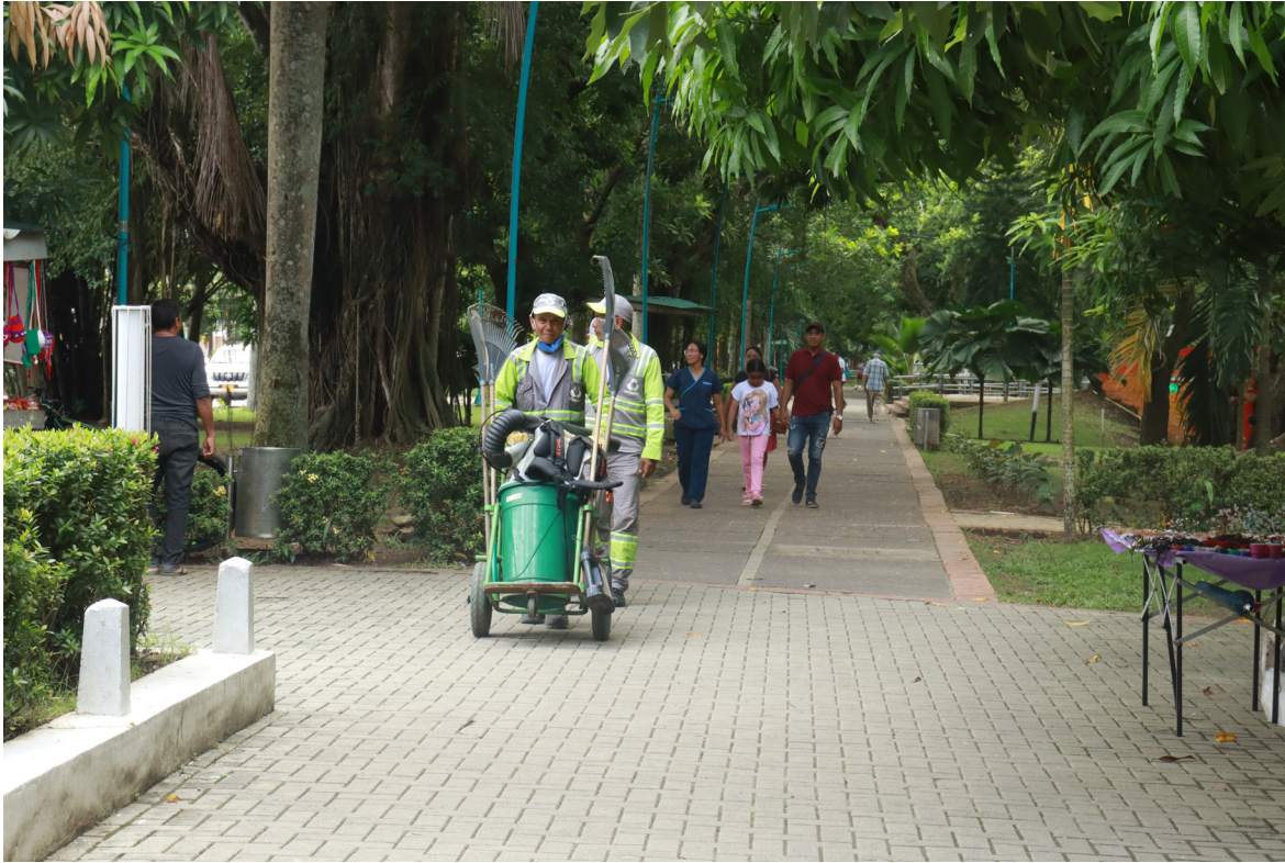
Figura 14. Expresión ciudadana: una sonrisa en el rostro y un rastrillo en la mano.