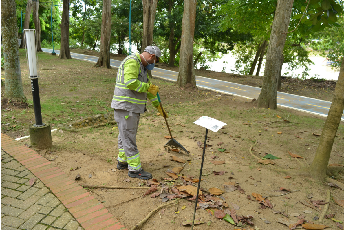
Figura 45. El rastrillo y la intervención de la Ronda.