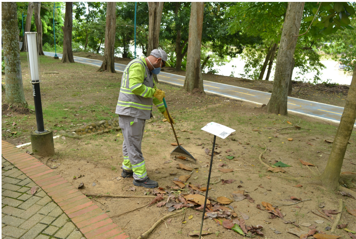
Figura 96. El rastrillo y la intervención de la Ronda.