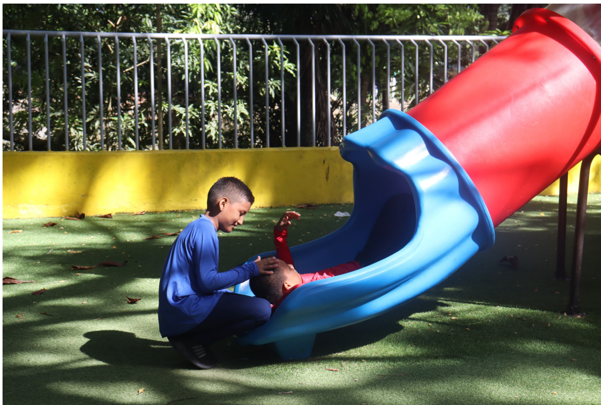
Figura 18. Los colores y el juego.