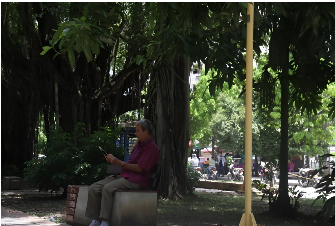
Figura 98. Cantos del Sinú: vibraciones de un corazón.