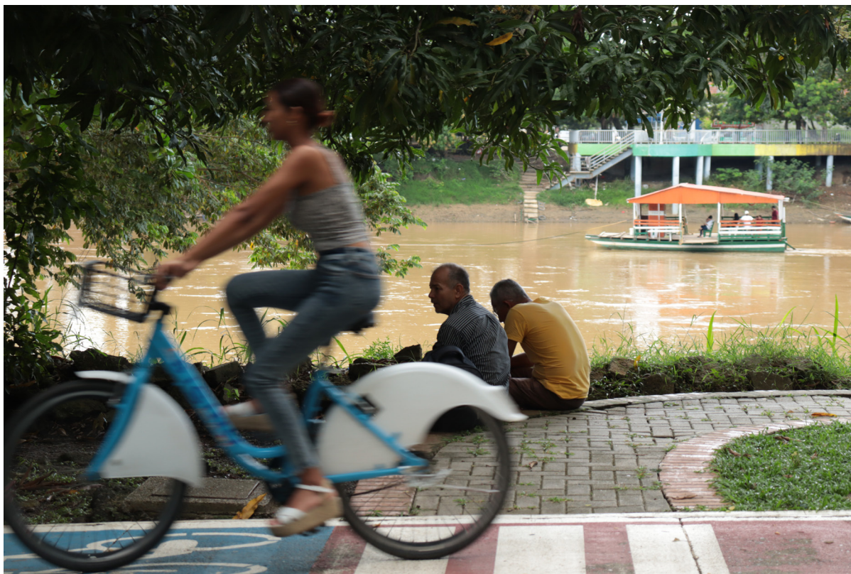
Figura 35. La flecha del tiempo atrapada en tres momentos.