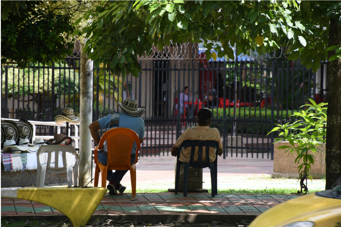
Figura 26. La empalizada, una proyección ciudadana.