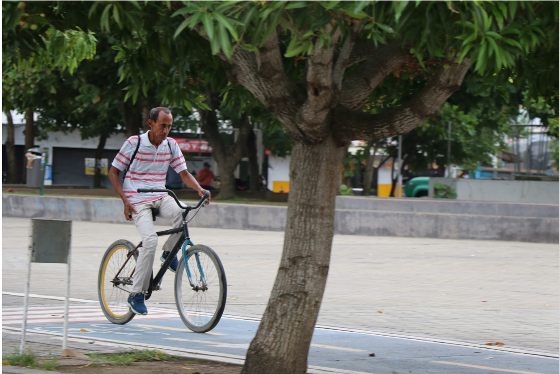
Figura 2. La mirada del ciclista. Ronda del Sinú (Montería, Córdoba).