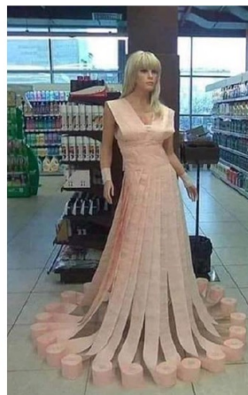
Figura 1. Última moda. Fuente: desconocida.

Imaginario dominante: la gente compraba al inicio del confinamiento más papel higiénico que alimentos (figura 1).