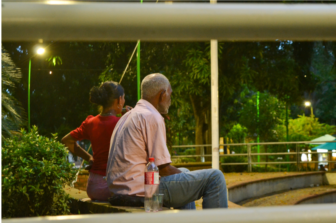
Figura 24. A través de: espectadores nocturnos.