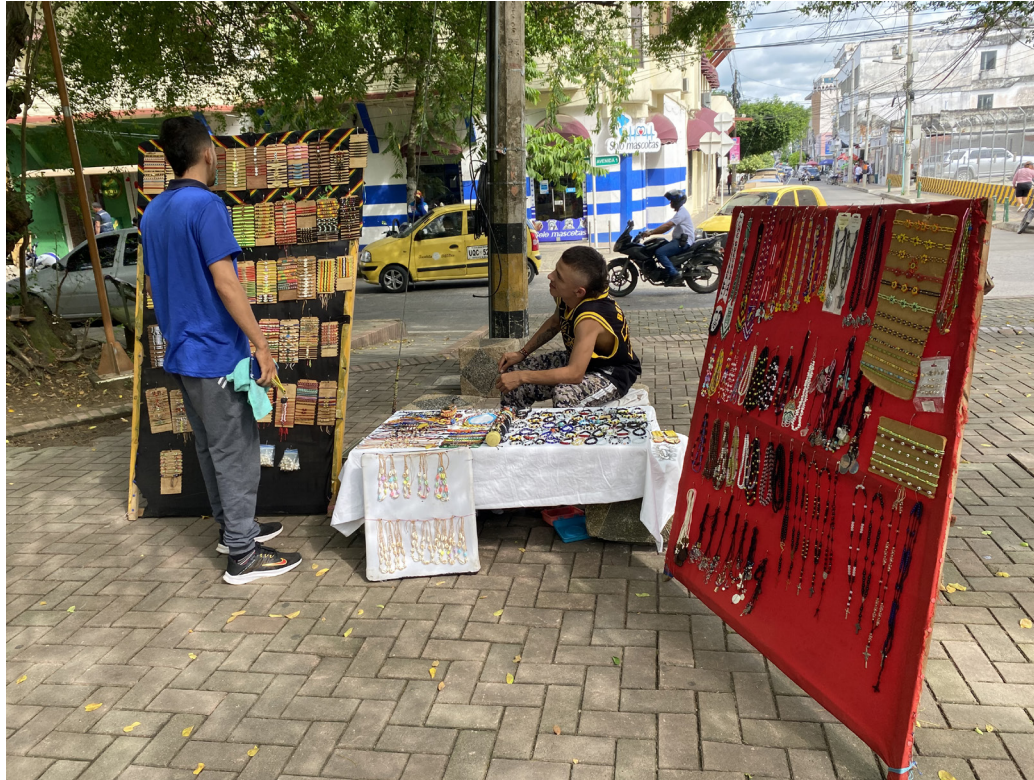
Figura 22. Ingenio artesanal y rutinas ciudadanas.