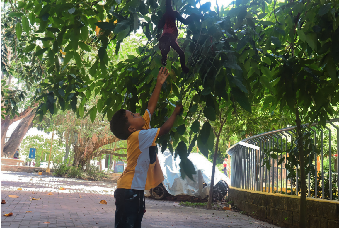
Figura 67. La creación.