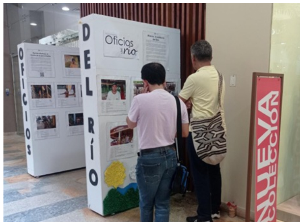
Figura 99. Oficios del Río 2022.