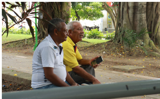
Figura 9. La Ronda del Sinú y la tradición oral.

única de la localidad. Para el caso del Sinú, se disfruta de un sinnúmero de sonidos que evocan la identidad propia del caudal del agua de un río sinuoso, abrazado por uno de sus costados por un parque lineal, siendo este el lugar donde los transeúntes se dan cita y en el que se escuchan sonidos como el del vendedor de butifarra, el de la barbería ambulante, los grupos de bailes urbanos, el jolgorio que se genera alrededor del encuentro eventual con los animales silvestres, las voces infantiles que se perciben en las zonas de juegos y los susurros de los enamorados.