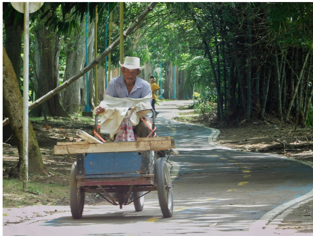
Figura 74. Un instante de soledad y desprecio.