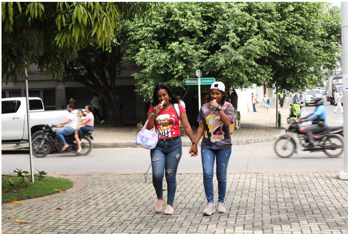
Figura 82. Imaginación.