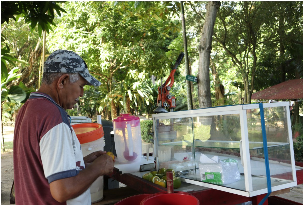
Figura 58. El arte de menguar el calor.