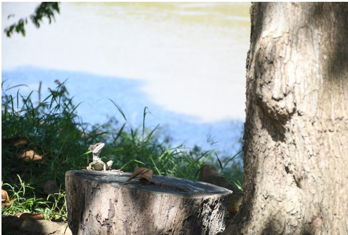
Figura 70. La naturaleza en lo urbano.