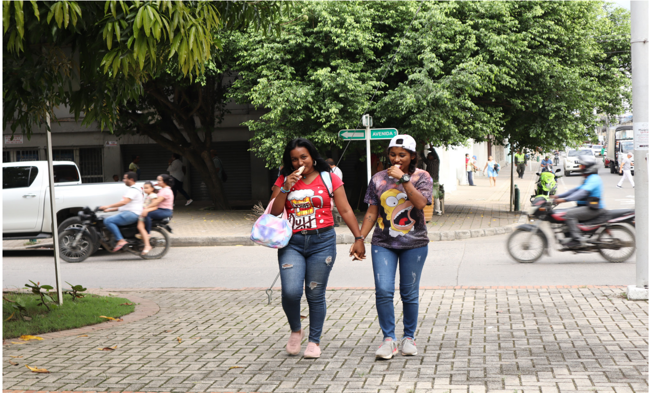
Figura 31. Las amigas, el helado y el río Sinú.