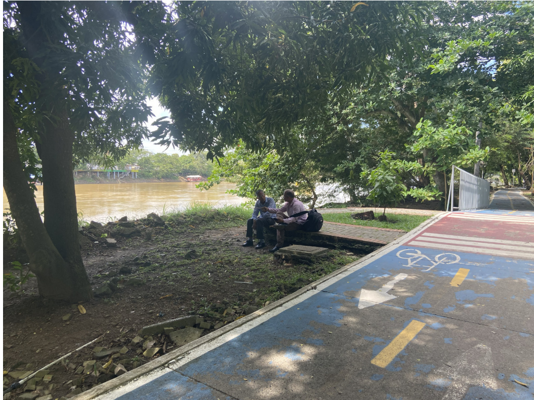
Figura 17. El lenguaje al natural.