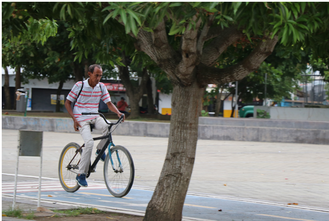
Figura 76. Ruedas cargadas de historia.