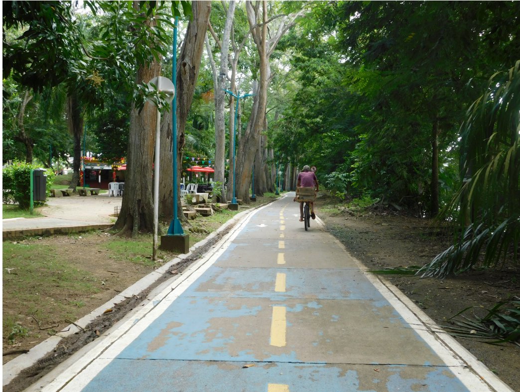
Figura 36. Senderos urbanos, rutas verdes.