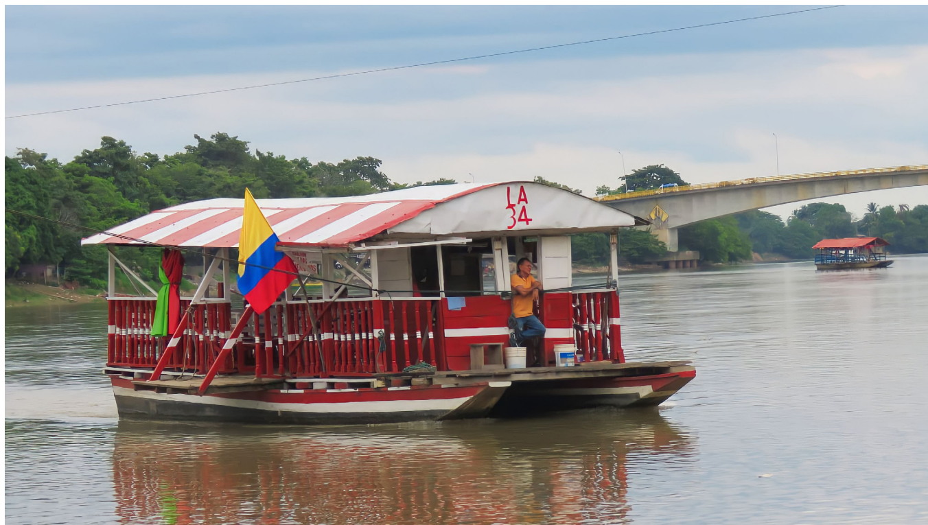
Figura 57. La 34, una ruta ciudadana.

Fuente: Propiedad de Lluvia Carolina González Rodríguez.