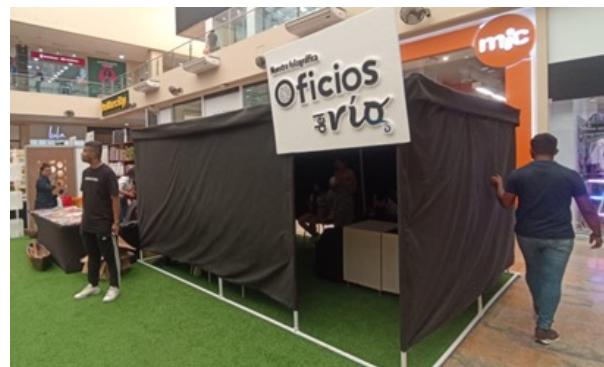
Figura 100. Oficios del Río 2023.