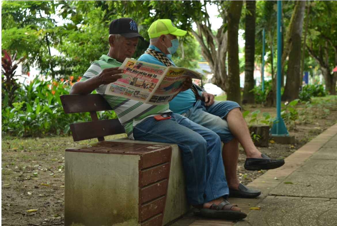
Figura 23. Lectura y contemplación en el parque.