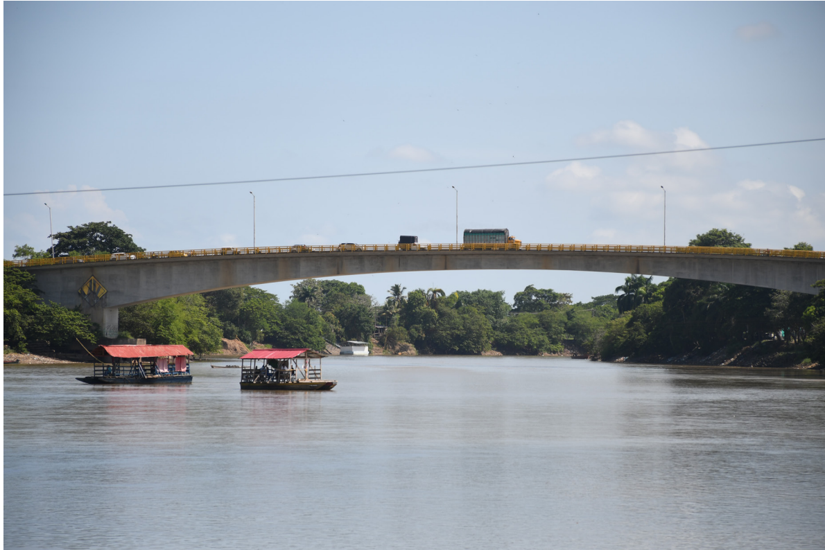
Figura 10. El río imaginado a través del puente. Río Sinú (Montería, Córdoba).