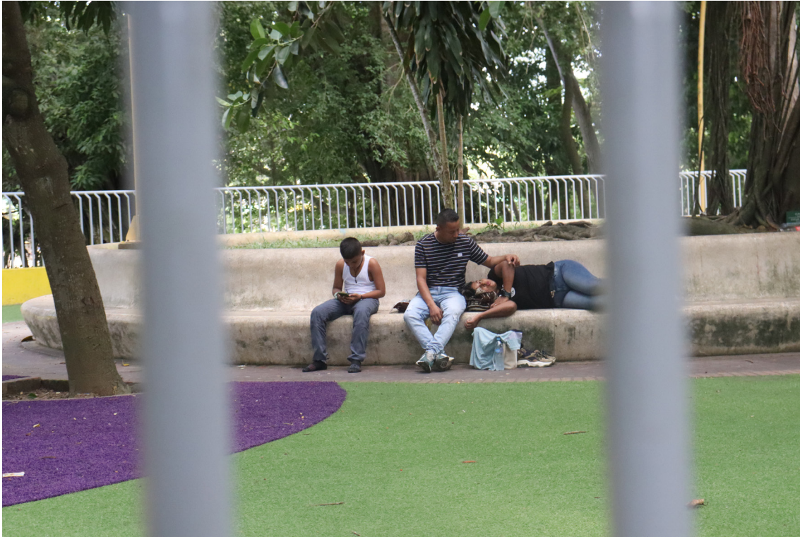
Figura 84. Cuando me llevaban al parque.