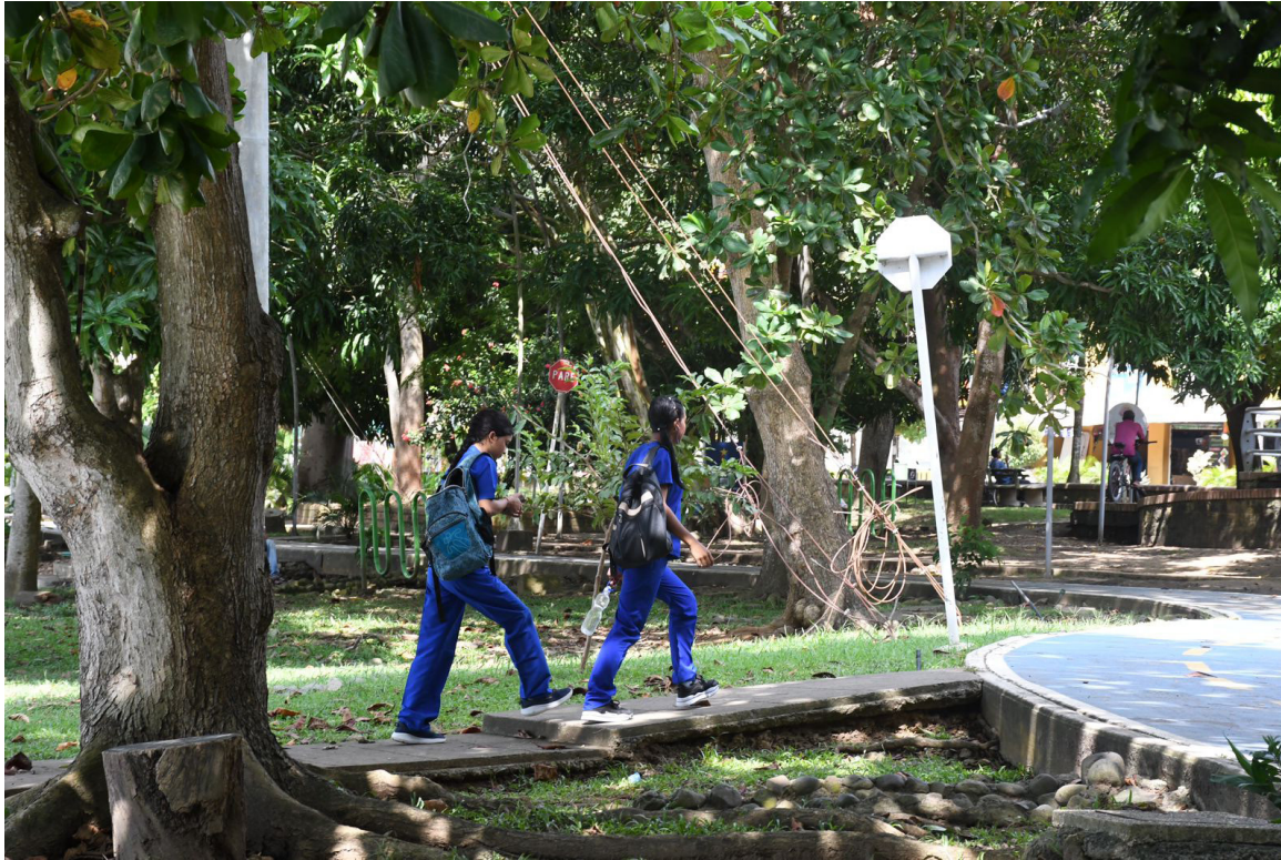
Figura 30. Camino a estudiar.