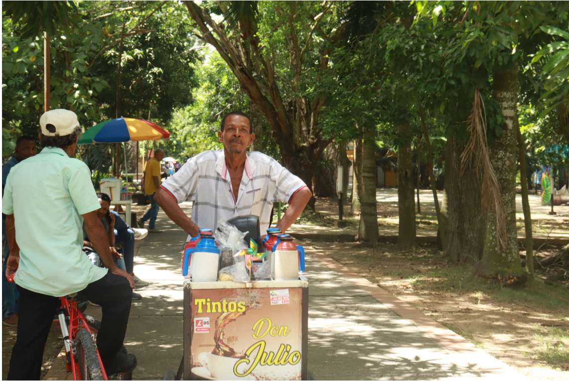
Figura 15. El tinto y las rutinas ciudadanas.