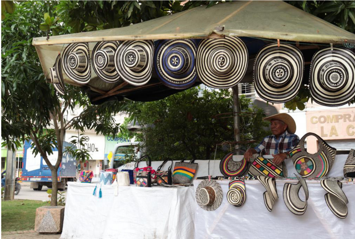
Figura 51. El legado zenú: un tejido urbano.