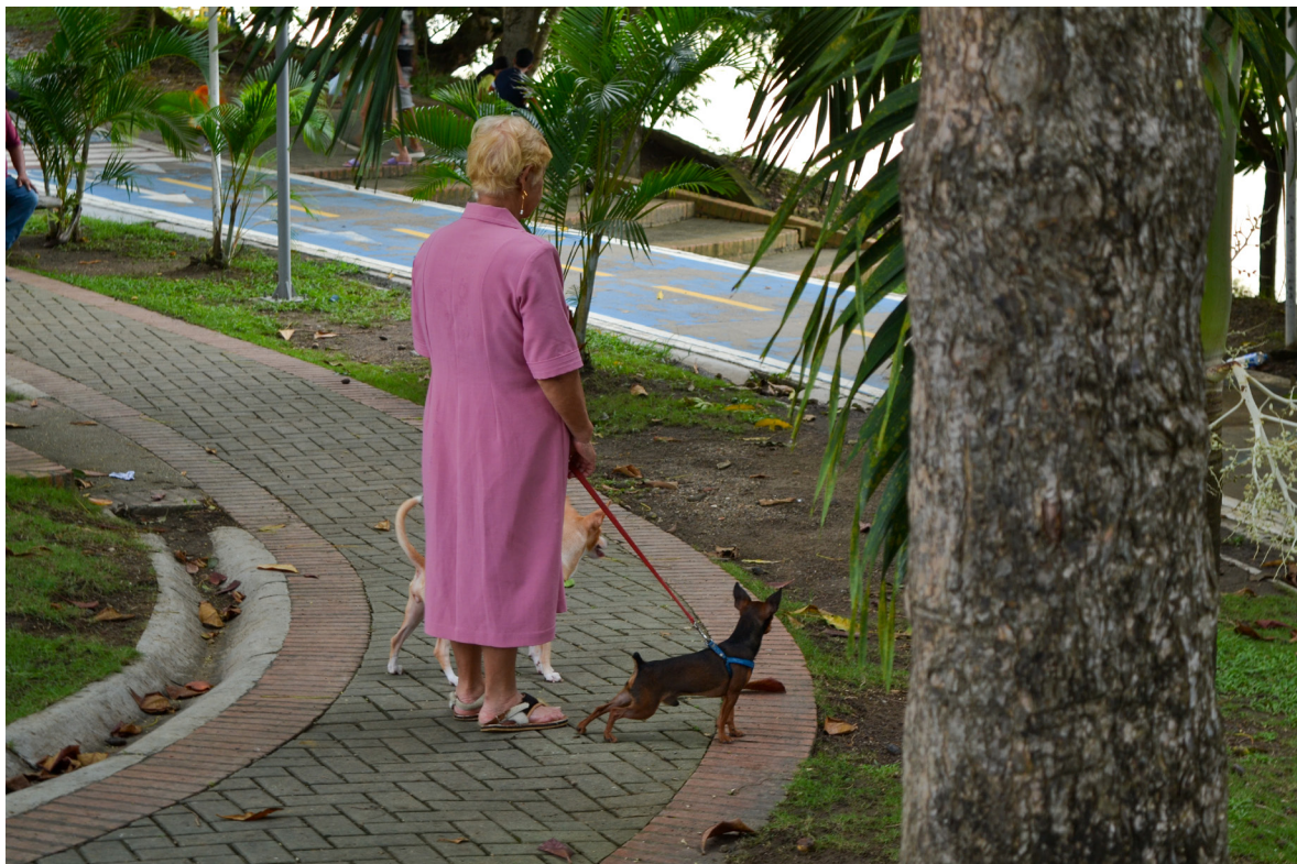
Figura 71. Mirando al río.