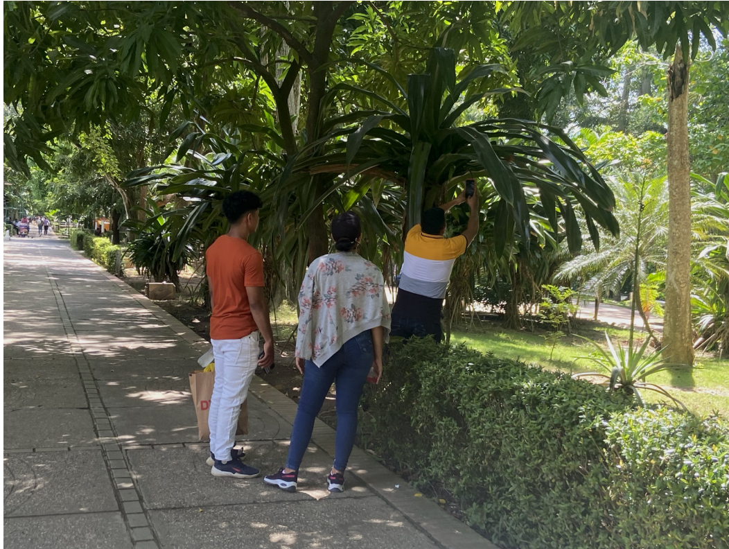
Figura 68. Capturando la naturaleza, una rutina ciudadana.