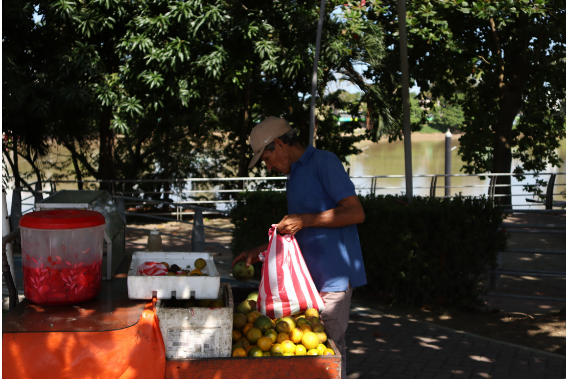
Figura 60. Cosechando.