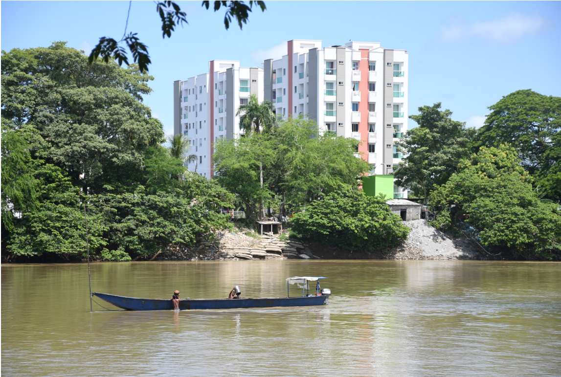
Figura 40. El río Sinú, espejo de dos realidades.