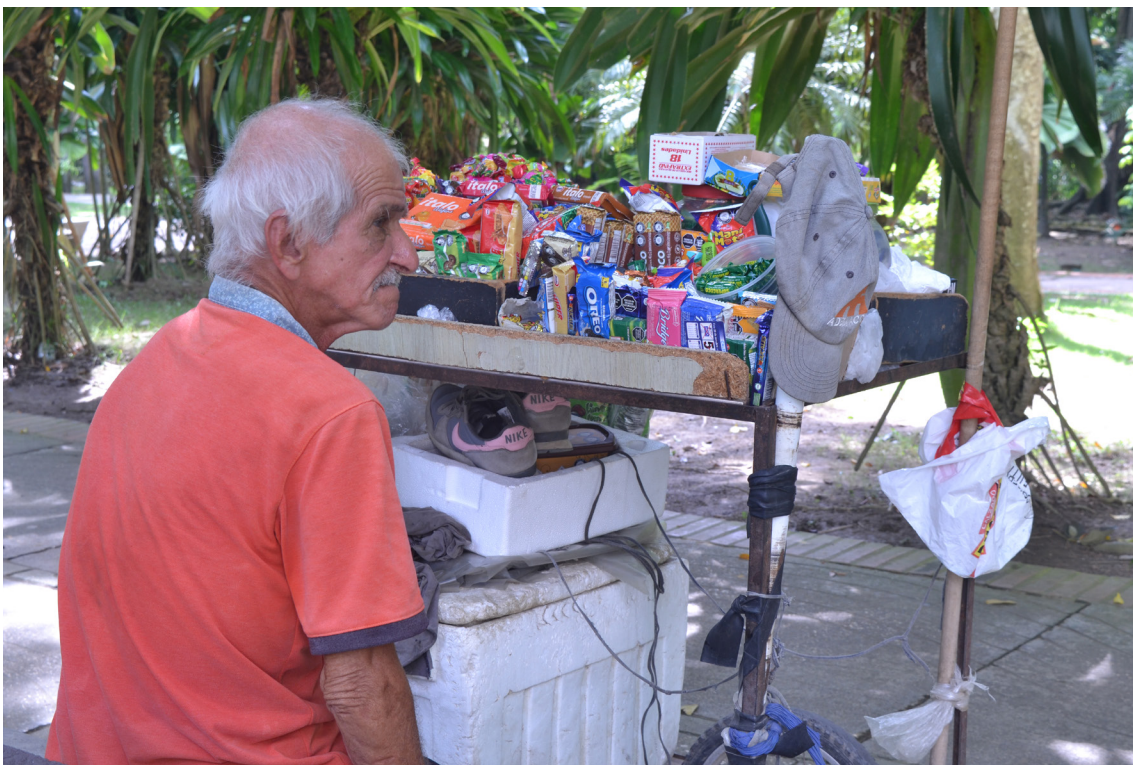
Figura 65. De todo como en “botica”.