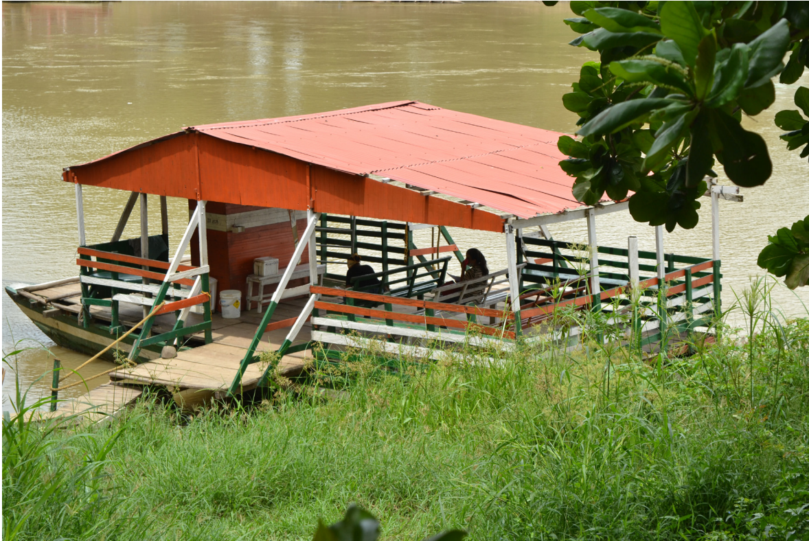
Figura 46. Llegando a buen puerto.