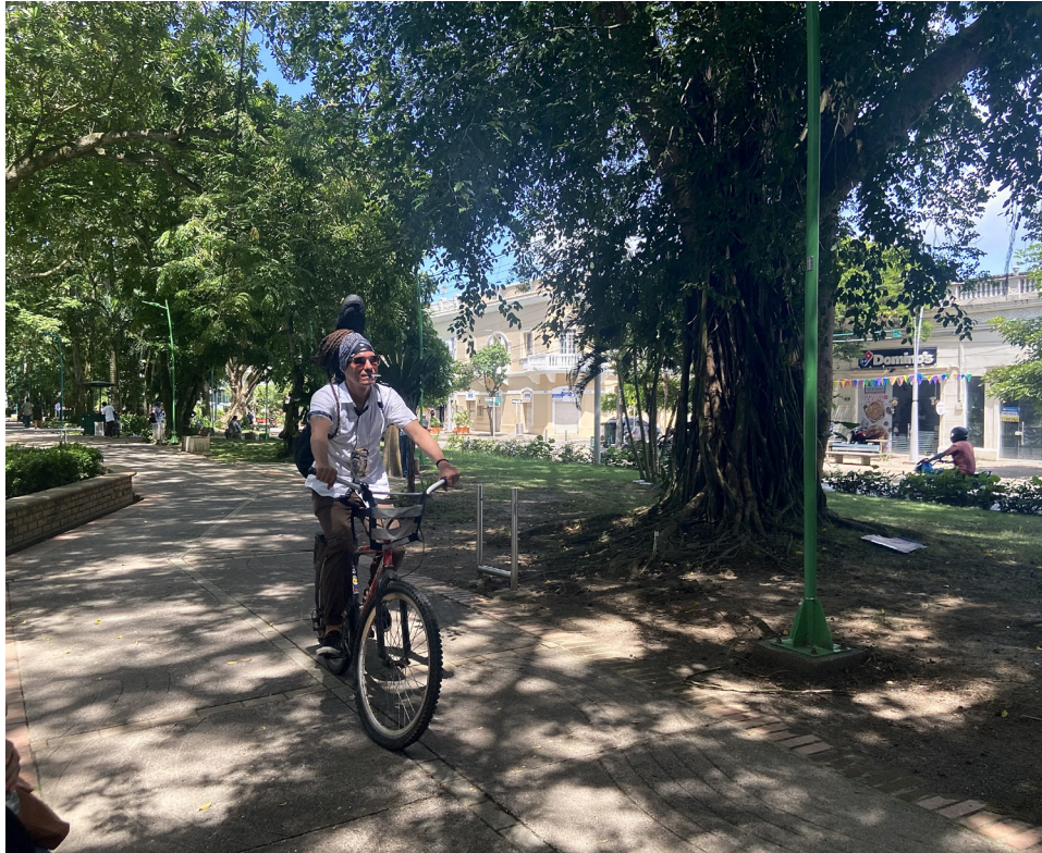
Figura 77. El escape de la realidad.