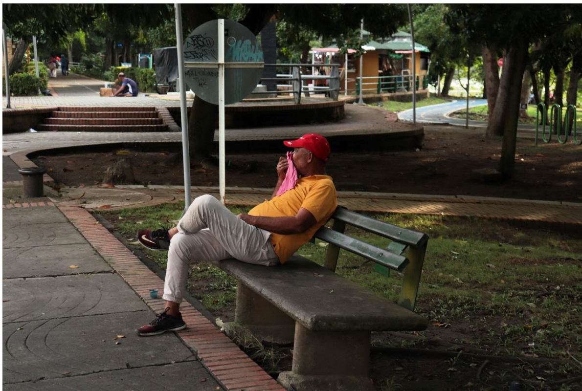
Figura 49. Cómo piensa el hombre.