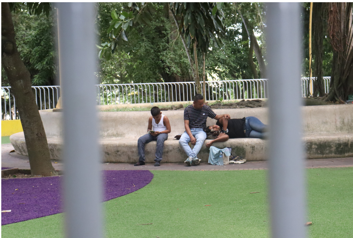
Figura 20. A través de: rutinas de familia.