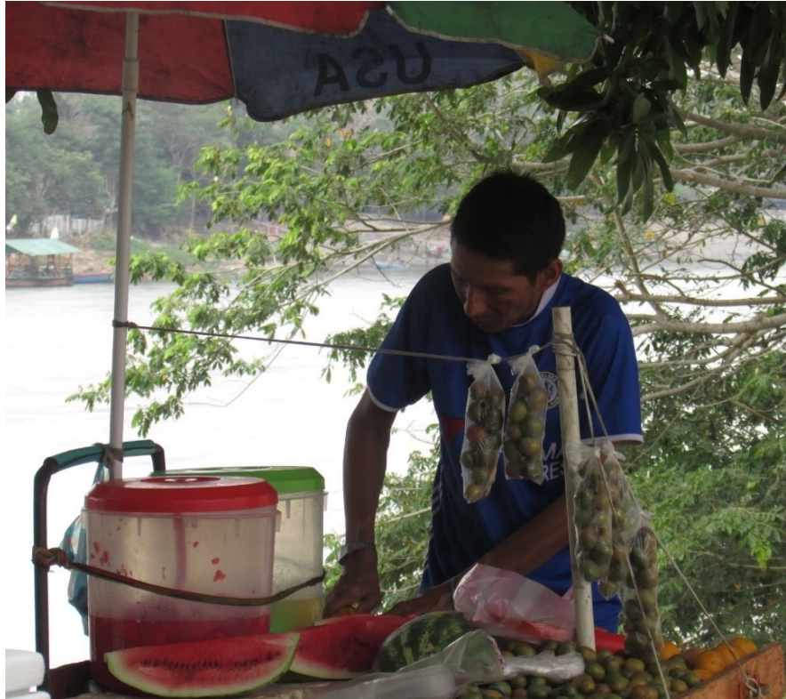
Figura 7. Sabor de fruta madura. Ronda del Sinú (Montería, Córdoba).