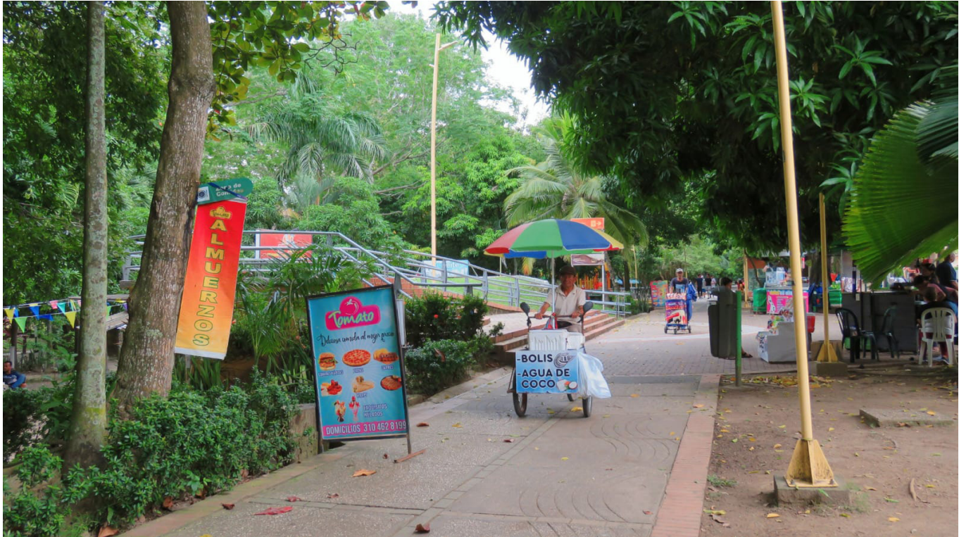
Figura 56. Ventas de colores.