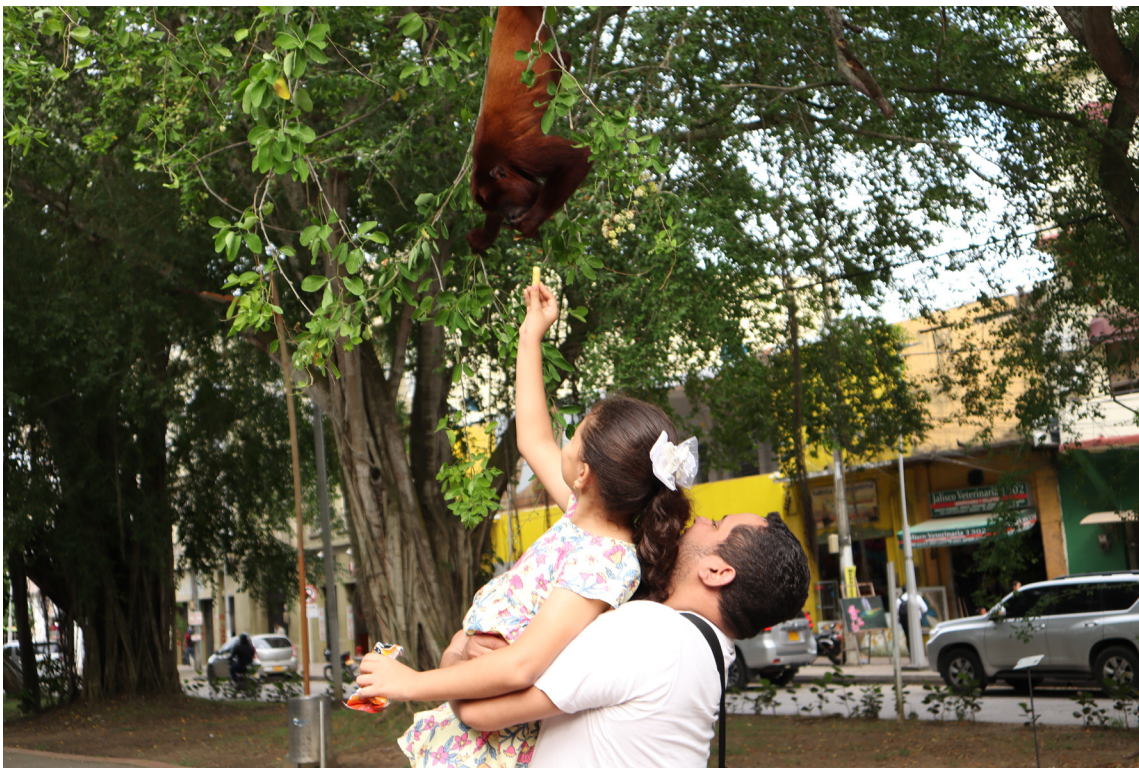
Figura 73. La familia y la naturaleza, una expresión ciudadana.