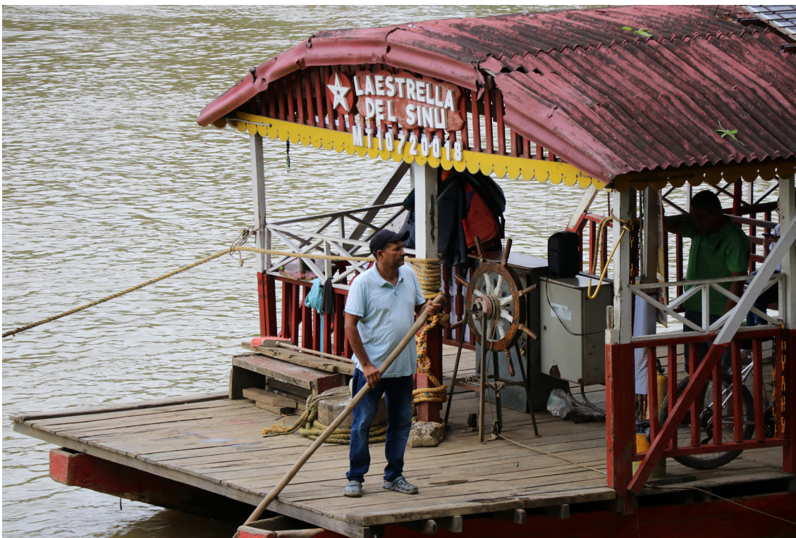
Figura 43. Un medio de transporte sin fecha de expiración.