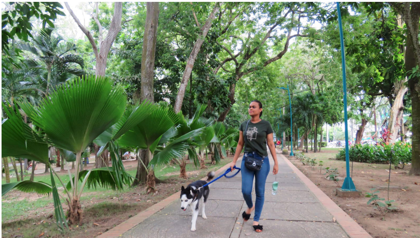
Figura 72. Urbanización de la naturaleza.