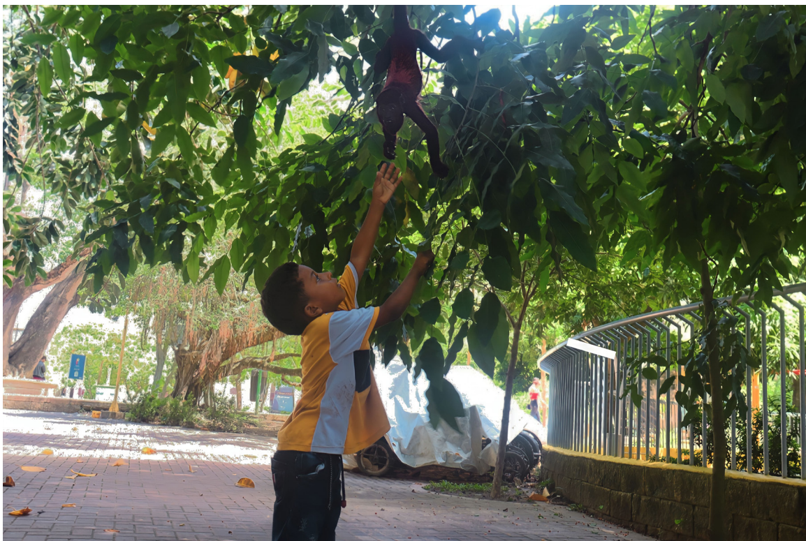
Figura 6. La creación. Ronda del Sinú.