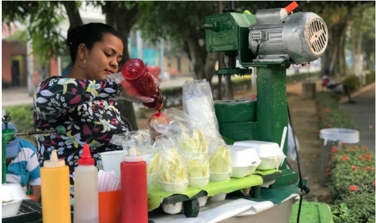
Figura 1. Hielo abrasador: el “raspao” como un antídoto para el calor. Ronda del Sinú (Montería, Córdoba).