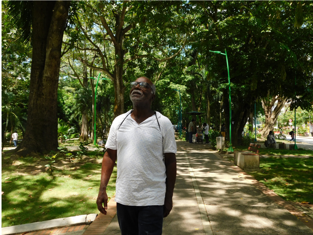
Figura 61. Miradas ciudadanas.