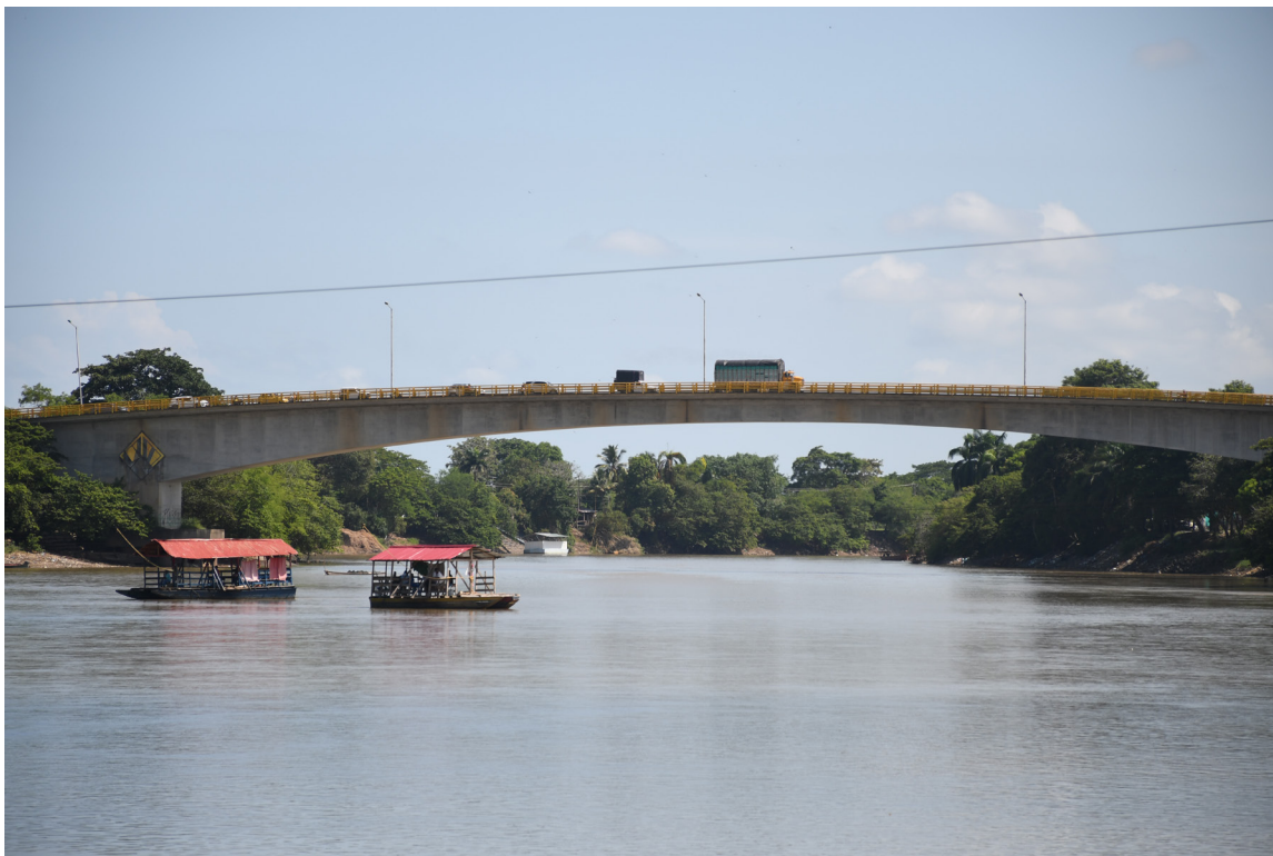
Figura 38. Urbanización del río Sinú.