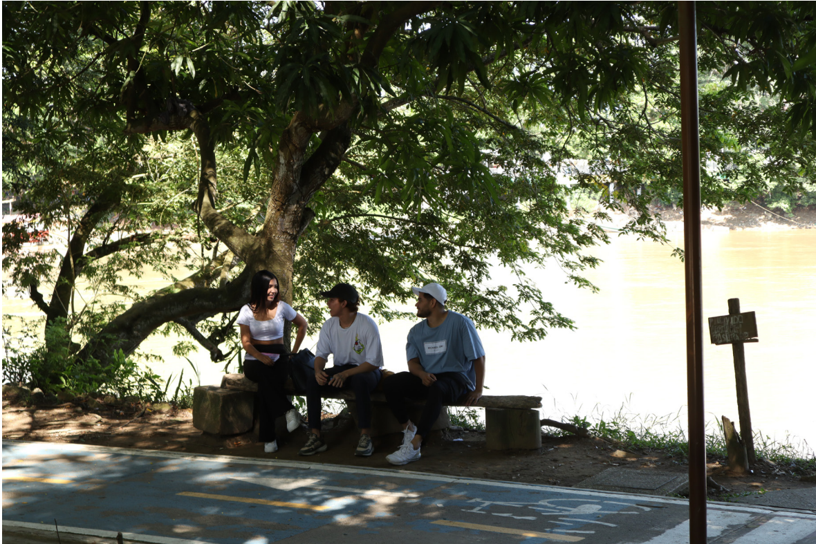
Figura 32. Amistad con el río de fondo.