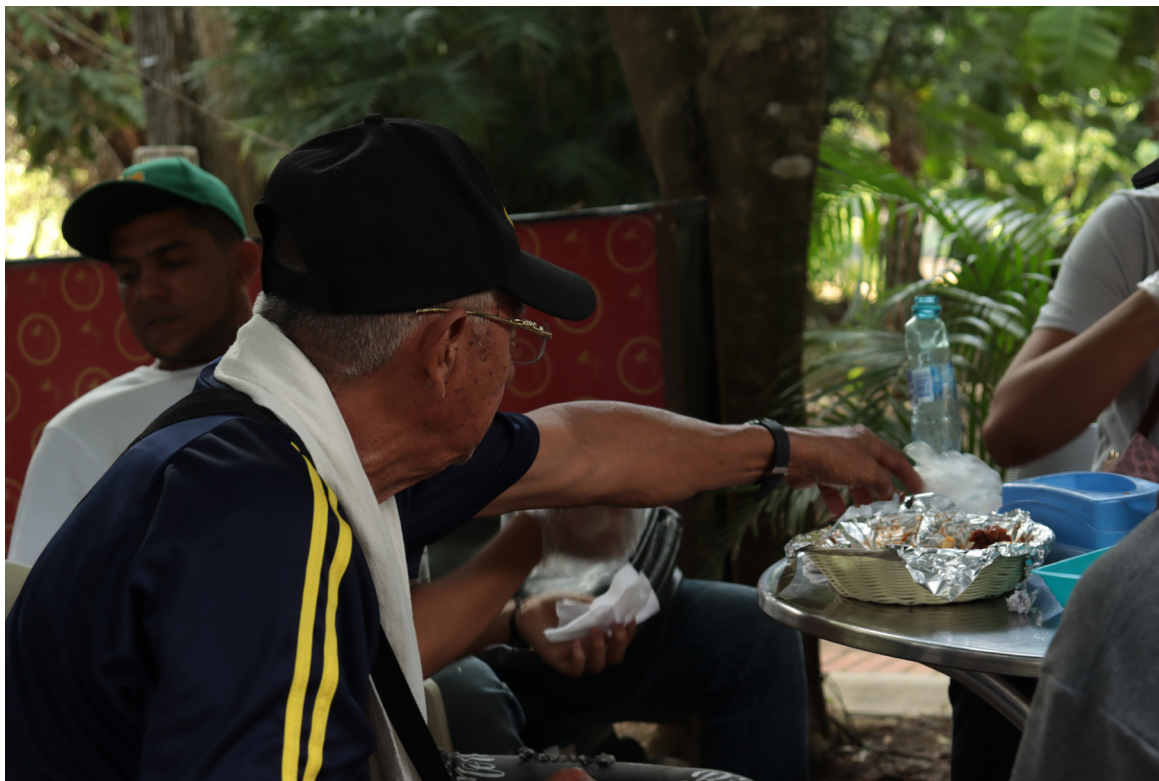
Figura 93. Sabores del río Sinú.