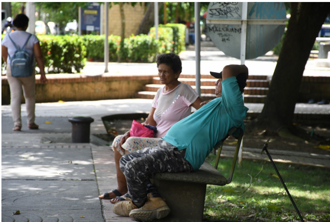
Figura 29. Las parejas y sus rutinas.