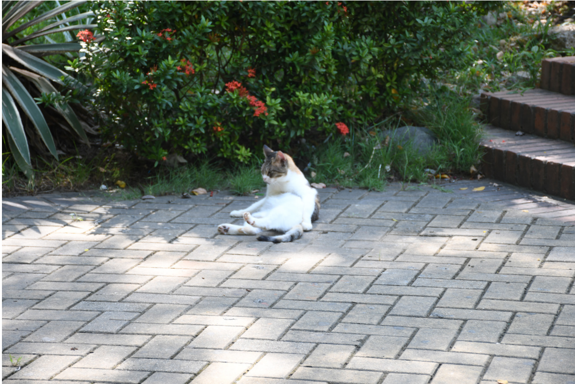
Figura 69. Relax urbano.