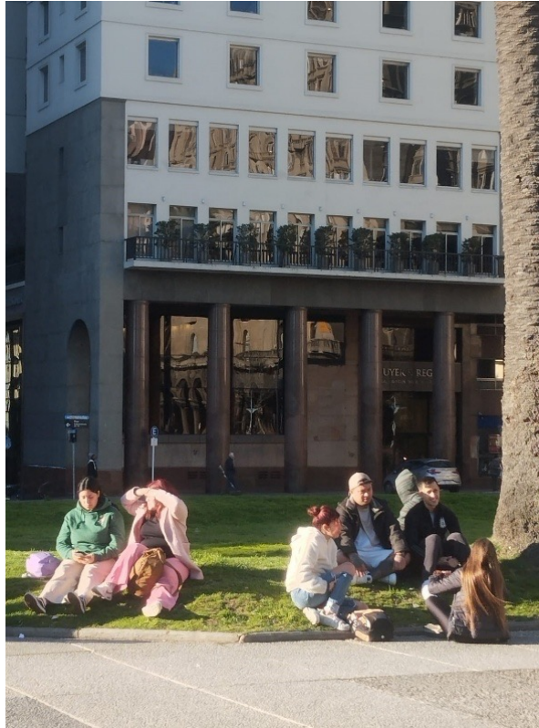
Figura 4. Ver y ser visto en la primavera. Plaza de la Independencia en Montevideo (Uruguay).