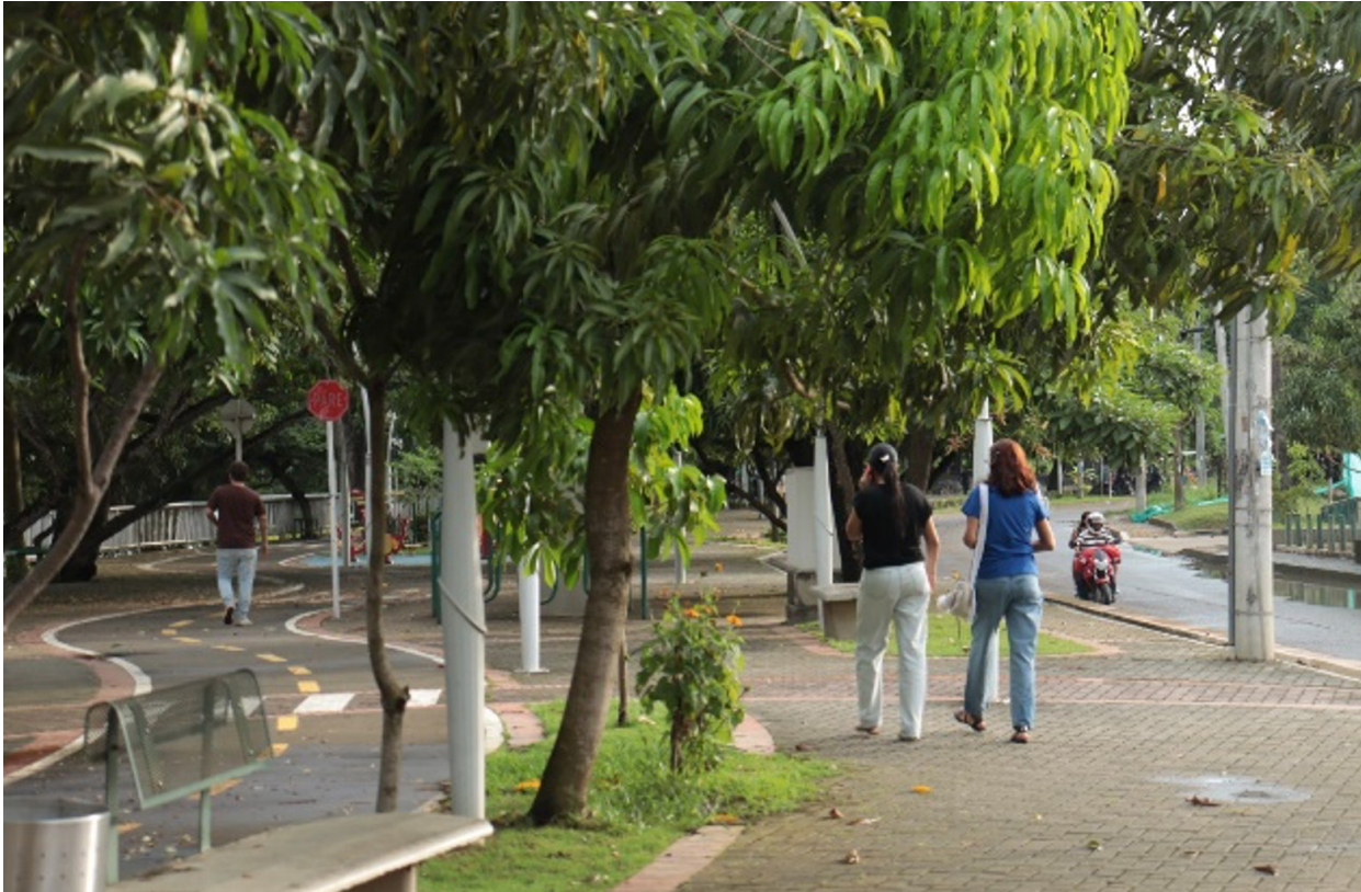
Figura 16. La sinuosidad del río.