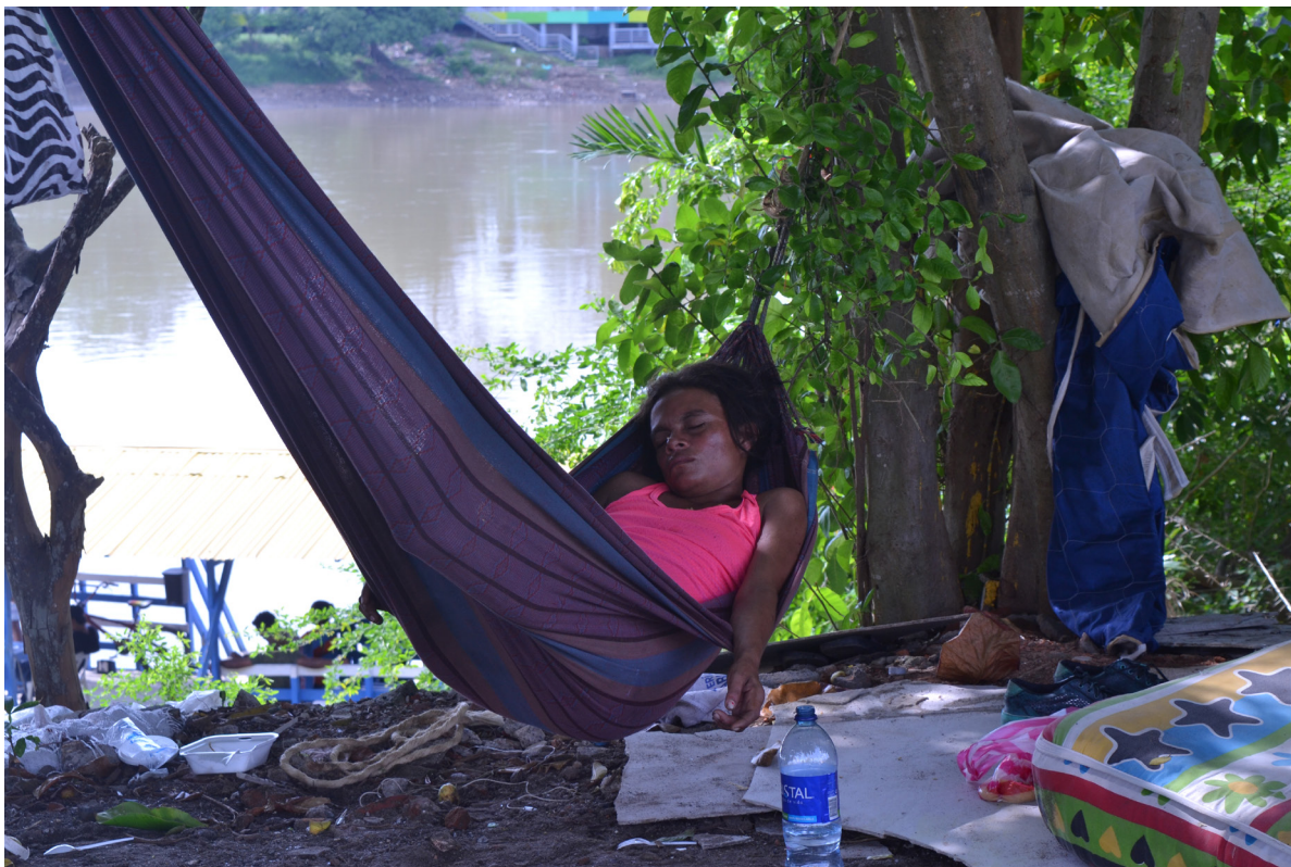
Figura 11. La princesa y el río. Ronda del Sinú (Montería, Córdoba).