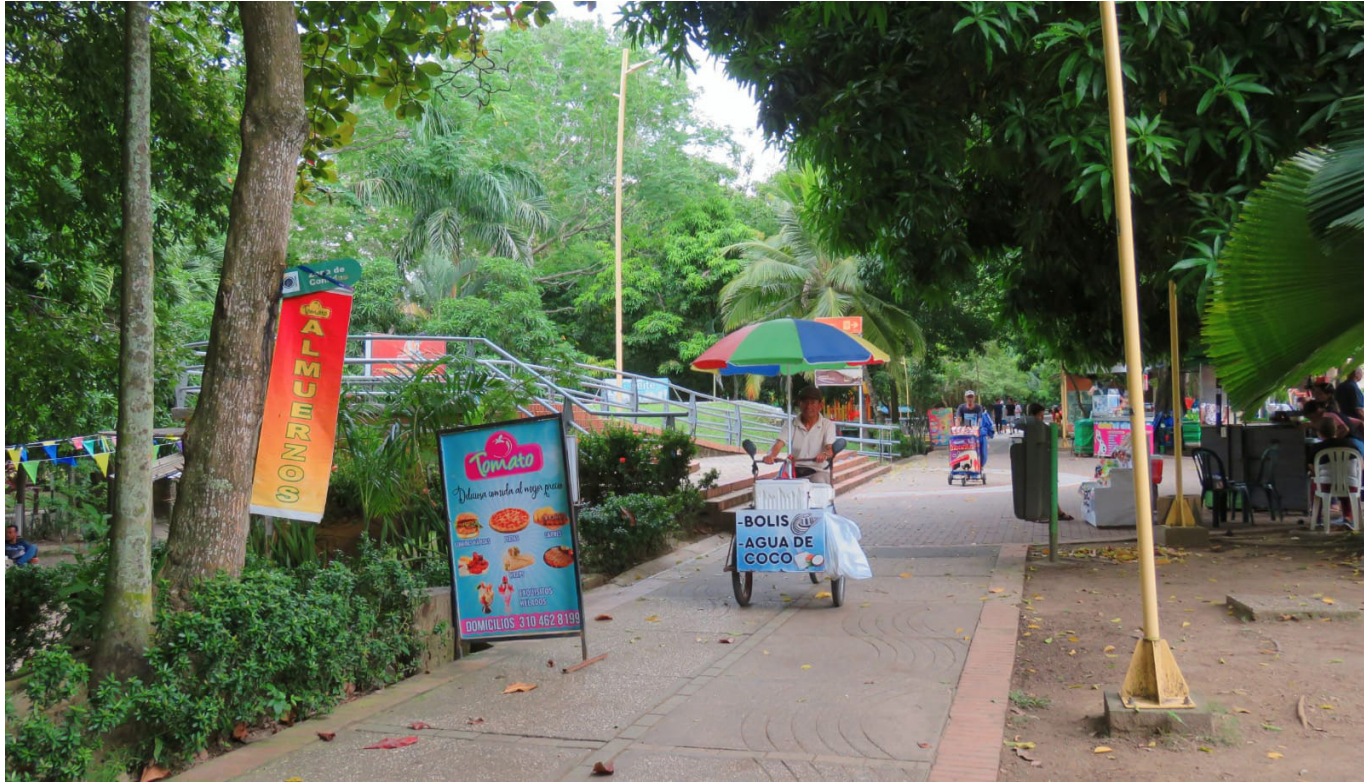
Figura 88. Entre el dulzor y la fresca del coco.