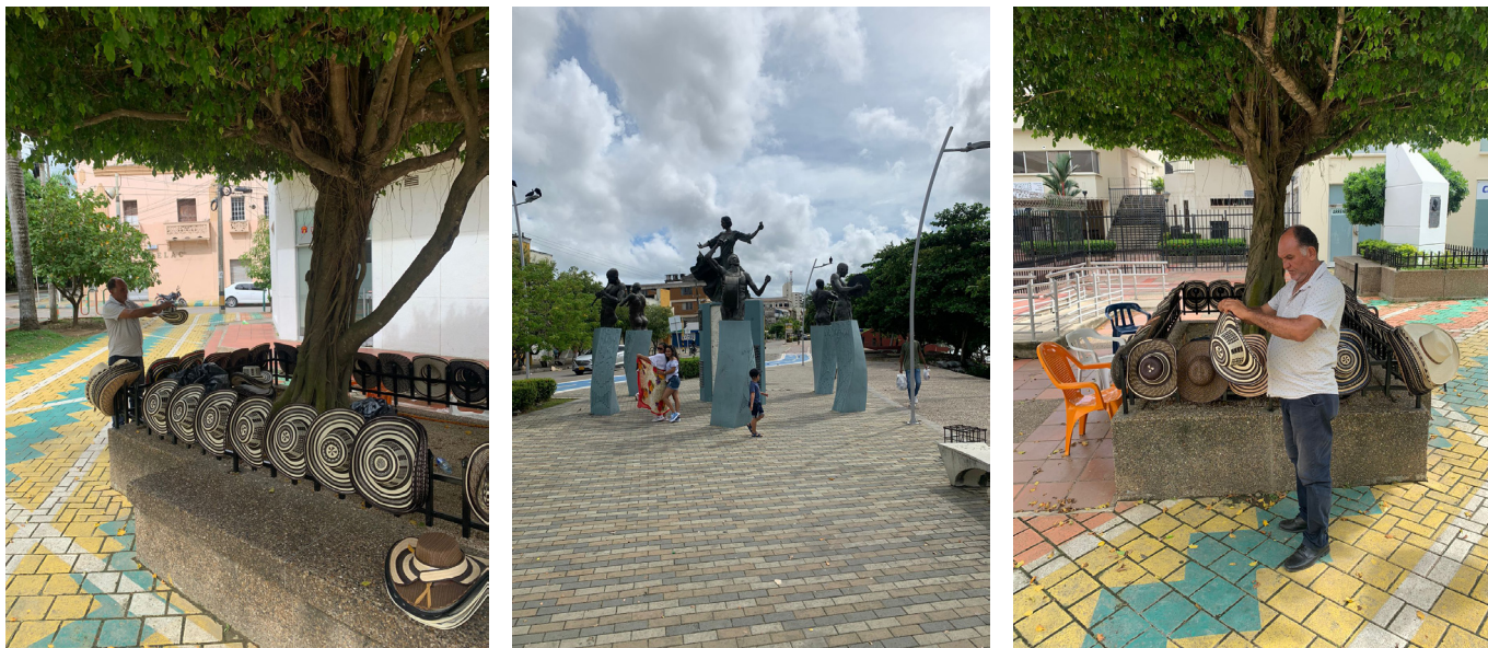
Nota. de izquierda a derecha (a). Texturas ciudadanas; (b). Tejiendo lo urbano; (c). Un porro para el futuro.