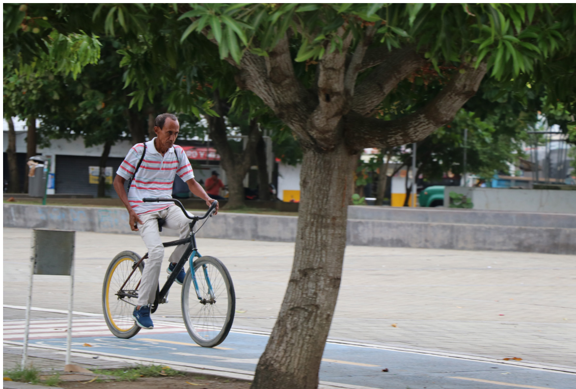
Figura 42. La juventud no tiene edad.