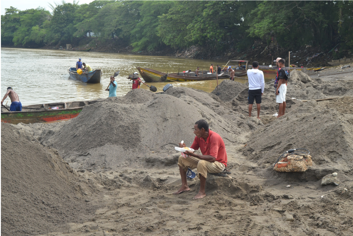
Figura 25. Oficios del río: una pausa para alimentarse.