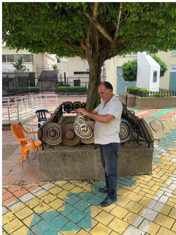
Figura 97. Texturas de la Ronda del Sinú.