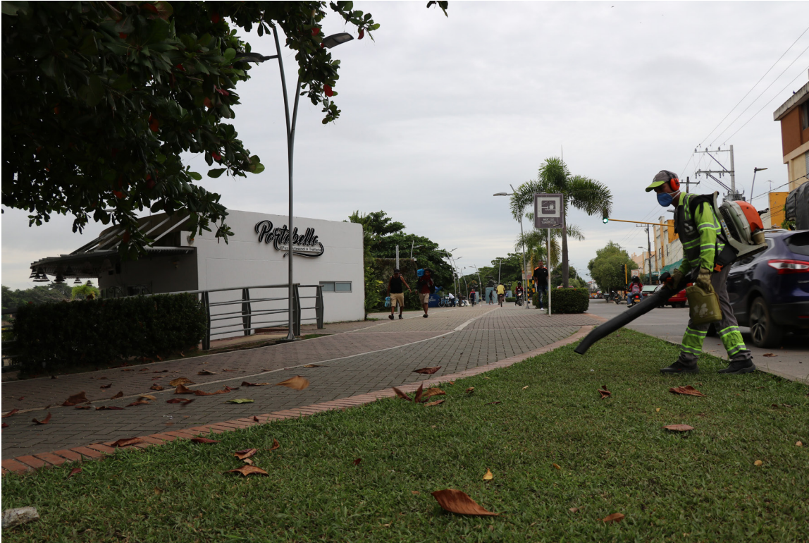
Figura 41. Rutinas de aseo alrededor del río.