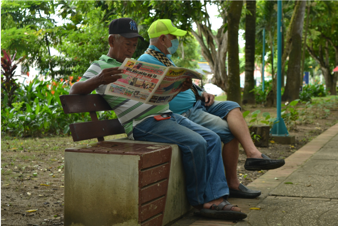
Figura 95. Lectura y contemplación en el parque.

Fuente: Propiedad de Juliana Martínez Vergara.