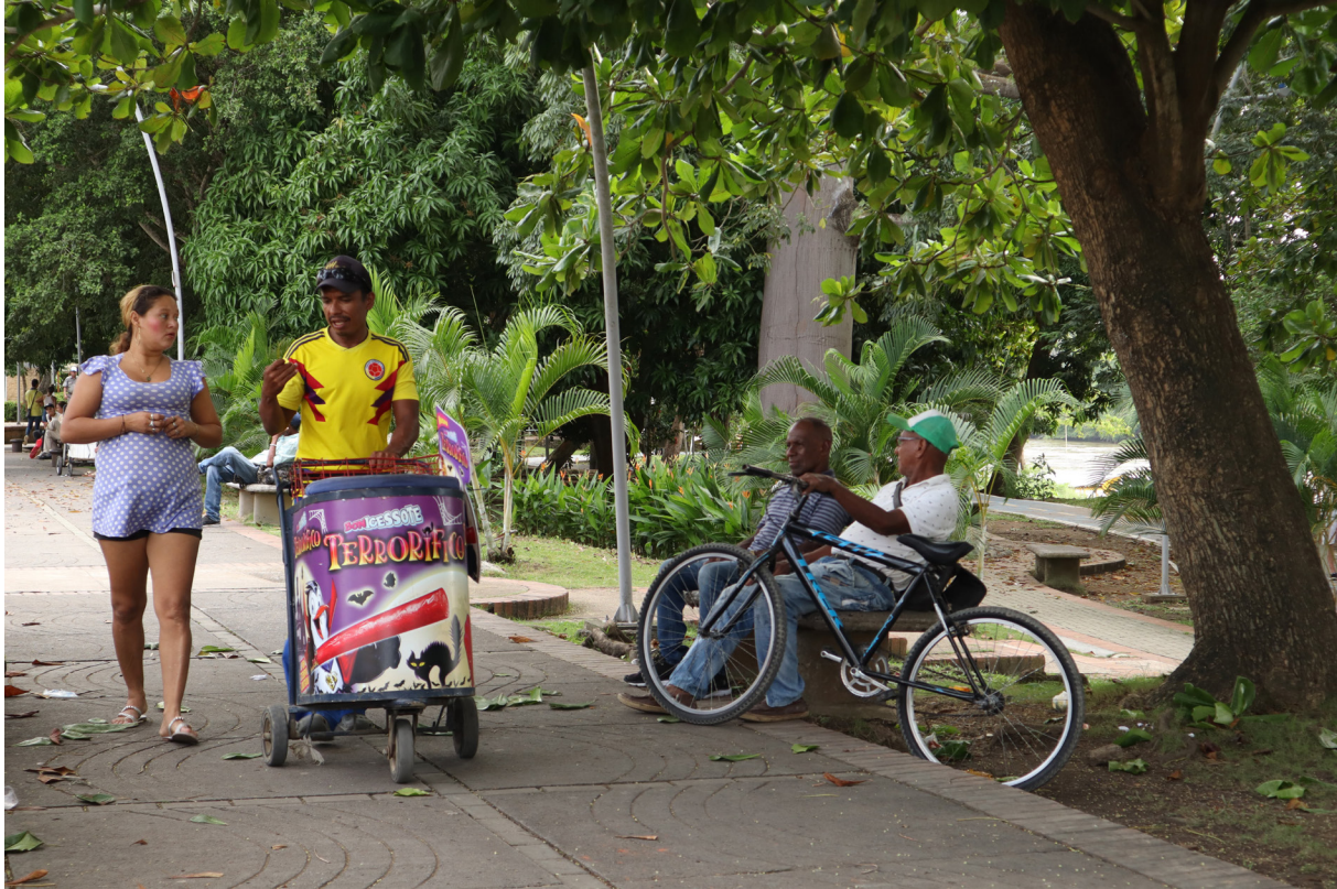
Figura 33. Conversaciones paralelas.