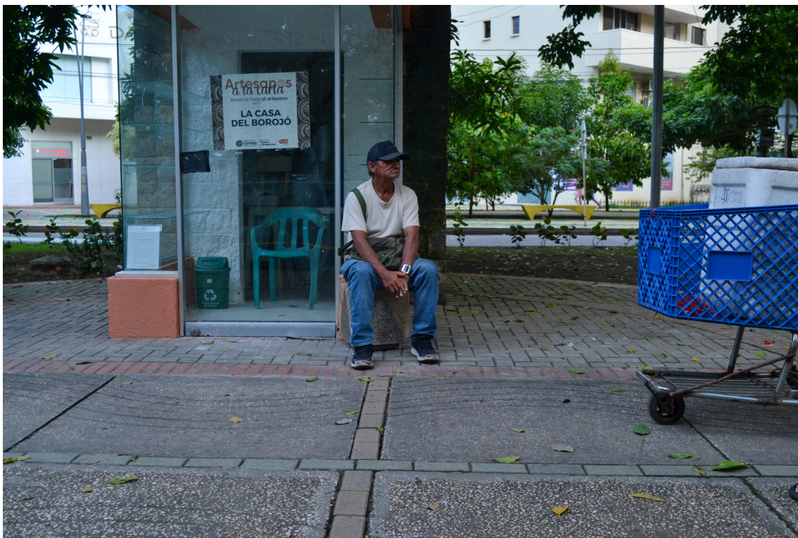
Figura 53. La casa del borojó.