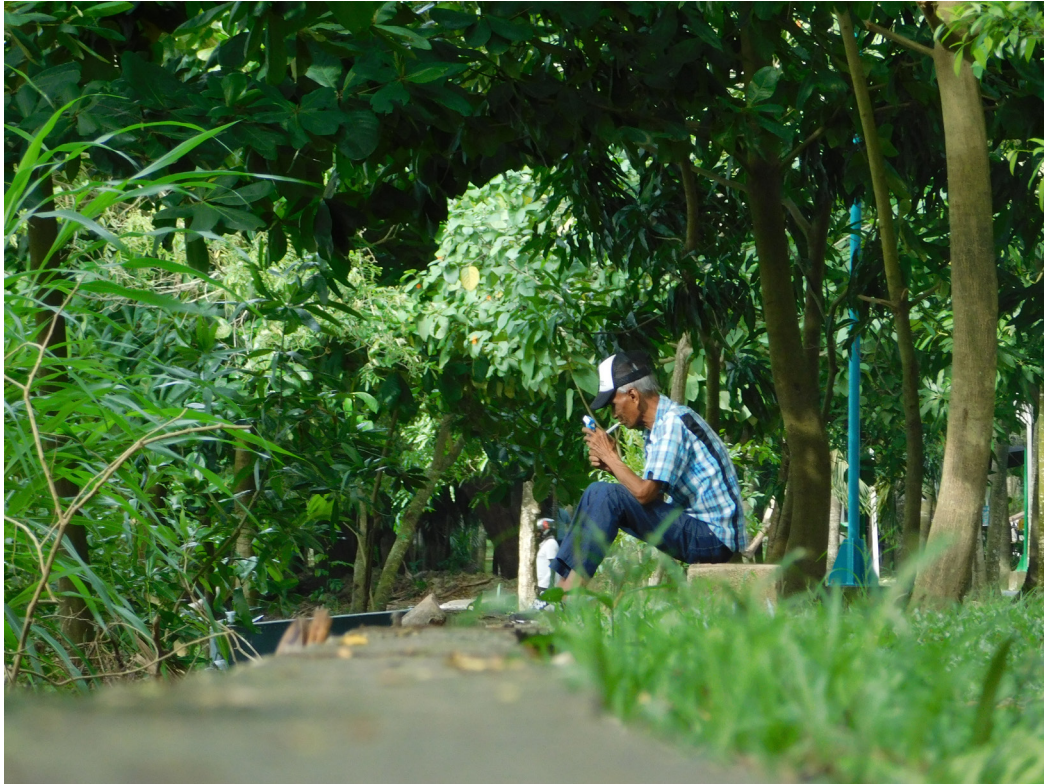
Figura 37. Encender un poco de mí mismo.