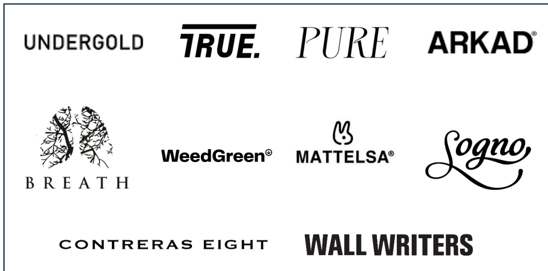
Figura 1. Identificadores visuales de las marcas seleccionadas.

Wall Writers: surgió con fuerza en 2024 y finalmente, ha construido una identidad basada en la cultura del graffiti y el arte urbano. Centrada en la idea de embellecer a algo o alguien.