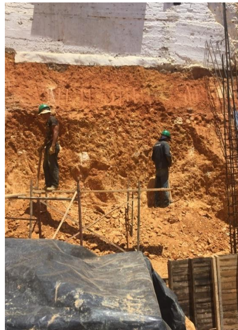
Figura 11. Excavación manual parte posterior del lote.