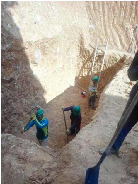
Figura 43. Excavación y perfilado para el tanque de almacenamiento.

Se realiza primero la excavación a máquina retirando los volúmenes de tierra más grandes. Las excavaciones manuales deberán hacerse de tal forma que las superficies excavadas que se obtengan sean lisas y firmes, ajustadas a las dimensiones requeridas (figura 43). Se deben utilizar entibados para terrenos inestables o fangosos y/o cuando las excavaciones se deban profundizar más allá de las profundidades consideradas como seguras en los estudios de suelos del proyecto o según lo indique el asesor en geotecnia de la obra. [8]