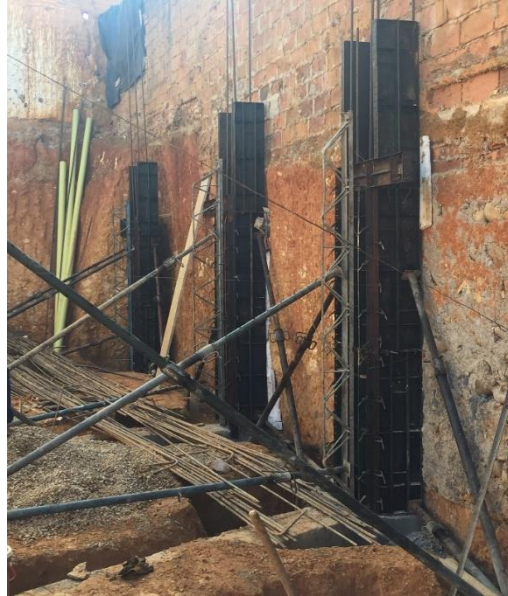
Figura 30. Formaleta de columnas nivel 2.75.

preferiblemente con bomba para concreto. En la figura 31 se observa el desencofrado de las columnas del sótano. [7]