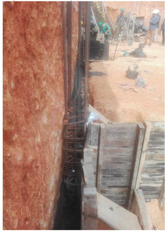
Figura 23. Fundida de vigas de cimentación.