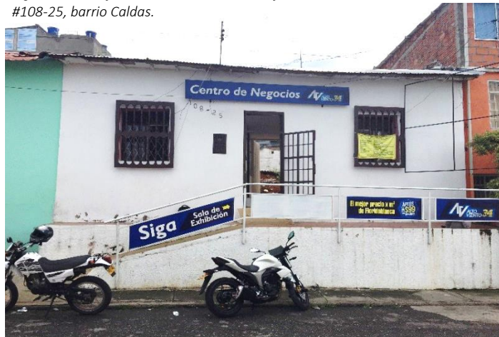
Figura 1. Vista frontal de la vivienda multifamiliar ubicada en la carrera 34 #108-25, barrio Caldas.

La construcción del proyecto Alto Viento dio inicio con la demolición de una casa construida en tapia que era utilizada como vivienda multifamiliar, en la figura 1 se observa la fachada principal de la vivienda. Empezó con desmontar la cubierta de zinc y demoler los muros internos construidos en tapia, seguidamente se retiraron las ventanas y puertas metálicas con el fin de darle algún uso en el futuro. Las acometidas de servicios públicos fueron suspendidas temporalmente por personal autorizado (figura 2) ya que para la demolición y excavación eran de gran riesgo e incomodidad.