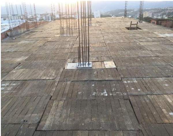
Figura 40. Armado de plataforma.

El proceso constructivo de estas placas es el mismo explicado anteriormente. Por lo cual se anexan fotografías. En la figura 40 se observa la terminación de la postura de la plataforma. En la figura 41 se observa la placa lista para fundir y en la imagen 42 se observa el inicio de la fundida con bomba.