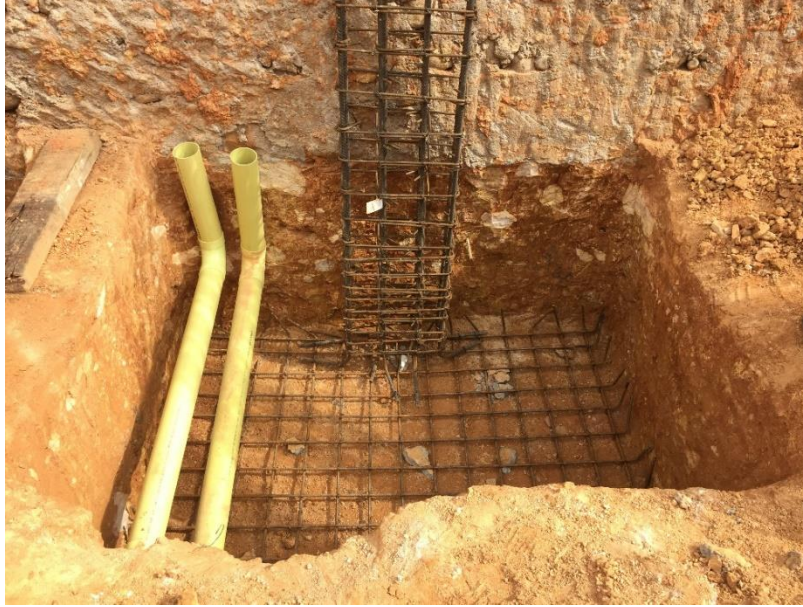
Figura 18. Posicionamiento de columnas, esta se amarra a la parrilla de la zapata.