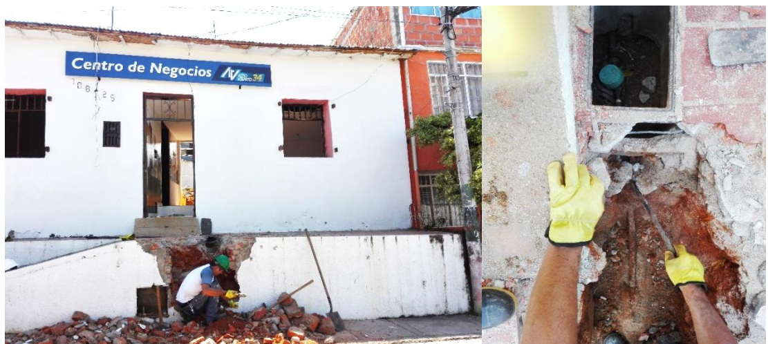
Figura 2: Suspensión temporal de las acometidas de los servicios públicos por el personal autorizado.