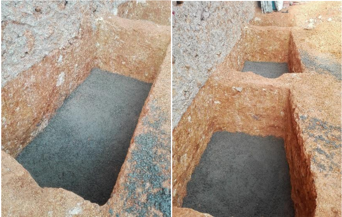
Figura 15. Solados de zapatas y vigas de cimentación.

Para darle protección al acero y al mismo concreto contra la contaminación de partículas arcillosas se funden solados en la superficie inferior de los elementos que estén en contacto directo con el suelo de un espesor de 5cm como se muestra en la figura 15