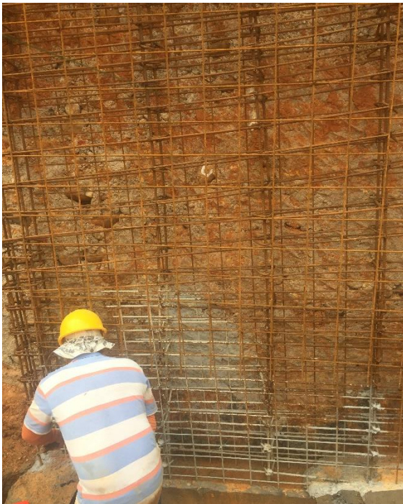
Figura 32. Armado de pantalla P1 nivel 2.75.

El desarrollo de esta actividad es similar al de las columnas, en las figuras 32 y 33 observamos el armado del acero. Su fundida se realiza monolíticamente; por tanto, la supervisión del aplomado de las formaletas debe ser de alto cuidado (figura 34). Las pantallas por lo general están conformadas por una especie de columnas que van en sus extremos y un cuerpo en el centro similar a un muro de contención. En los extremos se posicionan estribos de diámetro 3/8". El cuerpo de la pantalla está provisto por mallas electro soldadas, una a cada lado. Debido que posee espesores estrechos (20cm) se debe priorizar la buena vibración del concreto y la aplicación de un adecuado asentamiento. El vibrado se hace con un vibrador a gasolina y con golpes laterales en la formaleta. Se recomienda bastante vibrado en las esquinas de las formaletas. En el asentamiento se debe garantizar que el concreto tenga una fluidez que permita un vaciado rápido para que su terminado final sea fino (figura 35). [7]