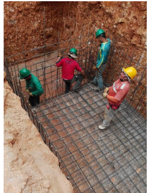
Figura 44. Armado de acero tanque de almacenamiento.