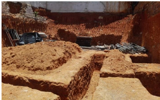
Figura 14. Excavación manual de vigas de amarre y enlace.

Los oficiales y ayudantes se guían mediante una cuerda de color que indica el eje para conocer el ancho real de la viga. También el uso de plomadas certifica la completa verticalidad del elemento. En cuestiones de cotas y profundidades se realiza mediante niveles trazados por los Oficiales o el Maestro de obra. En la figura 14 se observa la excavación de las vigas de amarre y de enlace.