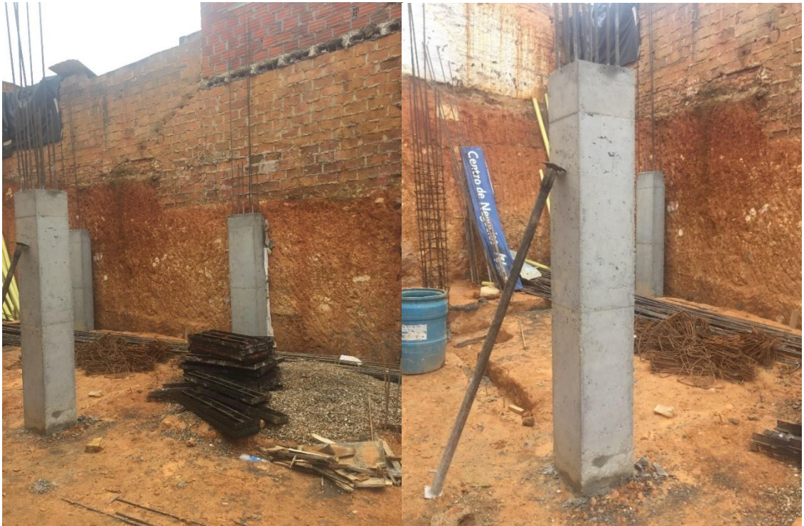
Figura 31. Desencofrado columnas sótano (Nivel 2.75).