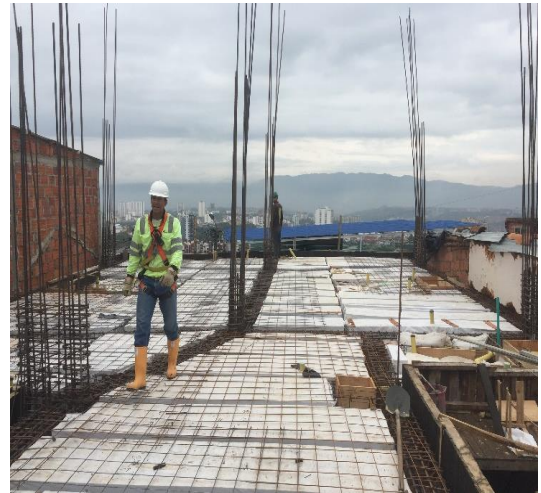
Figura 41. Postura de casetón y malla.