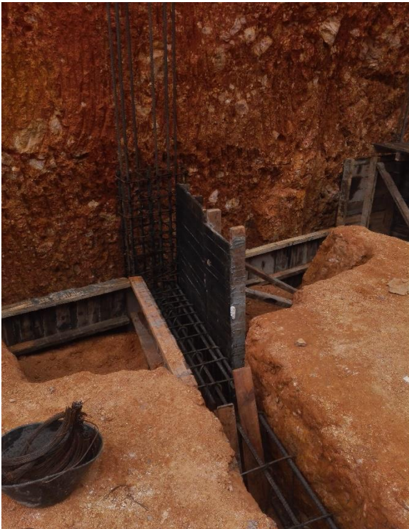
Figura 22. Formaleta para vigas de cimentación.

Las dos inspecciones primordiales de una viga de concreto son las características del acero y las dimensiones de la formaleta. Como estas vigas están conformadas en el suelo, su encofrado puede ser dimensionado por el terreno mismo. Por tanto, el perfilado de la excavación debe ser preciso para evitar cualquier desperdicio de concreto. La única ocasión que se requirió formaleta era en las zapatas pues las vigas sobresalen del nivel de la misma (figura 22 y 23). En el tema del acero lo primero que se debe verificar es la fundida del solado y la limpieza de las superficies de contacto con el acero. En este caso a pesar de brindar los solados las lluvias arrastraron materiales dañinos, especialmente arcillas. Luego la inspección se centra en la cantidad de varillas con su debido calibre, la presencia o no presencia de ganchos, distanciamiento de estribos y longitudes de desarrollo estipulados por los planos estructurales. Luego se inicia la fundida y se prosigue a desencofrar (figura 24 y 25) [5]