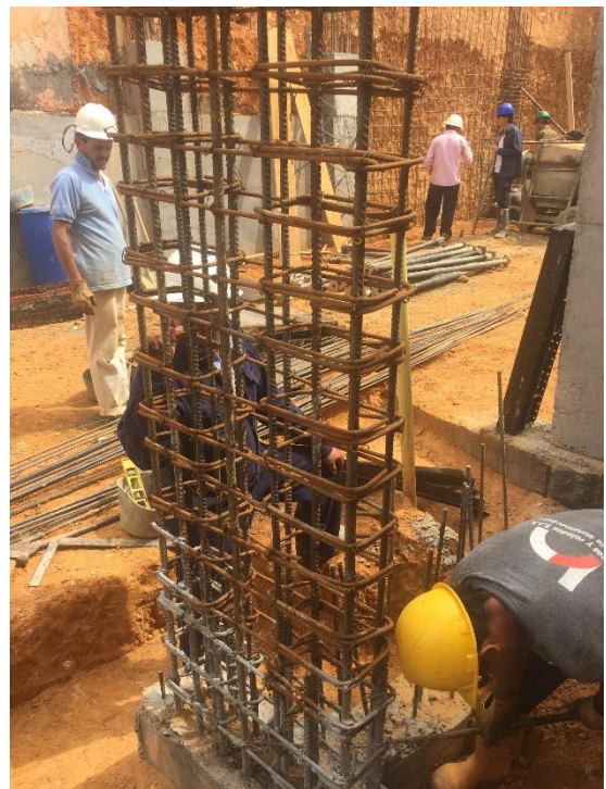
Figura 33. Armado de pantalla P2 nivel 2.75.