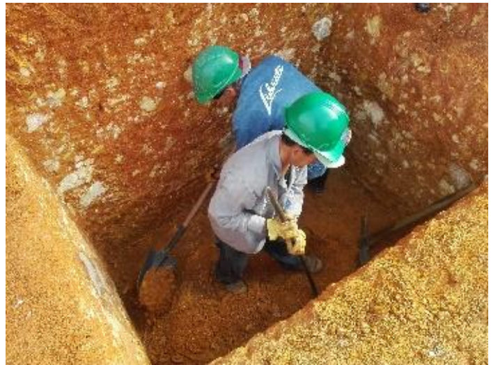
Figura 13. Excavación manual a una profundidad de 1.5 metros.