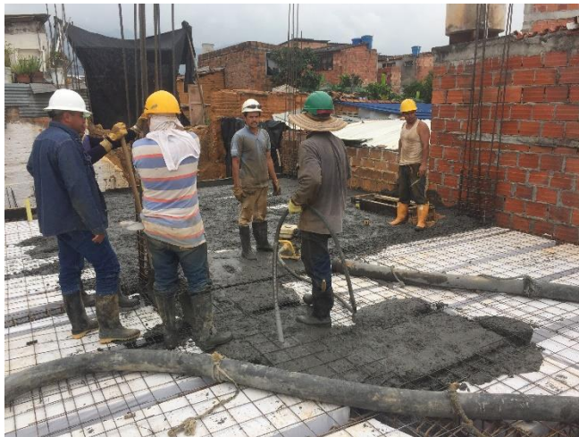
Figura 42. Inicio de fundida.