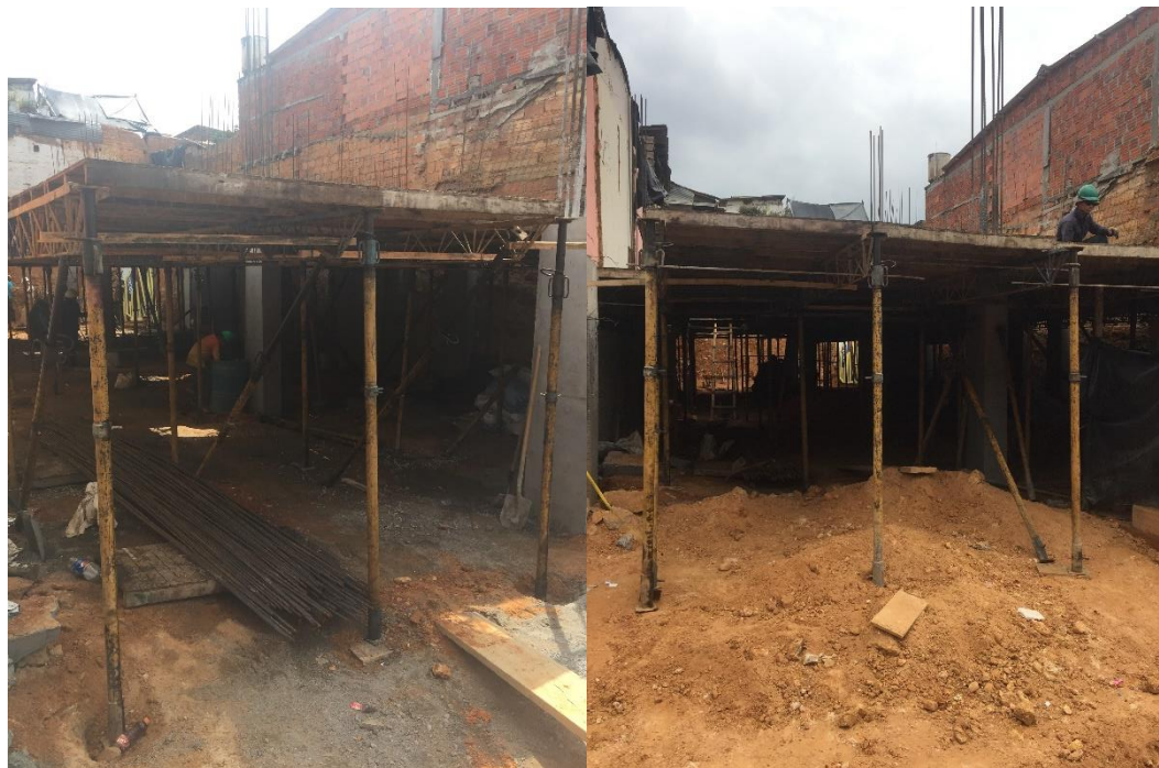
Figura 36. Armado de plataforma.

El armado de la placa es un proceso delicado de la obra. Esta está constituida por párales, cerchas, correas y formaletas (figura 36). Los párales son los elementos que reciben toda la carga de soporte; sus dos tubos permiten variar la altura de la placa. Estos soportan los nodos de la cerchas. Su posicionamiento vertical, lógicamente sirve para soportar los pesos aplicados, su posicionamiento inclinado funciona para contrarrestar los efectos del viento y las fuerzas horizontales. Las cerchas soportan las formaletas, algo similar a una viga estructural. Las correas son varillas o listones de madera que están amarradas horizontalmente entre las cerchas, su función consiste en rigidizar la estructura de la formaleta de la placa. Por último, las formaletas son de madera y también se usan tablas para sellar pequeñas brechas