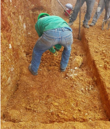
Figura 12. Inicio de excavación manual de zapatas.

(figura 12 y 13). La comisión topográfica señala mediante ejes cual es la ubicación respectiva para cada zapata.