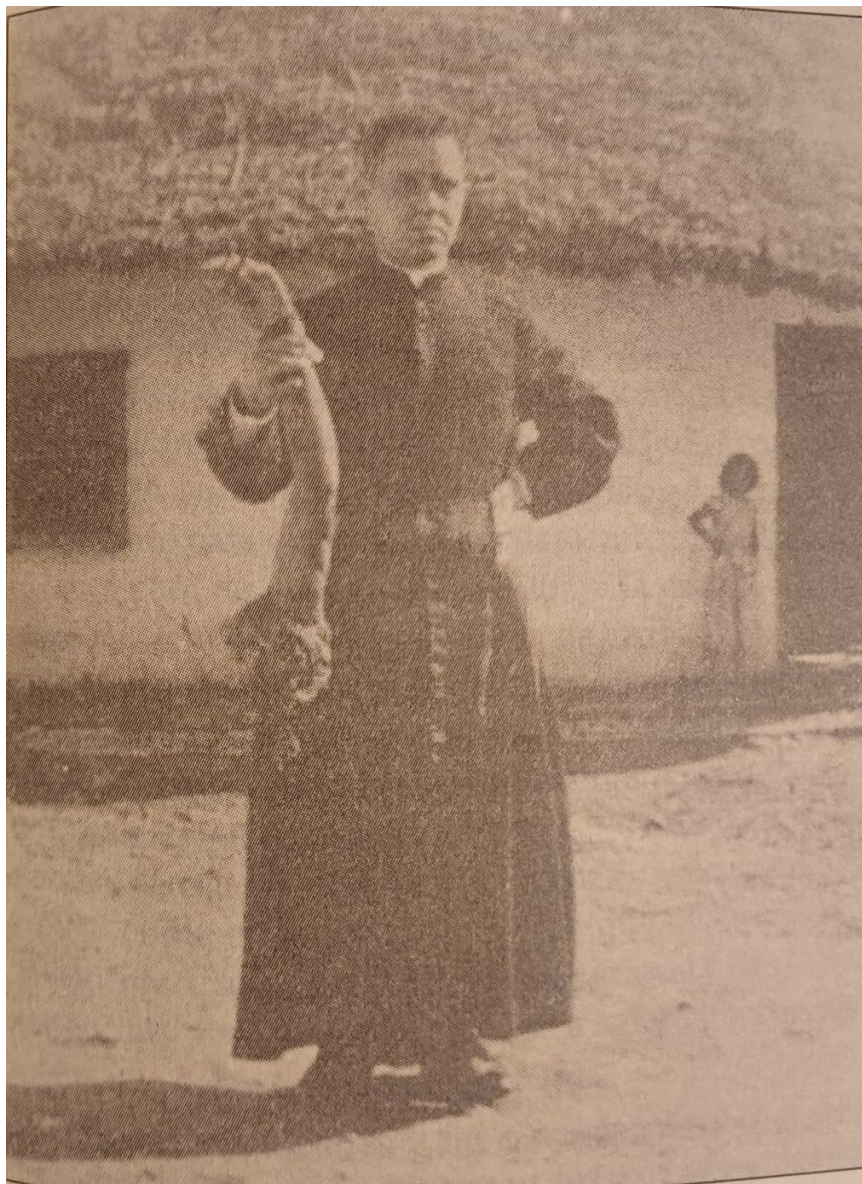
Imagen 3.: Sacerdote sosteniendo un brazo mutilado. 204

peligro; o le traían un cadáver despedazado...”. 203 Siendo el sacerdote una figura clave para el progreso y la vida tranquila en comunidad, los guerrilleros exigían el derecho a practicar el catolicismo.