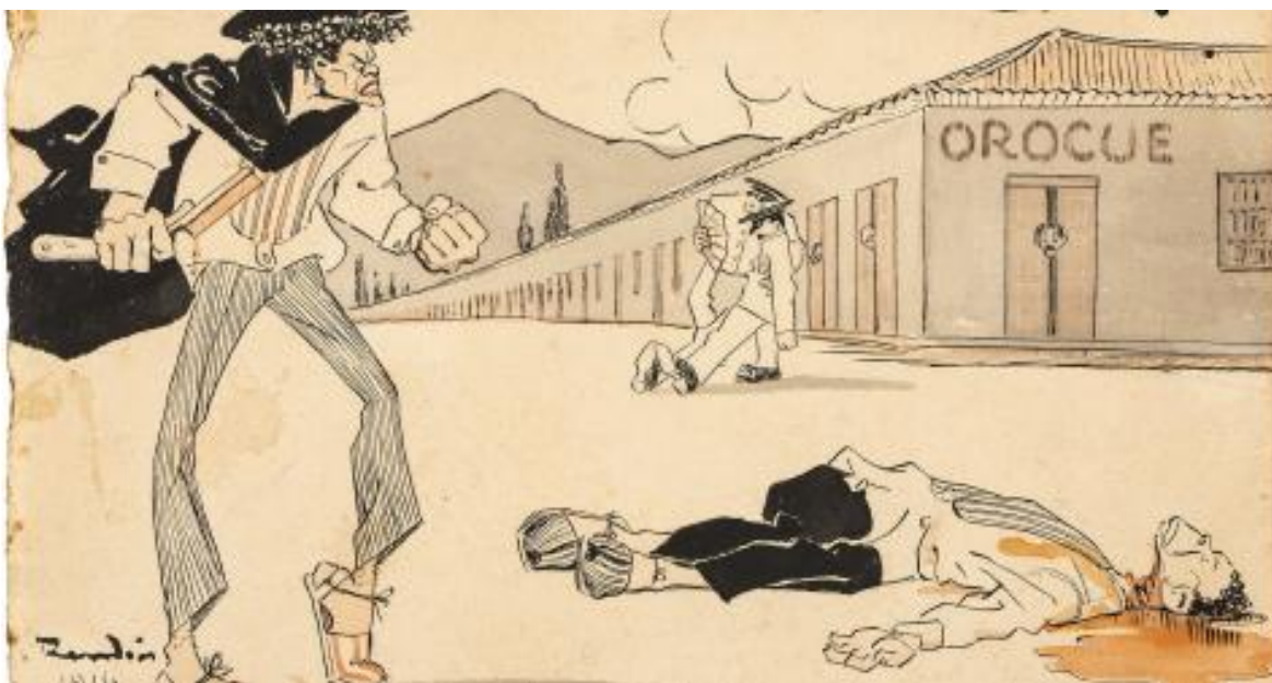
Imagen 2.: Corte de franela. 164

La violencia en el país no es un fenómeno aislado, sino una cadena continua donde cada acto brutal se enlaza con el siguiente, las muertes violentas no son episodios esporádicos, sino un problema coyuntural. Se trata de un hilo histórico-cultural, pues los cortes sobre los cuerpos son reiterativos de una tradición de contenidos simbólicos de violencias pasadas, e incluso sobreviven hasta ahora.