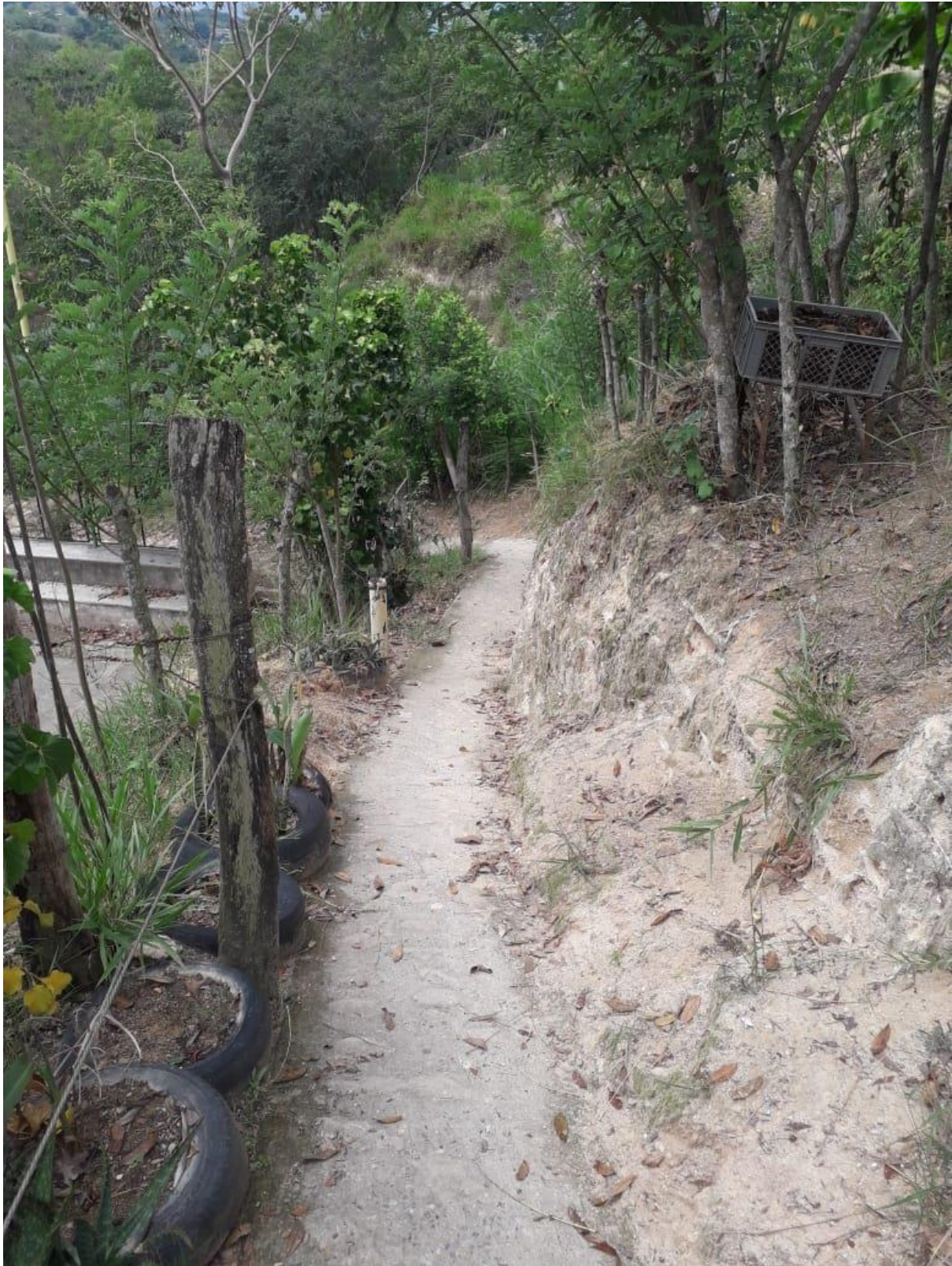
(Acceso alternativo a la escuela)