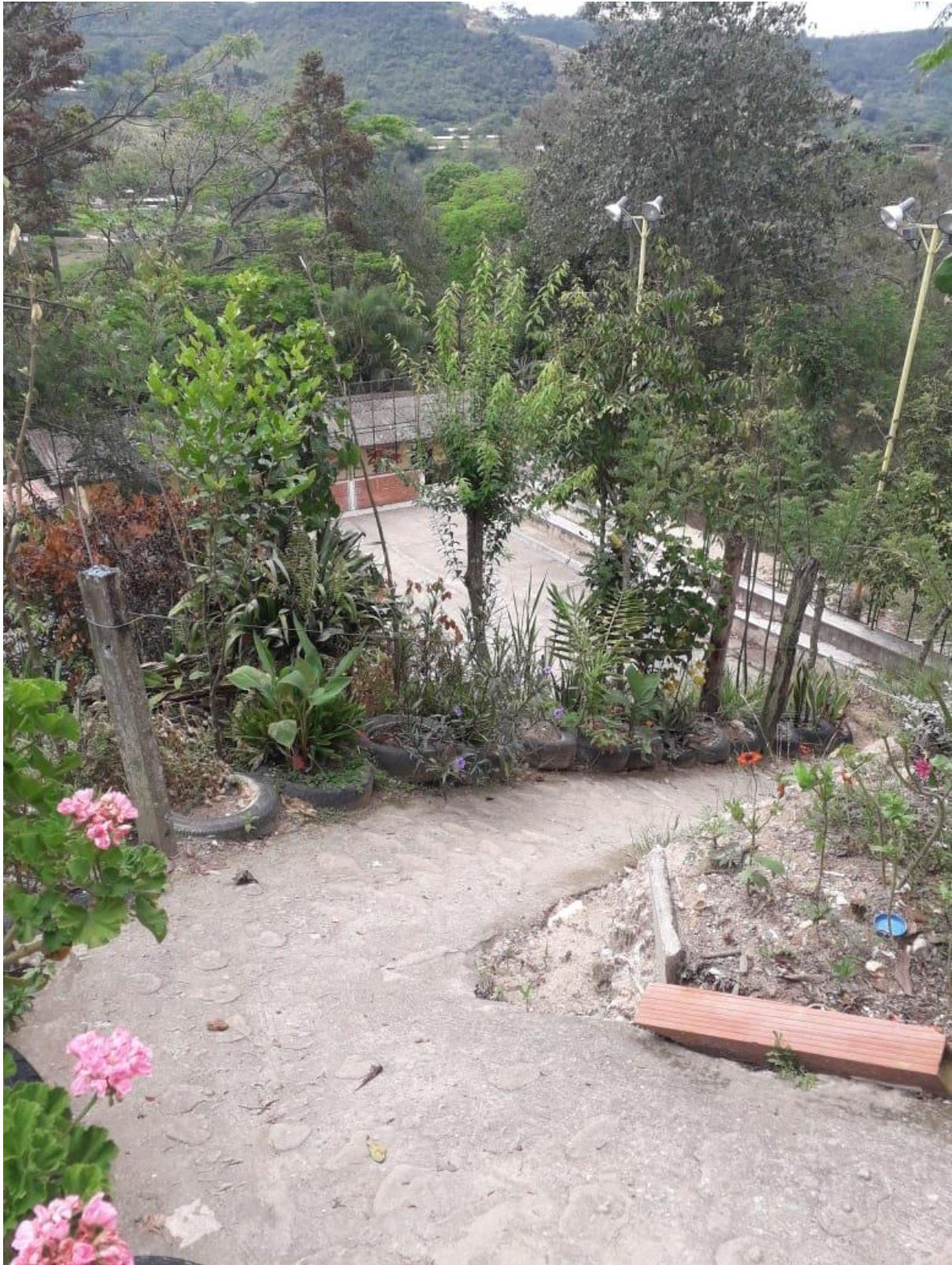
(Acceso alternativo a la escuela)