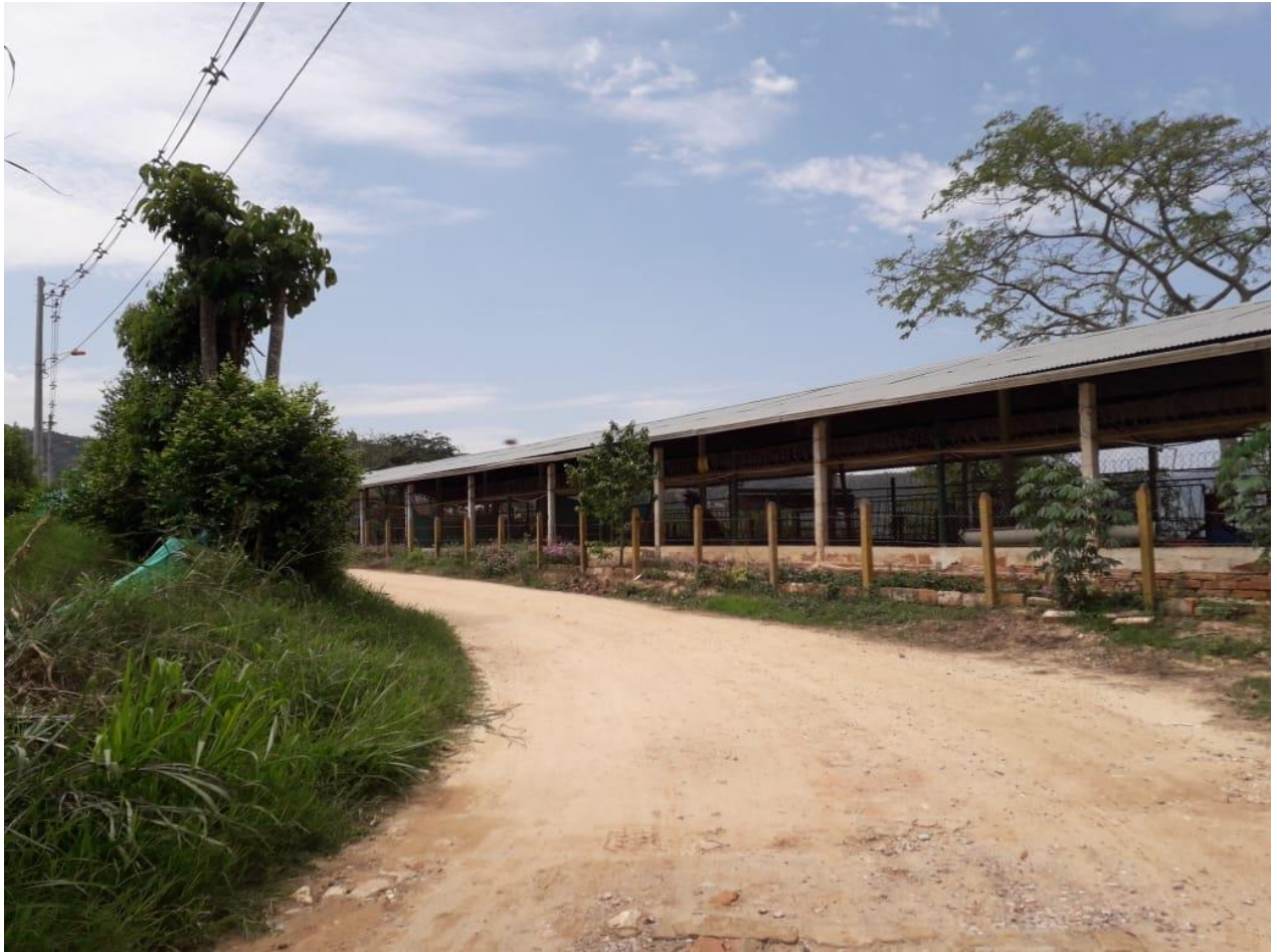
(Aprisco – Sector ganadero de la zona)