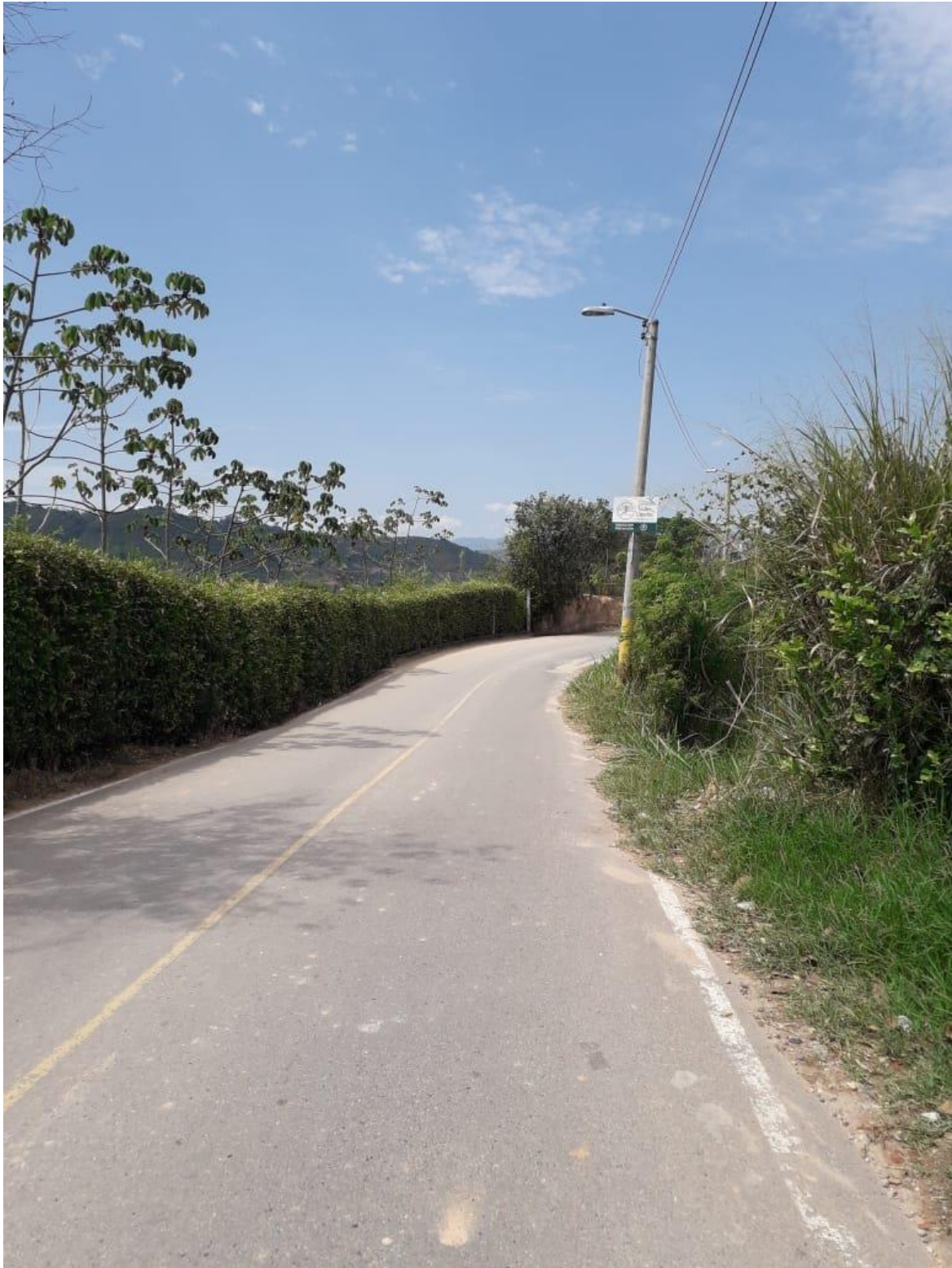
(Entrada desde la parada de bus a la vereda)