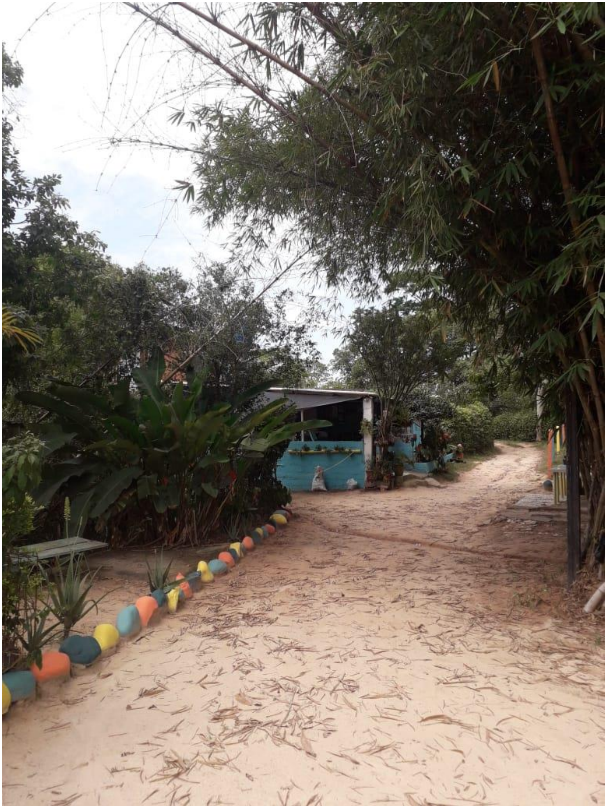
(Sendero veredal – El Pílon)