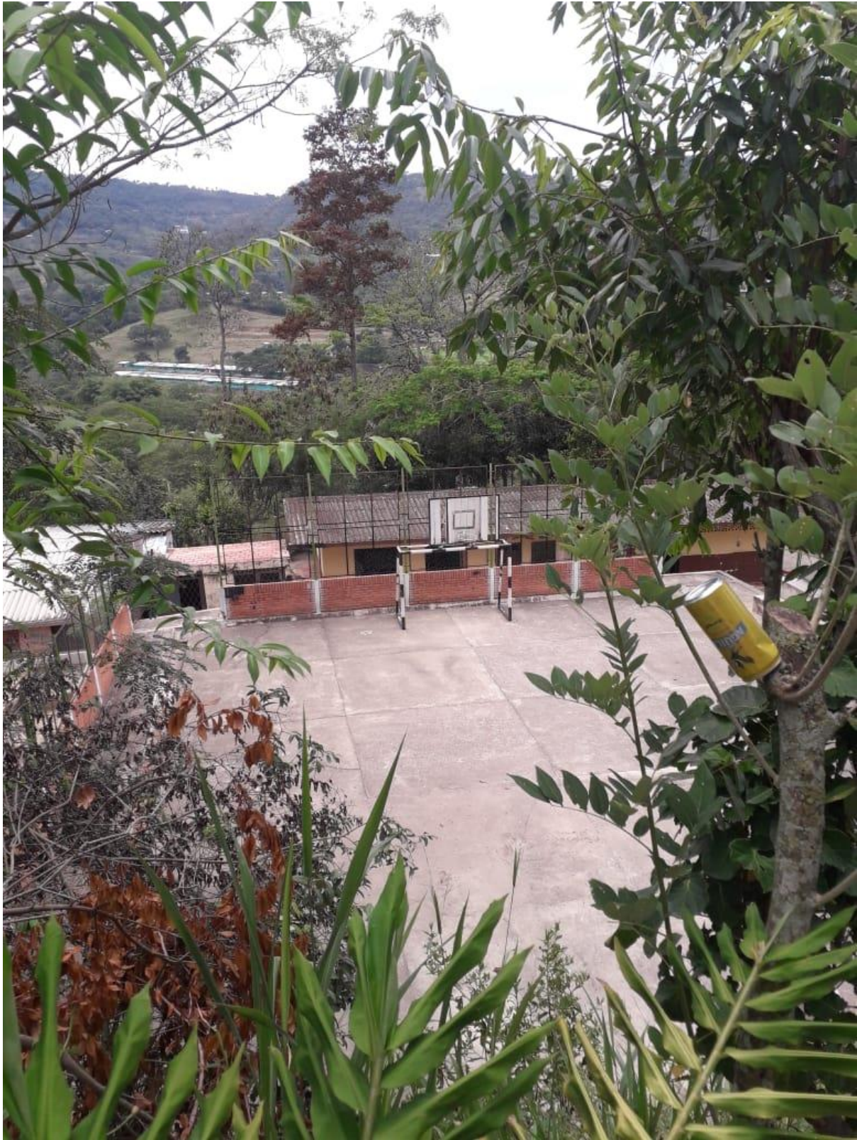
(Vista, cancha de la escuela)