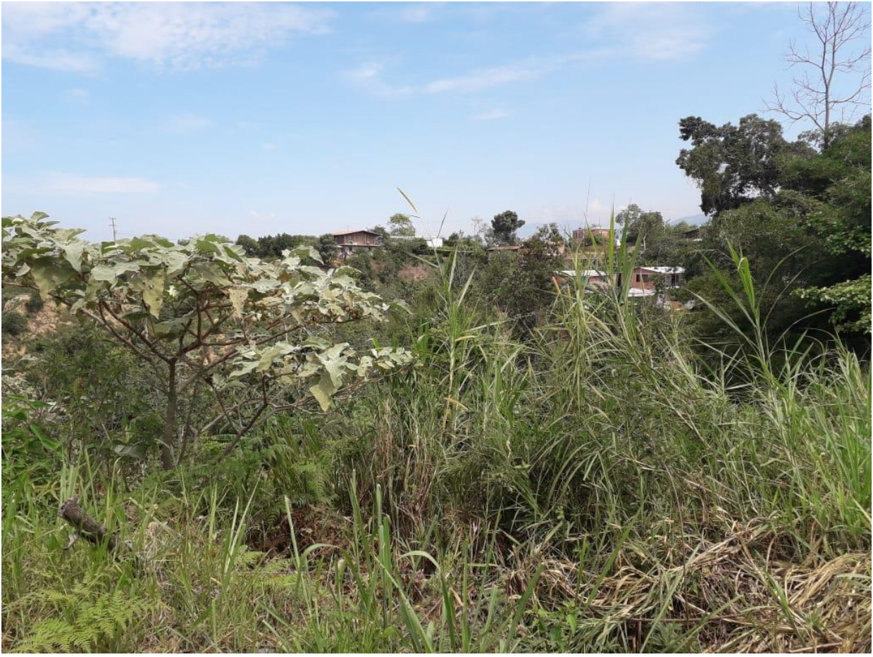
(Vegetación característica de la zona)