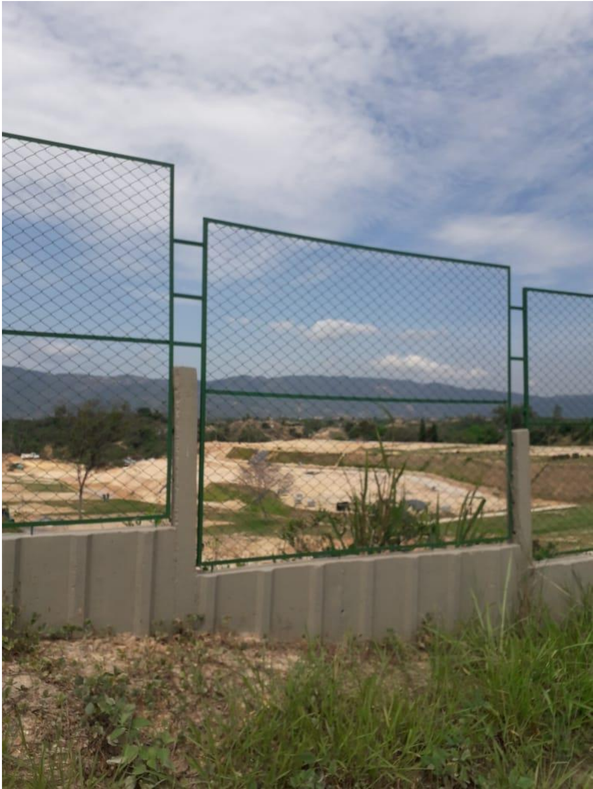
(Construcciones alrededor de la vereda)