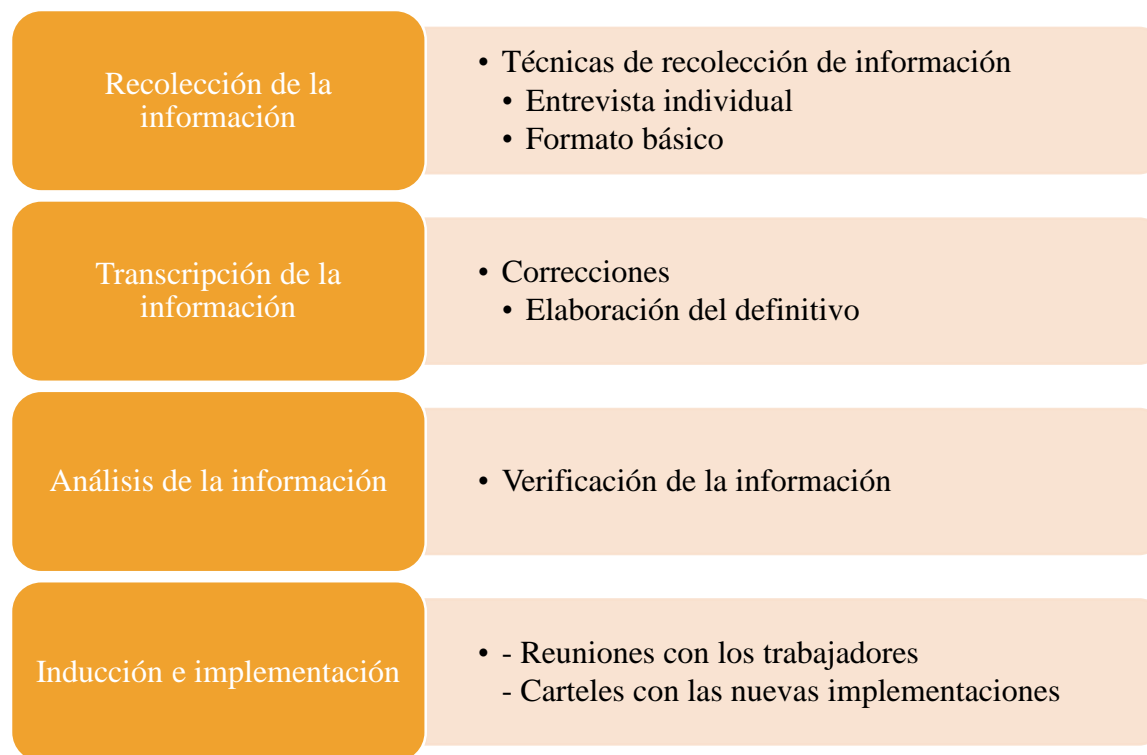
Figura II. Metodología a implementar.

A continuación, se presentan los diferentes procesos que se van a llevar a cabo para las diferentes etapas planteadas.