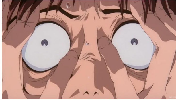
Figura 10. The End of Evangelion , 1997.

Aquí se muestra un claro ejemplo de gestos y expresiones altamente detallados (fig. 10): un primerísimo primer plano de Shinji revela una expresión de intenso terror o shock. Sus ojos están muy abiertos y las pupilas dilatadas; las manos aparecen ligeramente flexionadas, como si intentara protegerse o aferrarse a algo. La piel luce tensa y cubierta de gotas de sudor, lo que evidencia el estado de estrés extremo del personaje. Además, se pueden observar líneas muy marcadas en su rostro, lo que aporta mayor detalle a su expresión de pánico.