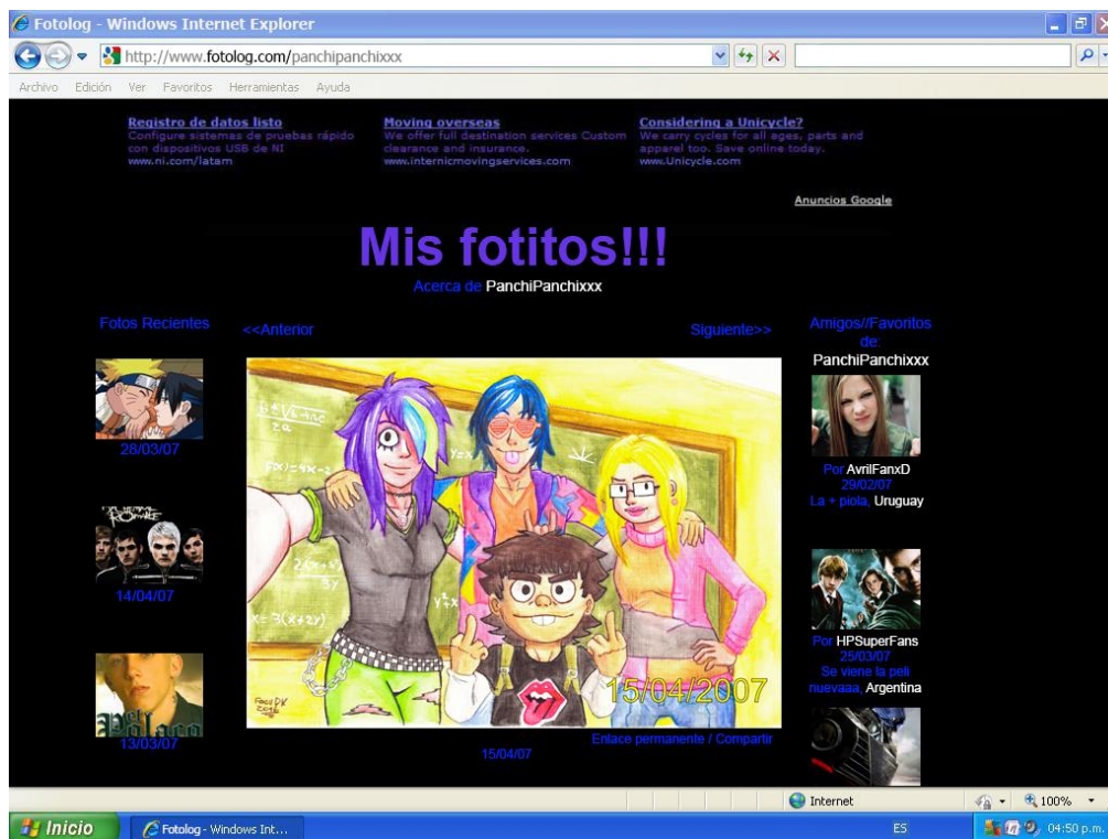
Figura 7. Ejemplo de Fotolog.