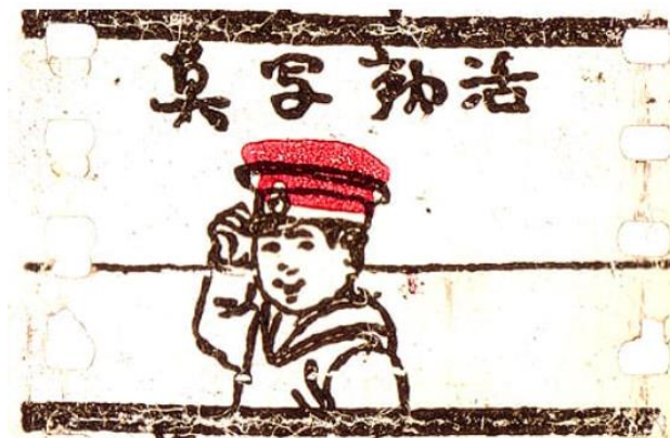
Figura 1. Imagen fragmento de Matsumoto de 1907.

Para empezar a hablar del origen del anime debemos remontarnos a principios del siglo XX, cuando los japoneses comenzaron a experimentar con la animación. Fue en este contexto que surgieron las primeras imágenes en movimiento, destacando el fragmento de Matsumoto de 1907 (fig. 1), una de las primeras películas animadas japonesas de la era Meiji. Esta breve animación, de tan solo tres segundos, consistía en 50 fotogramas dibujados en celuloide. En la cinta, se puede ver a un joven con traje de marinero escribiendo Katsudou Shashin (que significa "imágenes en movimiento"), para luego girarse hacia el espectador, quitarse el sombrero y hacer una reverencia.