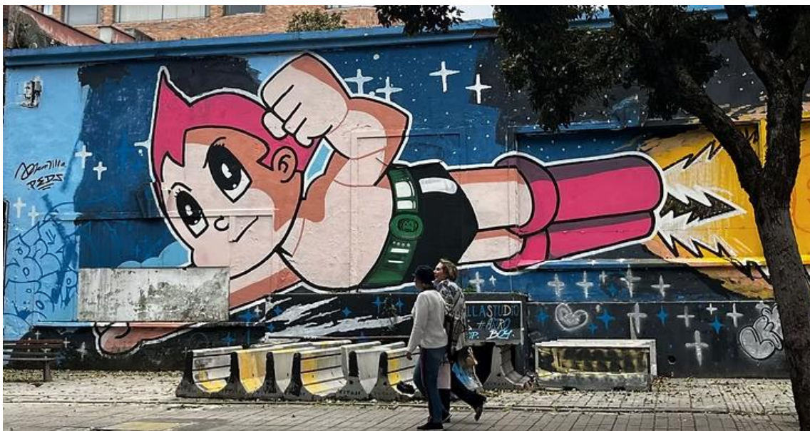
Figura 6. Mural urbano de la famosa serie Astro Boy en la Ciudad de Bogotá, Colombia, 2022.

Esta estética visual, que era ya notoria en los animés , tuvo un impacto directo en la producción artística de los jóvenes de la época, quienes empezaron a tomar como ejemplo este tipo de series para plasmarlo de diferentes maneras. Se puede evidenciar en varias ciudades del país, como Medellín, Bogotá y Cali, murales donde se podían evidenciar las reinterpretaciones de los jóvenes hacia este tipo de series, por lo que se podía ver a Naruto con la bandera de Colombia o Goku lanzando un Kamehameha en una pared de un barrio del país.