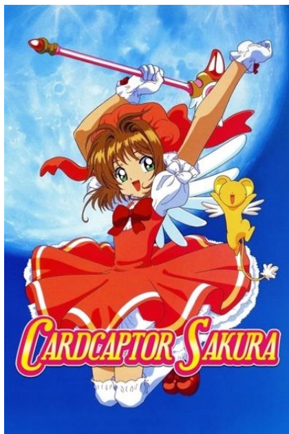
Figura 5. Sakura, cazadora de cartas, 1998.

Un ejemplo que reúne todos estos elementos es Sakura Card Captor , una serie que comenzó a emitirse en Colombia en la década de 2000. La historia gira en torno a Sakura Kinomoto , una joven que, junto a su peluche guardián Kero , debe recolectar cartas mágicas para evitar que causen caos en el mundo. Esta serie fue una de las primeras en combinar acción y romance de manera equilibrada. En términos gráficos, logró establecer una conexión especial con su audiencia gracias al uso de líneas delicadas, colores pasteles, diseños estilizados y una gran atención al detalle en el vestuario y los objetos que rodeaban a los personajes, como varitas mágicas, cartas y símbolos místicos.