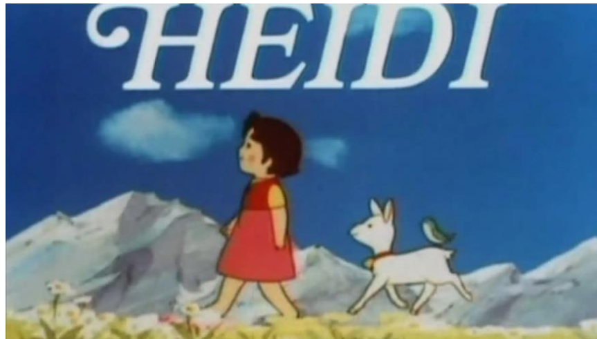
Figura 3. Heidi, la niña de los Alpes, 1974.

Heidi, la niña de los Alpes (fig. 3), nos cuenta la historia de una niña huérfana que vive con sus abuelos en los Alpes, la serie se centra en todas las aventuras de una pequeña niña alegre, contando temas como la vida rural, los valores familiares, la amistad y el amor por la naturaleza, con una animación muy sencilla pero emotiva, llenaba el corazón de todos los televidentes, marcando generaciones enteras por toda su historia conmovedora, que hacía que muchos se sintieran identificados.