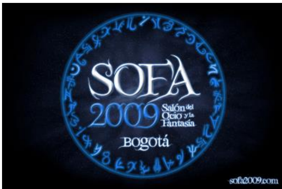
Figura 8. Identificador visual oficial del SOFA Bogotá, Colombia, 2009.

Animecon. Estas reuniones se convirtieron en espacios fundamentales para la expresión de identidades juveniles alternativas y para el intercambio creativo.