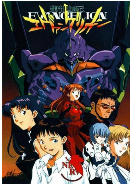
Figura 9. Neon Genesis Evangelion , 1995.

combatirlos, una organización llamada NERV crea a los Evangelion (EVAs), robots gigantes pilotados por adolescentes cuidadosamente seleccionados. Uno de ellos es Shinji Ikari, un joven introvertido con profundos conflictos emocionales. Él es el protagonista de la serie, por lo que gran parte de la historia gira en torno a sus constantes luchas internas y traumas personales.