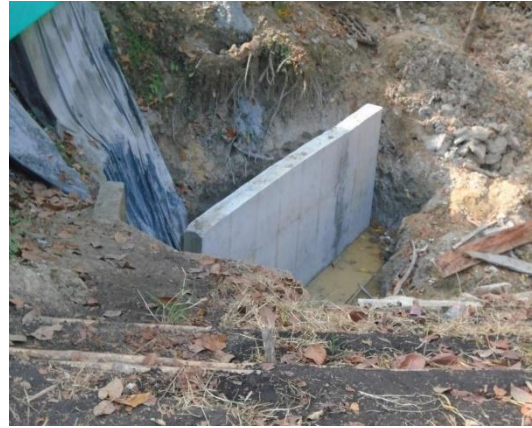
figura #12 muro de contención