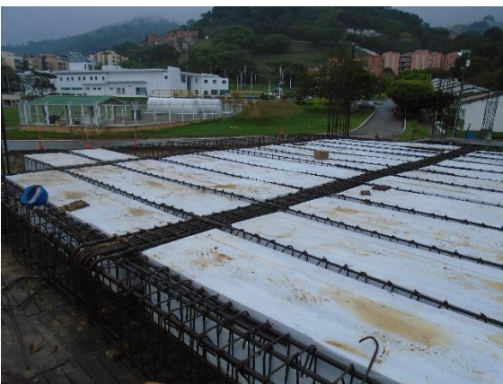
fig#19 instalación de casetones en placa de entepiso