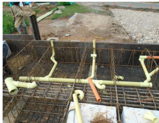
fig#20 tubería sanitaria placa entepiso