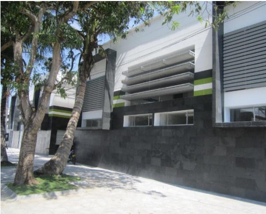
Figura #5 fachada frontal del centro de salud.

Esta labor fue desarrollada del 5 al 11 de diciembre 2014 en la obra tomando las cantidades y del 11 al 16 de diciembre del 2014 en la oficina realizando la respectiva acta final.