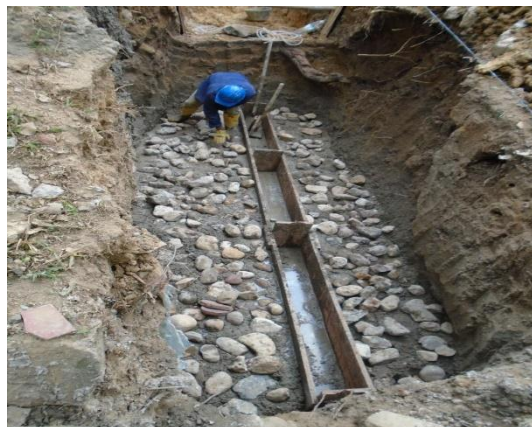
figura #10 Concreto Ciclópeo (60% concreto simple f_c = 210 \text{ Kg/cm}^2 )