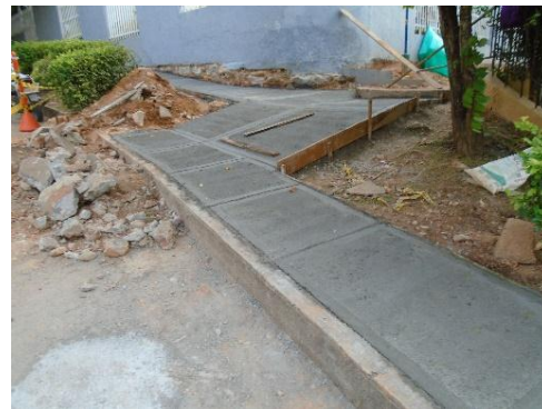
fig.#6 instalación de andenes en concreto 2500psi