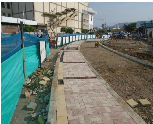
Figura #3 instalación de adoquín y línea Amarilla en el borde.