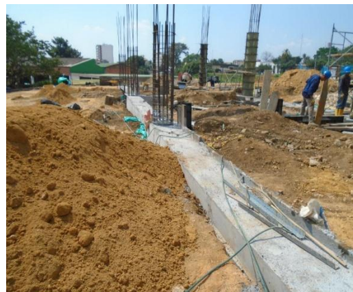
Fig #13 vigas de cimentación (0.7 x 0.7 m)