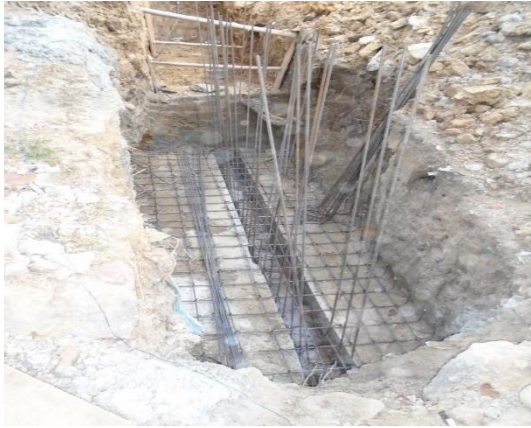
Figura #11 armada de acero de refuerzo