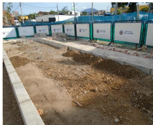
figura #4 material adecuado para la compactación