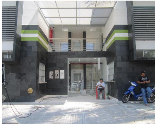
Figura#6 entrada principal del centro de salud.