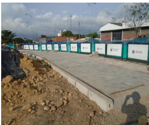
Figura #1 colocación de losa gris con línea de Guía para las personas invidentes.

Esta labor fue desarrollada del 24 de nov al 4 diciembre del 2014.