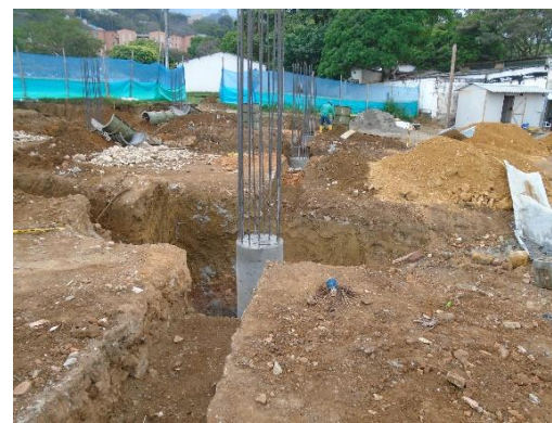
fig#12. Columna 1-B