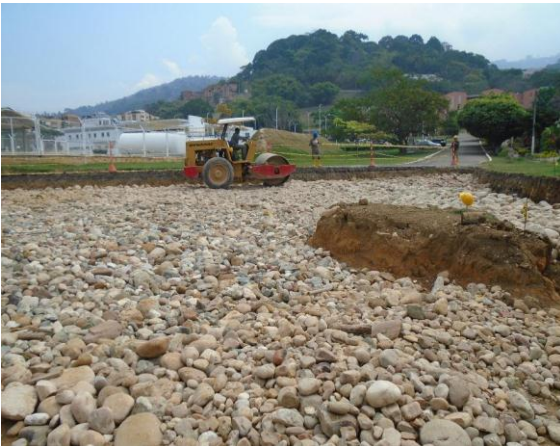
Fig#17 instalación de pedraplen en la vía