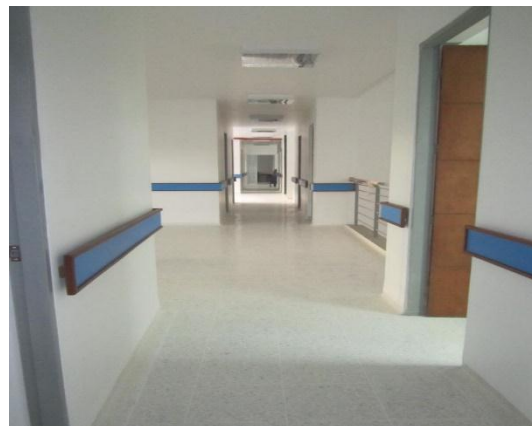
Figura #8 interior segunda planta.