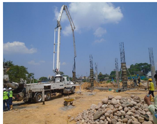
fig #14 concreto de las columnas