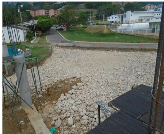
fig#18 instalación de pedraplen