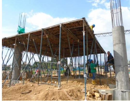
Fig#16 armado de estructura de placa