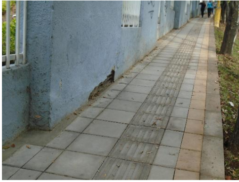
Figura #7 instalación de espacio público