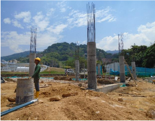
Fig#15 columnas concreto (d=0.7 m)