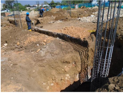
Fig.#9 excavación vigas de cimentación