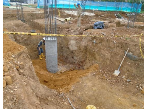
fig#10 relleno con material seleccionado