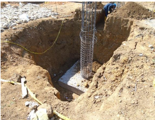
Fig.# 11 cimentación de la estructura