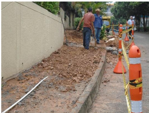
Figura #5 demolicion de andenes en concreto

Mi función en esta obra era la realización de pedidos de materiales y/o herramientas necesarias para la óptima ejecución de la obra, por otra parte definir las pendientes de las rampas de espacio público fueran pendientes moderadas las cuales permite acceso para las personas en sillas de ruedas, esta dediciones fueron basadas según el “MANUAL PARA DISEÑO Y CONSTRUCCION DE ESPACIO PUBLICO DE BUCARAMANGA”