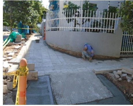
figura#8 instalación de rampa para acceso peatonal