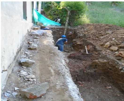
Figura #9 excavación manual

En el plan de trabajo estipulado inicialmente se tenía planeado que iba a estar en esta obra hasta el 20 de enero del 2015 pero por motivos de días festivos y viajes que realizaron el personal de la obra para las festividades realizadas en el mes diciembre se retrasó la obra en unos días.