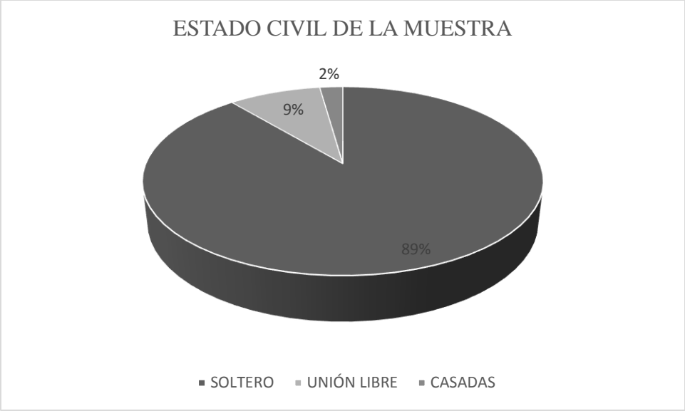
Figura 1. Estado civil de la muestra.