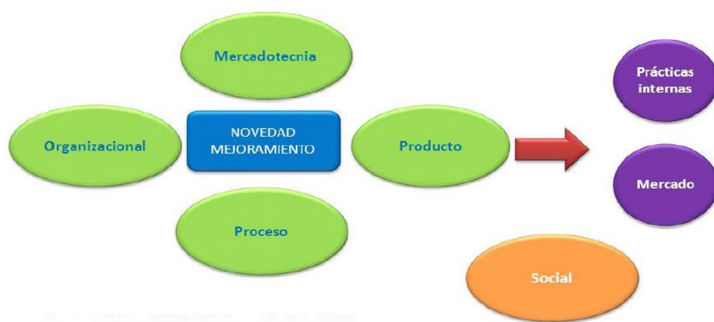
Figura 1 Innovación social en los contextos actuales