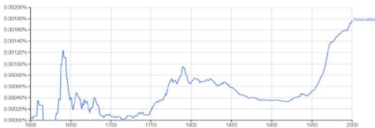
Figura 2 Frecuencia del término innovación a lo largo del tiempo

La principal modificación del concepto se presenta hacia finales del siglo XIX, con el “espíritu de la innovación”, motivado por la ingeniería y la economía en la Revolución Industrial. La racionalidad tecnológica le da connotación funcional e instrumental a la innovación como vector del progreso. En el siglo XIX, el innovador es generador de ideas de progreso que están ligadas a situaciones de orden económico y de producción material. Esta nueva acepción cobra aún más fuerza después de las guerras mundiales. En 1934, Schumpeter, en The Theory of Economic Development , presentó las herramientas teóricas y primeras conceptualizaciones para darle el sentido contemporáneo a la innovación.