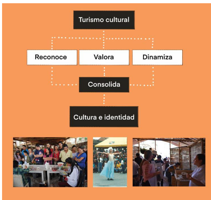
Figura 7. Función del turismo cultural en el Carmen de Viboral. Autoría propia

3.4 Objetivo 3: Identificar el rol de las estrategias del turismo cultural en la construcción de la identidad carmelitana.