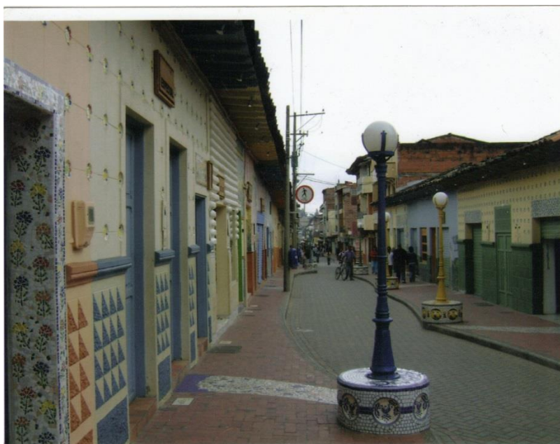
Figura 1. Calle de la cerámica 2008.

Para el municipio del Carmen de Viboral es muy importante resaltar que su identidad va más allá del oficio artesanal, claramente siendo este uno de los más representativos o por el cual más se le reconoce; pero desde el turismo se ha venido haciendo énfasis en rescatar esas otras tradiciones con las cuales las personas pertenecientes a esta región se sienten identificadas y orgullosas de lo que hacen. Es así, como la pregunta que se desea responder con el artículo: ¿Cuál ha sido la relación y el papel del turismo cultural con los símbolos y valores identitarios del Carmen de Viboral?