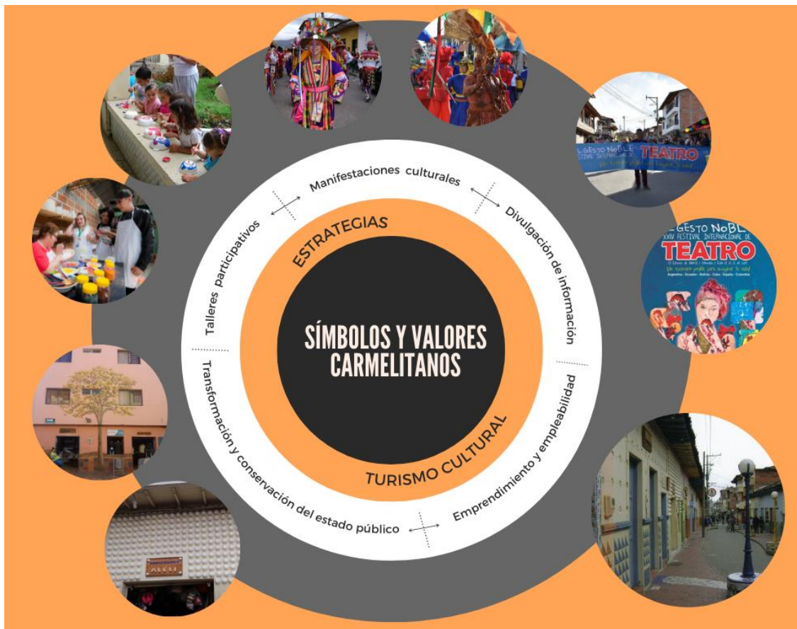
Figura 6. Símbolos y estrategias. Autoría propia.

Es a partir de los símbolos y valores Carmelitanos que se han generado distintas estrategias que buscan reconocer la importancia de estos en su territorio (Figura 6). La transformación y conservación del espacio público como estrategia de imposición de una estética propia, género en algún momento discusiones y escepticismo en quienes se veían directamente afectados por la transformación de sus fachadas y negocios, ya que como lo dice Sanín (2010, pp. 27) “consiste en la imposición de un comportamiento estético, es decir, en la instauración de unos ritmos, formas, valores en los que los individuos tienen que participar para insertarse afectivamente a la nación y reafirmar su sentido de pertenencia.”