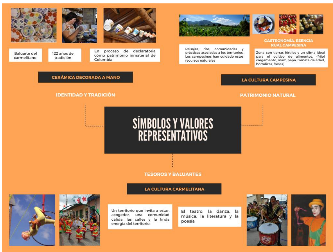
Figura 5. Símbolos y valores representativos del Municipio del Carmen Viboral. Autoría propia. Fotos proporcionadas por el Instituto de Cultura del Carmen de Viboral.

A partir de la metodología planteada se identificaron las principales actividades, oficios y manifestaciones culturales que han acompañado a los Carmelitanos (Figura 5). Además, conocer en primera instancia su ubicación y condiciones geográficas permitió tener una idea de cuales son sus mayores riquezas naturales y culturales.