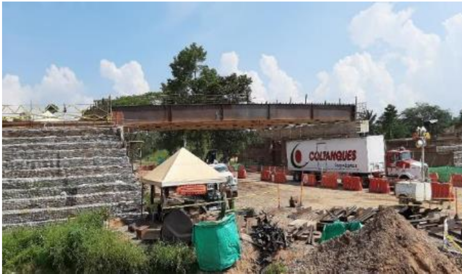
Figura 17. Puente Rancho Camacho. Gran Vía Yuma