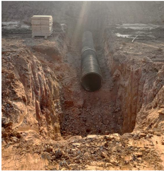
Figura 26. Instalación de tubería Gran Vía Yuma

Como parte de la construcción de la vía, se procede con la instalación de las tuberías de las alcantarillas, se excava el lugar de la tubería, se coloca una base de solado, se construye la estructura en concreto para proteger la tubería de las cargas y, por último, se dejan las cajas de encole y descole. Se prosigue con la instalación de los filtros viales y se inicia la instalación de la carpeta asfáltica para terminar la estructura de la vía, comenzando con el riego de imprimación, la aplicación del MDC-25 y por último el MDC-19.