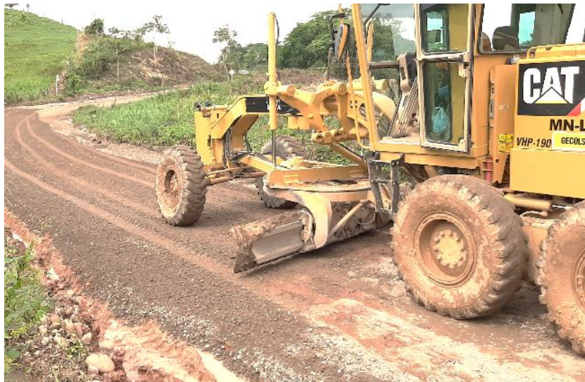
Figura 21 Mantenimiento de vía existente con base granular Gran Vía Yuma.