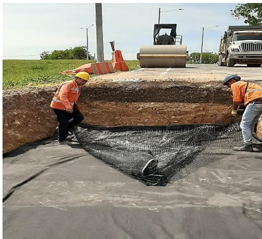
Figura 9. Instalación de geomalla y geotextil. Gran Vía Yuma.

Seguido de esto, se examina el estado del terreno y se toma la decisión del procedimiento a seguir. En este caso se necesitó un mejoramiento de subrasante por medio de geomalla y geotextil, como se contempla en la Figura 7, y la estabilización de terraplén de corona con cal, como se muestra en la Figura 8, evitando la posibilidad de una nueva grieta sobre la carpeta asfáltica. Este proceso se repitió en ocho ocasiones más alrededor del tramo.