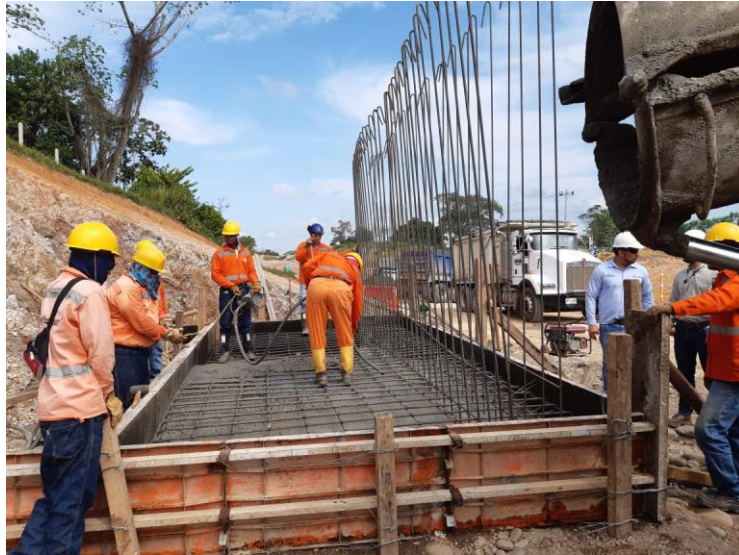
Figura 36. Vaciado de concreto para zarpa de módulo 1. Gran Vía Yuma

Esta vía lleva la reutilización de dos estructuras existentes para los puentes. En estos se realiza pruebas de resistencia y con estos resultados se opta por la construcción de contrapesos para garantizar la estabilidad de las estructuras con el paso de vehículos. Estas estructuras se realizan con concreto ciclópeo y en el interior de ellas se coloca un relleno de terraplén.