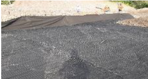
Figura 13 Instalación de Geomalla y geotextil. Propia. Gran Vía Yuma.