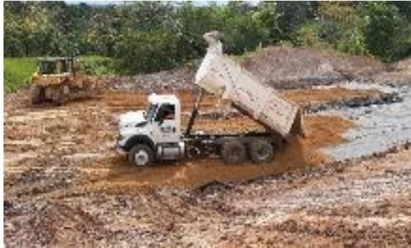
Figura 15 Instalación de Terraplén de Corona. Gran Vía Yuma.

Por último, se colocó las capas de terraplén de cuerpo y corona, representada en la Figura 15, la estabilización con cal de estas, la capa de subbase granular y base granular con el objeto de tener listo para proseguir con la aplicación de la carpeta asfáltica.