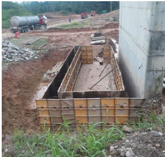
Figura 37. Formaleta para muro de contrapeso Puente 3. Gran Vía Yuma

Esta vía lleva la reutilización de dos estructuras existentes para los puentes. En estos se realiza pruebas de resistencia y con estos resultados se opta por la construcción de contrapesos para garantizar la estabilidad de las estructuras con el paso de vehículos. Estas estructuras se realizan con concreto ciclópeo y en el interior de ellas se coloca un relleno de terraplén.