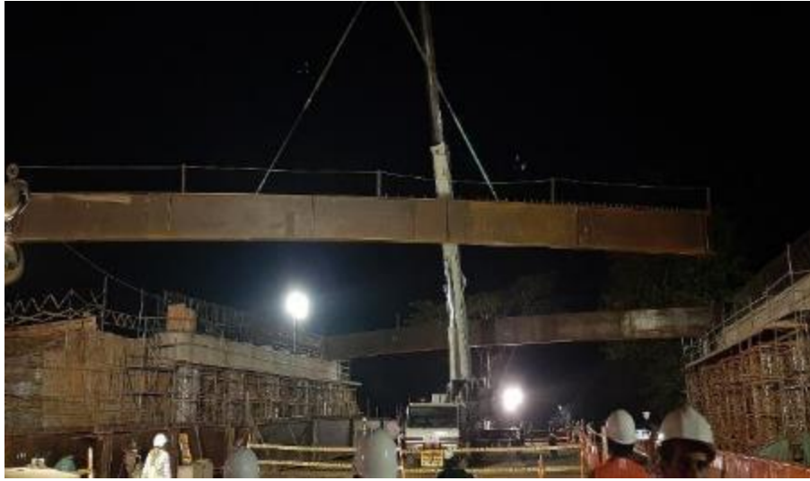
Figura 16. Izaje de vigas metálicas Gran Vía Yuma