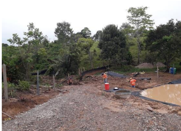
Figura 33. Construcción de canal del sedimentador Gran Vía Yuma