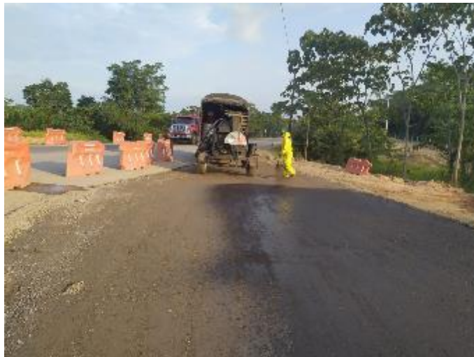
Figura 29. Riego de imprimación. Gran Vía Yuma