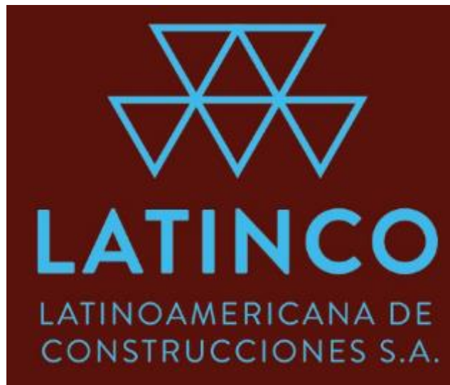
Figura 1. Logo Latinco.

Latinco es una organización que pone el ingenio, la creatividad y el potencial técnico de la ingeniería civil al servicio de la solución de necesidades de las comunidades, para posibilitar prosperidad y mejor calidad de vida. (Ver Figura 1.)