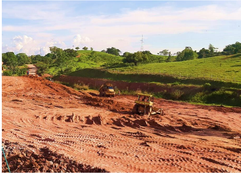
Figura 20 Conformación de zona de nivelación. Gran Vía Yuma.