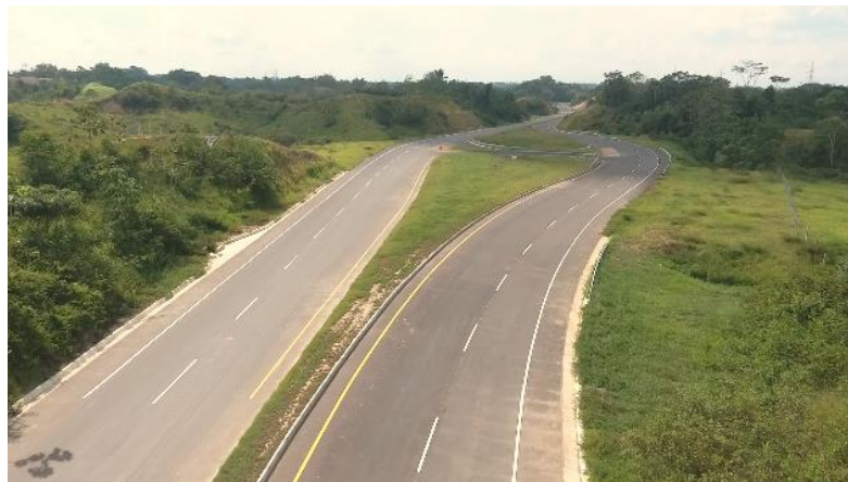
Figura 2. Sector 0. Gran Vía Yuma

El sector 0 va desde Rancho Camacho hasta el intercambiador de La Virgen (vía Bucaramanga – Barrancabermeja). (Véase Figura 2 y 3.)