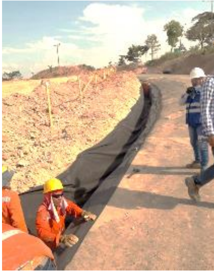
Figura 28. Instalación de filtro de vía Gran Vía Yuma