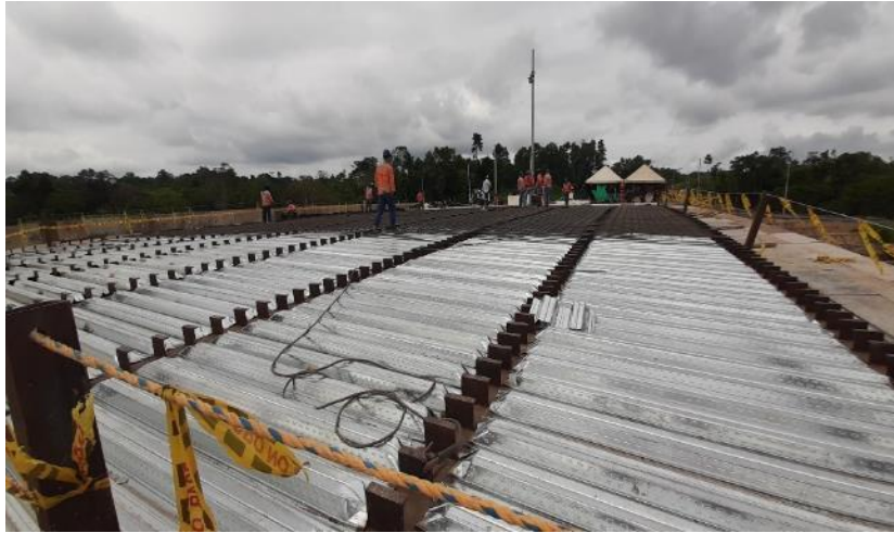
Figura 18. Instalación de Steel Deck Gran Vía Yuma

A su vez, se inició el contrato de la construcción de la Intersección la Virgen el cual comprendía la ejecución de descapote, excavación de material común, conformación de zonas de nivelación con la asistencia de la topografía, el desarrollo de mejoramientos de subrasante utilizando geosintéticos, instalación de tuberías de filtros de vía e instalación de terraplén. Asimismo, el mantenimiento de la vía existente con base granular y crudo de río, escarificando y nivelando con la ayuda de la motoniveladora, como se puede notar a continuación