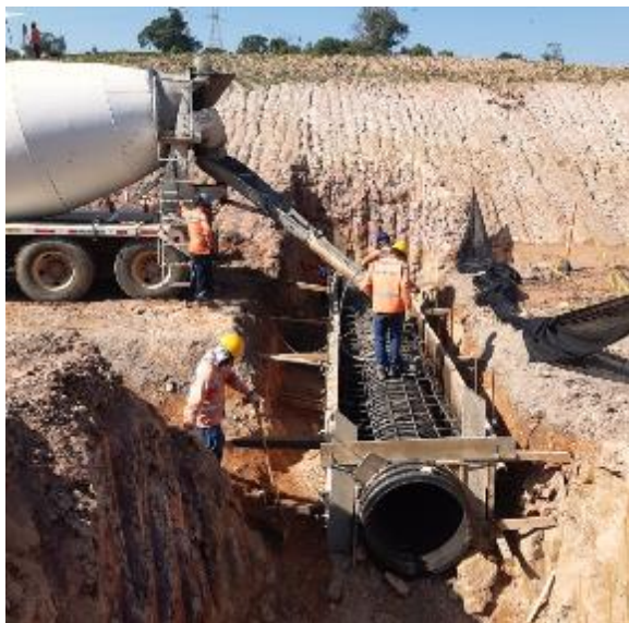
Figura 27. Vaciado de concreto. Gran Vía Yuma