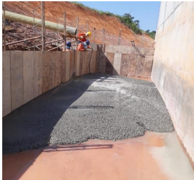
Figura 39. Vaciado de solado para muro de contrapeso Puente 4. Gran Vía Yuma