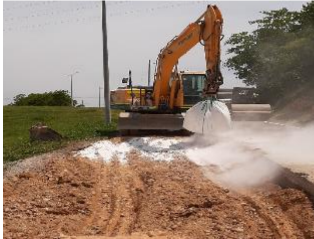
Figura 10. Estabilización de corona con cal. Gran Vía Yuma.

También se realizó el acta de cobro de lo ejecutado en el periodo del sector 3 en donde se desarrolló el proceso de cómo hacer las mediciones y el formato para la revisión de la interventoría.