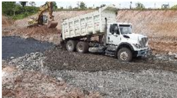
Figura 14 Mejoramiento de sub-rasante con crudo. Gran Vía Yuma.