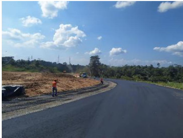
Figura 31. Instalación de MDC-25 Gran Vía Yuma