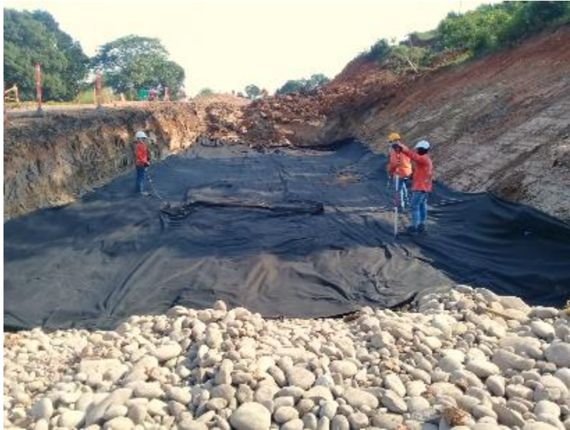
Figura 22 Instalación de Geomalla y geotextil. Gran Vía Yuma.