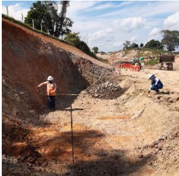
Figura 34. Nivelación de muro de contención, módulo 1 Gran Vía Yuma

Debido a una inestabilidad del terreno, se requirió la construcción de un muro de contención para garantizar el funcionamiento de la vía, el cual se lleva a cabo por medio de un muro de contención con longitud de 180 metros con la supervisión constante de topografía e interventoría para garantizar el adecuado posicionamiento de este.