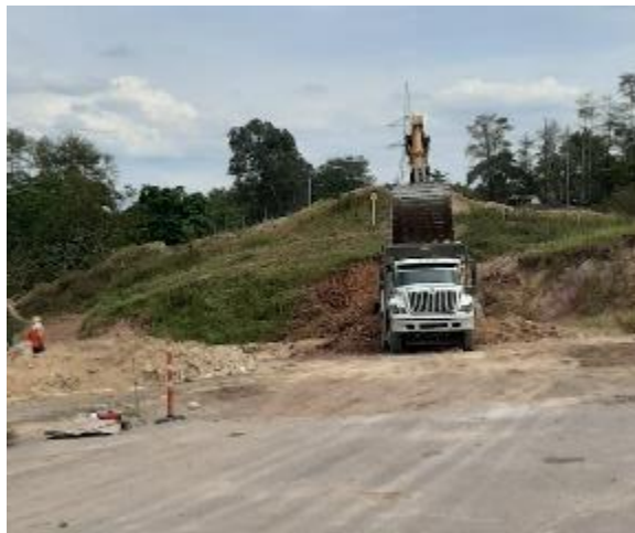
Figura 11. Excavación en material común Gran Vía Yuma.

Además, comenzó la realización de un tramo de vía en el sector 0 K1+800 el cual comprendía la ejecución de varias actividades, empezando por el descapote y la excavación de material común con uso de una retroexcavadora, (véase Figura 9.)