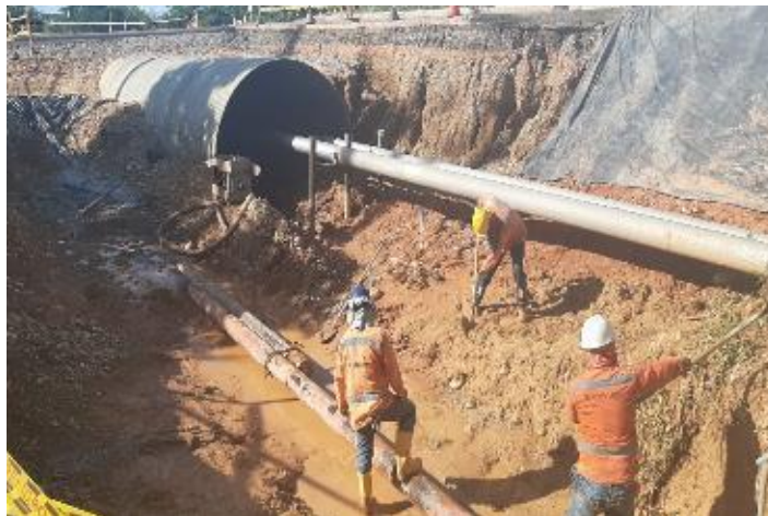
Figura 25. Tubería Promioriente. Gran Vía Yuma

De igual manera, se asistió en la supervisión de la instalación de una capa de base granular para la instalación de tubería en el sector de Promioriente para su posterior instalación.