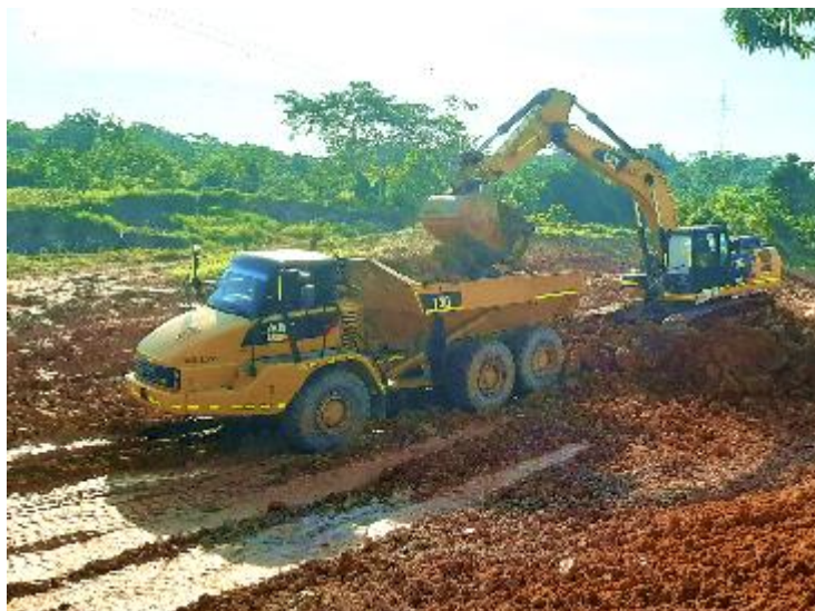
Figura 19 Excavación en material común. Gran Vía Yuma.

A su vez, se inició el contrato de la construcción de la Intersección la Virgen el cual comprendía la ejecución de descapote, excavación de material común, conformación de zonas de nivelación con la asistencia de la topografía, el desarrollo de mejoramientos de subrasante utilizando geosintéticos, instalación de tuberías de filtros de vía e instalación de terraplén. Asimismo, el mantenimiento de la vía existente con base granular y crudo de río, escarificando y nivelando con la ayuda de la motoniveladora, como se puede notar a continuación