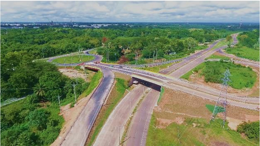
Figura 5. Puente Galán. Gran Vía Yuma