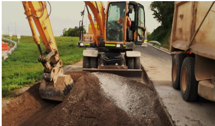
Figura 8 Levantamiento de falla. Gran Vía Yuma

Durante la ejecución de la obra se desarrolla el levantamiento de fallas en la vía del sector 3. Para ello, se localiza la zona donde se encuentra la falla y se realiza un corte en el pavimento. Posteriormente, se hace la extracción de la estructura de pavimento por medio de una retroexcavadora. (Figura 6.)