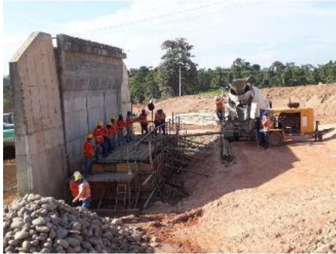
Figura 38. Vaciado de concreto ciclópeo para contrapeso Puente 4. Gran Vía Yuma