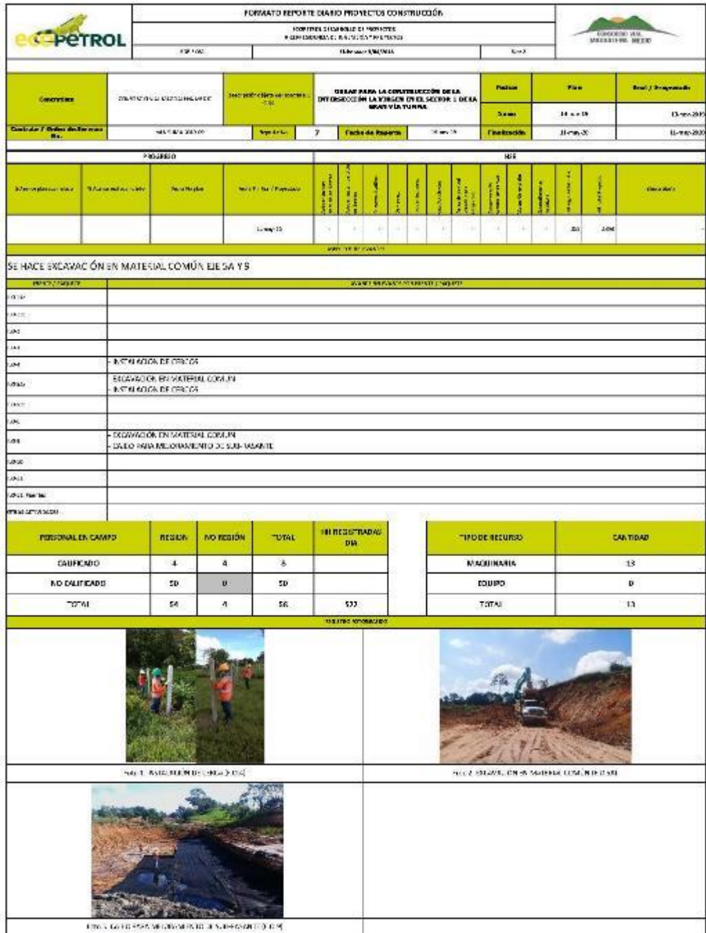
Anexo 3 Formato Informe Diario Fuente: Latinceo. Gran Vía Yuma