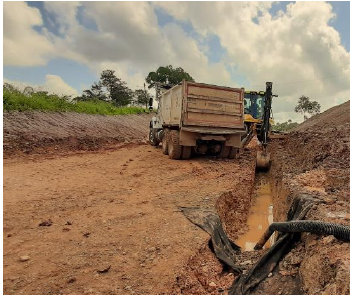
Figura 24 Instalación de Filtro de Vía. Gran Vía Yuma.

En conjunto con estas actividades, se mantuvo un control de seguimiento en apoyo con el programador de obra llevando a cabo la realización de un formato en el cual se ingresaban los datos de ejecución reportados y, de igual manera, la realización de informes diarios de presentación al contratista ECOPETROL.