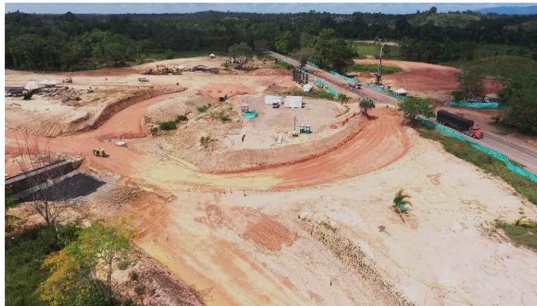
Figura 3. Rancho Camacho. Gran Vía Yuma