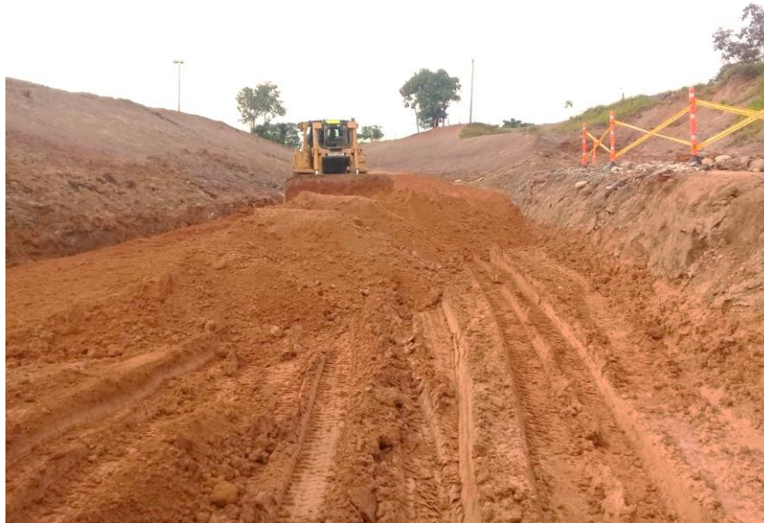
Figura 23 Instalación de Terraplén de Corona. Gran Vía Yuma.