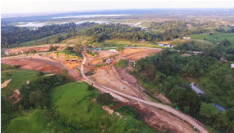
Figura 7. Intersección La Virgen – Sector 0 Gran Vía Yuma