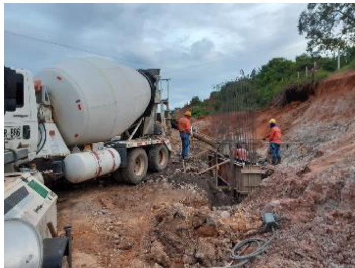
Figura 35. Vaciado de concreto del dentellón del módulo 1. Gran Vía Yuma