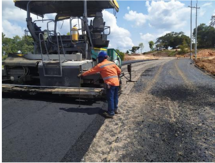
Figura 30. Instalación de MDC-25 Gran Vía Yuma