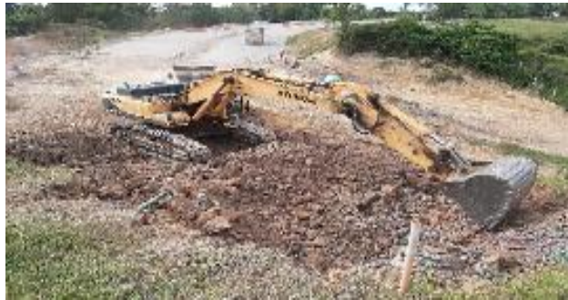
Figura 12 Excavación en material común. Propia. Gran Vía Yuma.

Posteriormente, se realiza la actividad del cajeo para el mejoramiento de la subrasante en el que consiste en la excavación del material con el espesor indicado y con la supervisión de la comisión de topografía. Obteniendo la profundidad indicada, se procede a colocar geomalla, encima la geomalla biaxial, se añade el material de crudo de río, la tapa con geotextil y una capa de arenilla con el propósito de proteger el geotextil, como se muestra en las siguientes figuras: