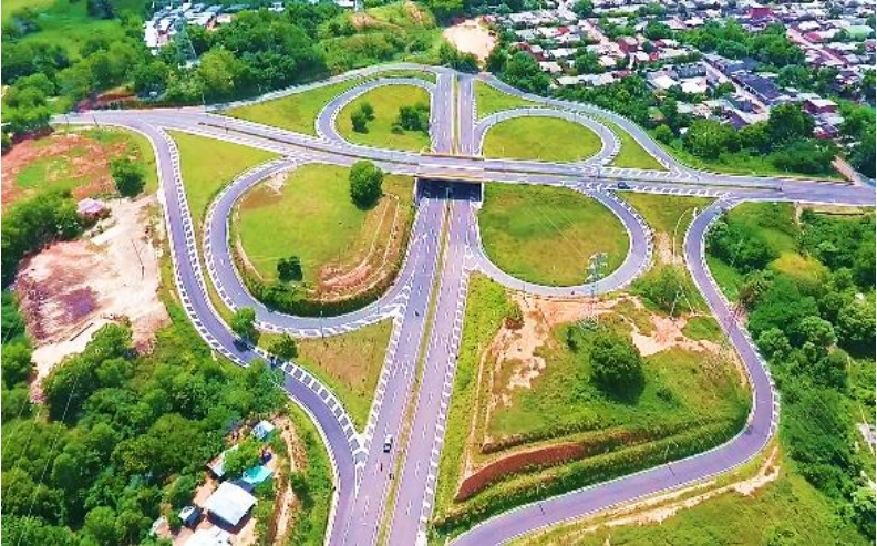
Figura 4. Intercambiador Puerto Wilches. Gran Vía Yuma

El sector 3 va desde el intercambiador de Puerto Wilches (o de El Llanito) al puente Guillermo Gaviria Correa. (Véase Figura 4 y 5.)