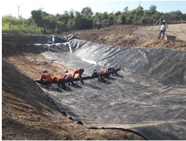
Figura 32. Instalación de geomembrana Fuente: Propia. Gran Vía Yuma

Cerca de la obra, se encuentra una zona acuífera del cual se benefician varias familias y animales. Para evitar la contaminación y seguir con el sostenimiento del medio ambiente y el bienestar de las familias, se opta por la realización de un sedimentador, el cual se encarga de eliminar sólido suspendidos por sedimentación que se retienen en el fondo y por medio de una válvula se controla el flujo del agua que se dirige al acuífero, de esta forma se retiene una gran cantidad de sedimentos y se disminuye la contaminación del acuífero en su mayor medida, a su vez se hace una instalación de trinchos de madera para que disminuya el flujo de la escorrentía y así tener una mayor detención de sedimentos. [10] [11]