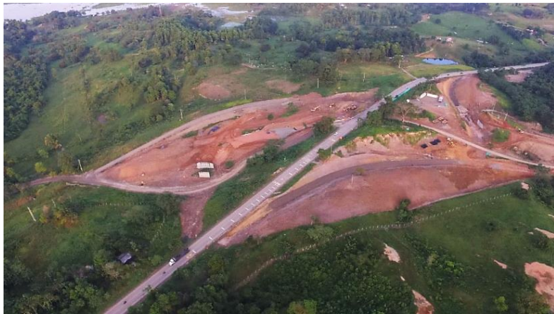
Figura 6. Intersección La Virgen – Boston Gran Vía Yuma

La intersección La Virgen comprende la vía desde el sector 0 y sigue por la vía al Boston. (Véase Figura 6 y 7.)