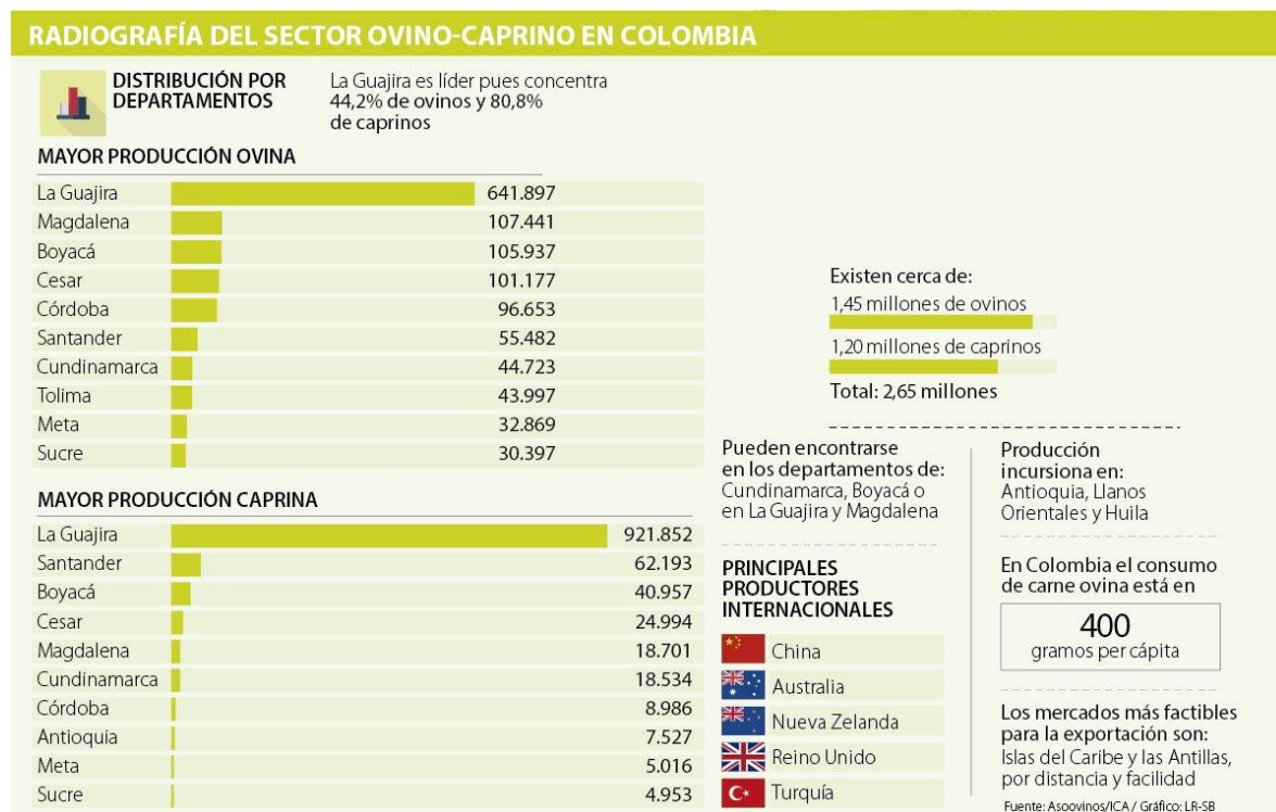
Ilustración 2. Radiografía del sector ovino-caprino en Colombia.