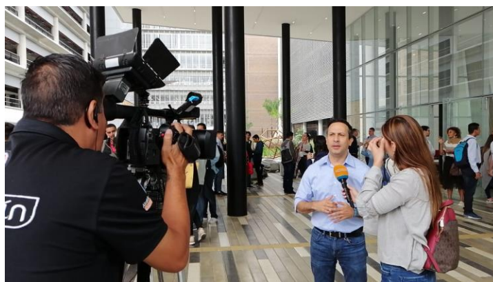
Cubrimiento de medios del foro de candidatos a la Alcaldía de Medellín.