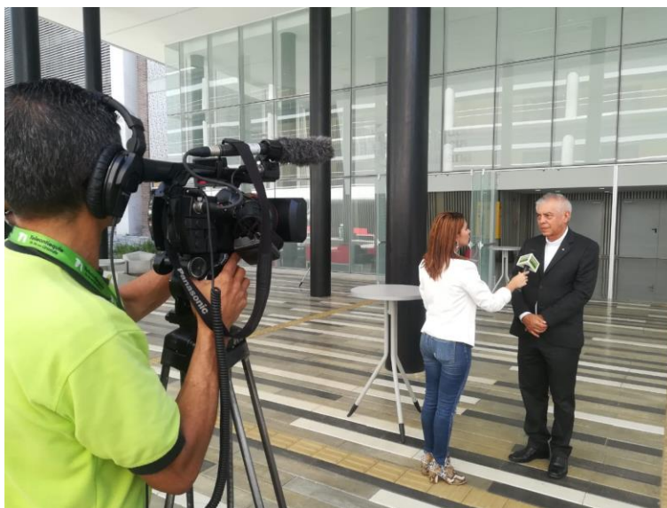
Entrevista ala rector de la UPB seccional Medellín por la inauguración de