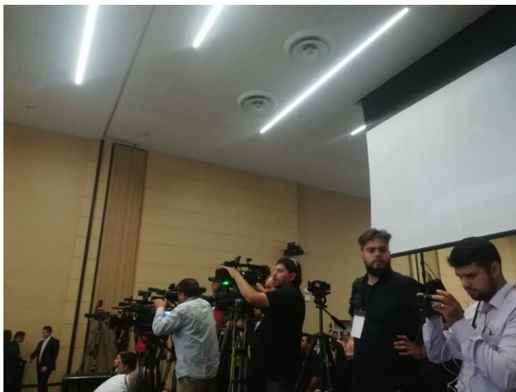
Cubrimiento de medios de la inauguración de Forum