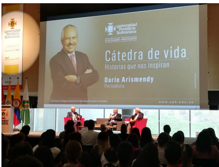
Evento Cátedra de vida en UPB Medellín.