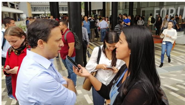
Cubrimiento de medios del foro de candidatos a la Alcaldía de Medellín.