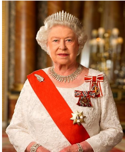
Ilustración 8 Reina Isabel II