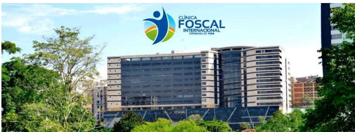
Ilustración 1 Complejo médico Foscal Internacional