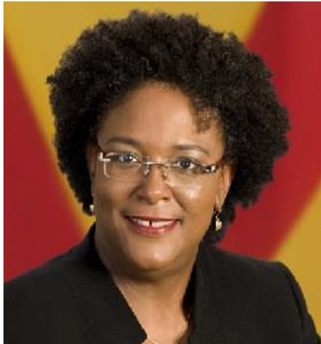
Ilustración 10 Mia Mottley (vice primer ministra)

El poder legislativo es representado por el parlamento que cuenta con dos cámaras conformado por 30 diputados en la Asamblea y 21 diputados para el Senado, elegidos por sufragio universal por 5 años.