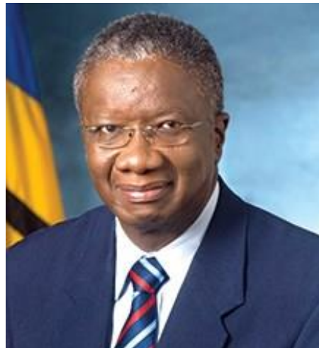
Ilustración 9 Freundel Stuart (primer ministro)