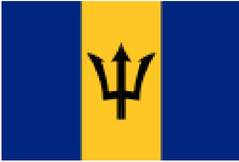
Ilustración 4 Bandera