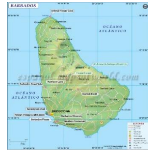
Ilustración 3 Mapa

Barbados es una de las Islas del Caribe el cual su capital y ciudad más poblada es Bridgetown y su divisa es el Dólar de Barbados. Situada en las Antillas Menores, es la más oriental de las islas, localizada entre el Mar Caribe oriental y el Océano Atlántico occidental, al noreste de Venezuela y Trinidad & Tobago, en un punto excéntrico del arco insular externo del Mar Caribe.