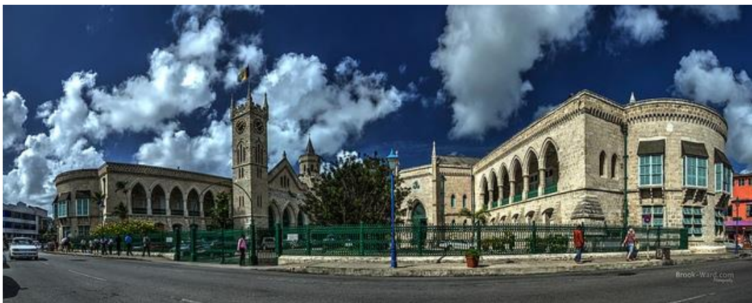
Ilustración 7 Parlamento de Barbados

Barbados ha sido un estado un estado Soberado e independiente desde 1966, siendo una democracia parlamentaria al mismo tiempo sigue siendo un reino de la Commonwealth del Reino Unido, a pesar de eso, el partido político con mayor representación es el parlamento forma gobierno.