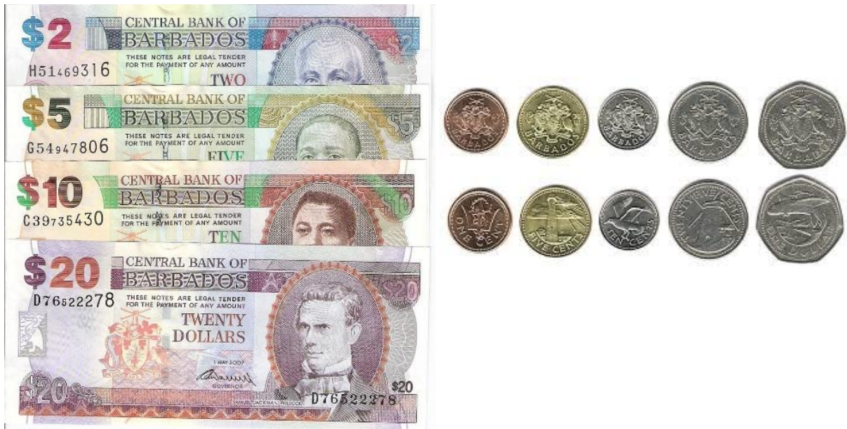
Ilustración 6 Divisa de Barbados