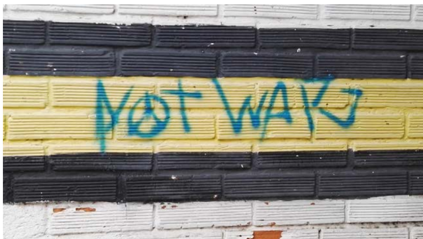
Figura 1. Grafiti “Not War”, Medellín