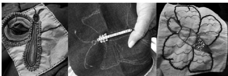
Figura 6.4. Proceso de creación de las mariposas.

Más adelante, se desarrolló el taller de “Bordado de mariposas”, el cual, tenía dos intenciones. La primera, abrir la mente a incluir otros materiales al bordado, además de las lanas y los hilos, como una estrategia de expresión, que incluyó elementos como las mostacillas, los canutillos, las lentejuelas, las cintas y los sesgos, entre otros. La segunda, hacer una reflexión en torno al trayecto que ellas como mujeres han llevado dentro del Costurero Tejedoras por la Memoria de Sonsón a través de una lectura que narra la transformación de las orugas en mariposas, en el que se resaltaban factores relevantes para lograr ese proceso, como el tiempo y el espacio. Un componente esencial en el desarrollo de este taller era darles total libertad para la elección de la base textil a intervenir, de los colores, de los materiales, de las dimensiones a utilizar y del diseño de la mariposa, para de esta forma incentivar la autonomía entre ellas, ya que se evidenció en el primer taller una total dependencia hacia el cumplimiento de proyectos tipo “encargos” (figura 6.4).