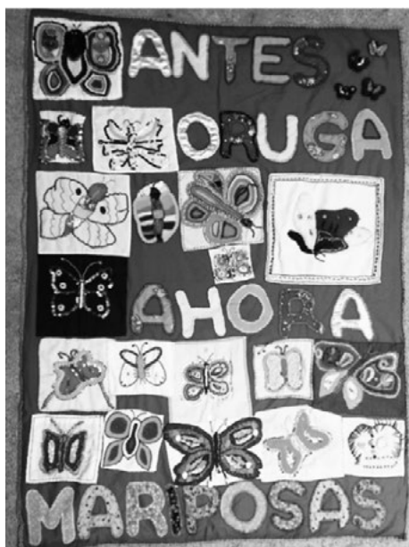
Figura 6.5. Telón “antes orugas ahora mariposas”.

en casa el textil para acomodar las letras e intervenirlas, ubicar las mariposas y coserlas, y darle los acabados y detalles necesarios al telón (figura 6.5).