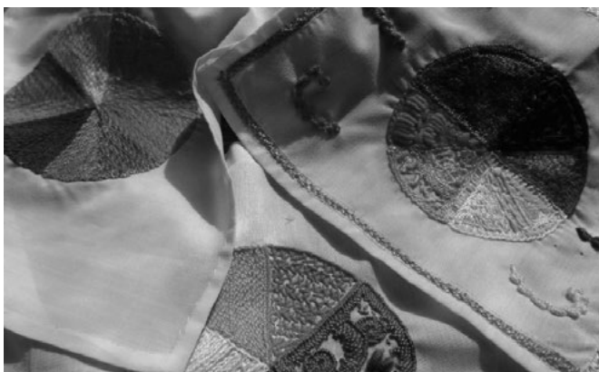
Figura 6.3. Taller de tejido “Círculo de los colores”. Tejedoras en el primer taller de tejido/bordado.

El primer taller de tejido realizado, nombrado “Círculo de los colores”, tenía como fin el reconocimiento del círculo cromático como una herramienta para la creación, que les permitió identificar los colores primarios y secundarios, y a partir de ahí, los colores complementarios. Este ejercicio buscaba, además, reconocer las técnicas de tejido y bordado que las tejedoras conocían, así como satisfacer una necesidad expresada por ellas en los primeros encuentros de aprender a seleccionar colores para sus próximos proyectos y aprender a combinarlos. En este taller participaron 13 mujeres tejedoras (figura 6.3).