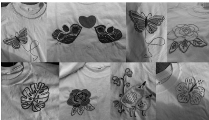
Figura 6.6. Camisetas intervenidas por el Costurero Tejedoras por la Memoria de Sonsón.