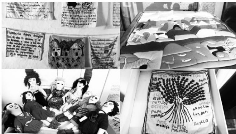
Figura 6.2. Análisis de material visual. Artefactos desarrollados por el Costurero Tejedoras por la Memoria de Sonsón antes del inicio de la investigación y exhibidos en el Salón de la Memoria del municipio de Sonsón.