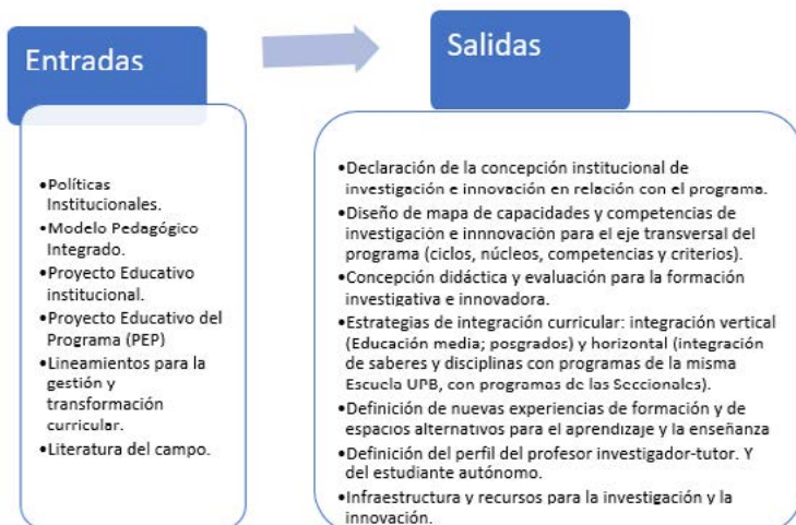
Figura 4. Entradas y salidas

Fuente: Prada, M.S y Vallejo, M. "Gestión curricular por capacidades humanas y competencias en UPB". 2017.Documento de trabajo inédito.