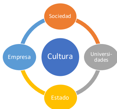
Figura 3. Quíntuple hélice de la Innovación Social

la aplicabilidad de la lógica de la innovación social desde su quíntuple hélice: